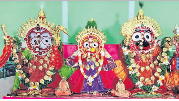
ଭୁବନେଶ୍ୱରସ୍ଥିତ ଇନ୍ଦ୍ର ମନ୍ଦିର ପରିସରରେ ଦାରୁଦିଗ୍ରହଙ୍କ ସୁନାବେଶ ।