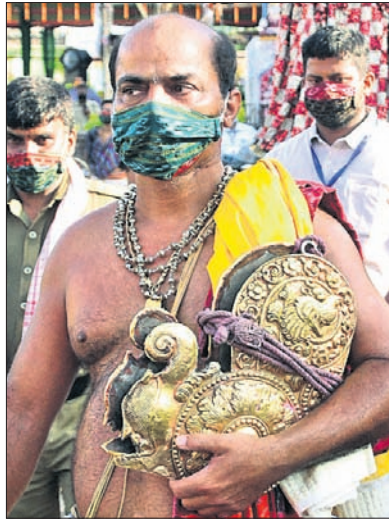
ଦେବୀ ସୁଭଦ୍ରାଙ୍କ ସୁବର୍ଣ୍ଣ କର୍ଣ୍ଣ ।