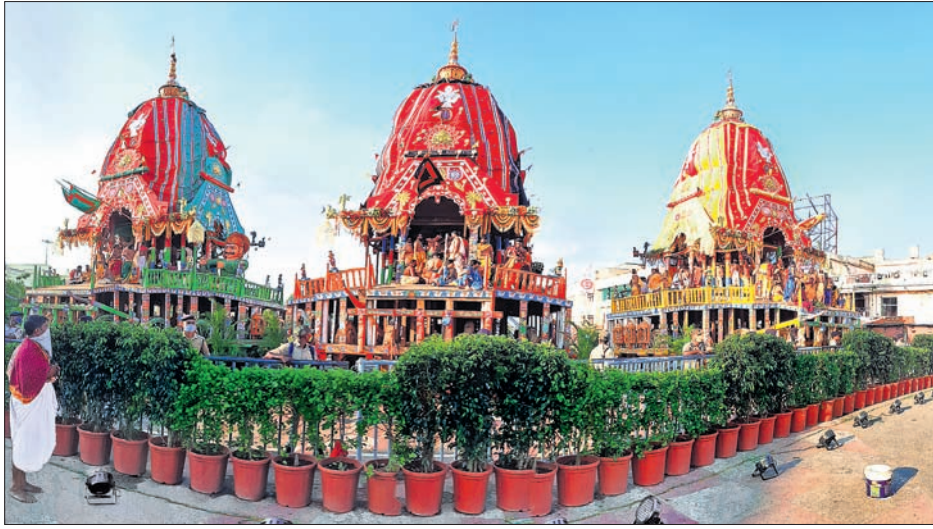
ବଡ଼ଦାଣ୍ଡର ସିଂହଦ୍ୱାର ସମ୍ମୁଖରେ ରଥାରୁଠୁ ଠାକୁର ।