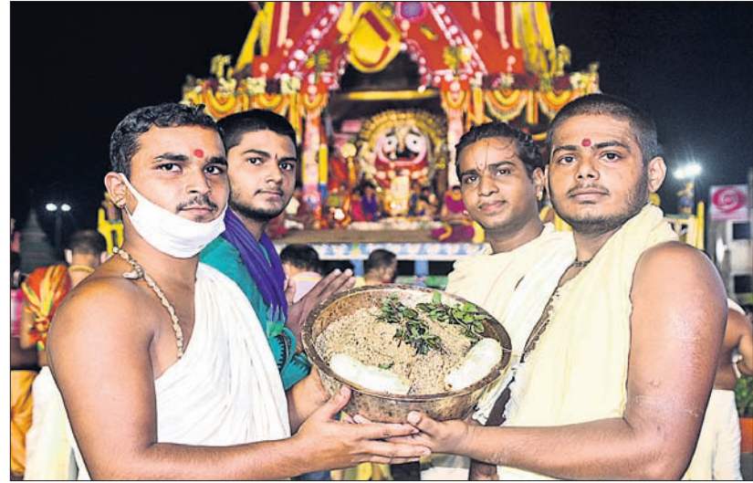
ରଥାରୁଠୁ ଠାକୁରଙ୍କୁ ଭୋଗ ଅର୍ପଣ କରାଯାଉଛି ।