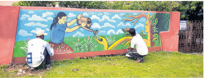
ବୁଦ୍ଧ ଚିତ୍ରକର କାନ୍ଥରେ ଚିତ୍ର କରୁଛନ୍ତି ।