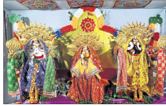
କଟକ ବୋକପୁଣ୍ଡାଳ ଶ୍ରୀଜଗନ୍ନାଥ ମନ୍ଦିରରେ ଠାକୁରଙ୍କ ସୁନାବେଶ ।