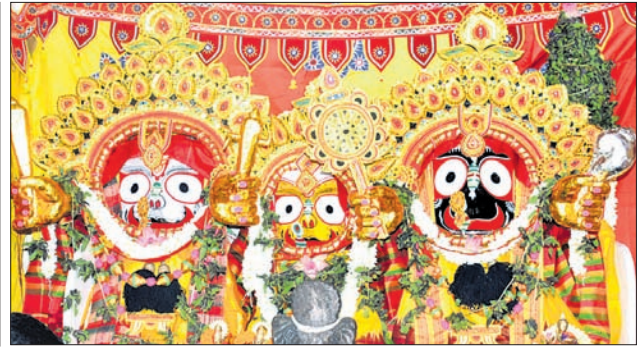
ଭୁବନେଶ୍ୱରସ୍ଥିତ ସୁନିବ-୫ ଜଗନ୍ନାଥ ମନ୍ଦିର ପରିସରରେ ତିନି ଠାକୁରଙ୍କ ସୁନାବେଶ ।