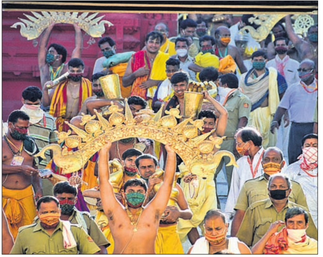
ରଥ ଉପରକୁ ଦାରୁଦିଅଁଙ୍କ ସୁବର୍ଣ୍ଣ କିରୀଟ ଅଣାଯାଉଛି ।