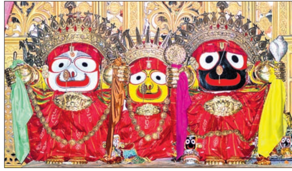
ରାଣାହାଟ ଶ୍ରୀବଳଦେବଜୀଉ ମନ୍ଦିର ପରିସରରେ ତିନି ଠାକୁରଙ୍କ ସୁନାବେଶ ।