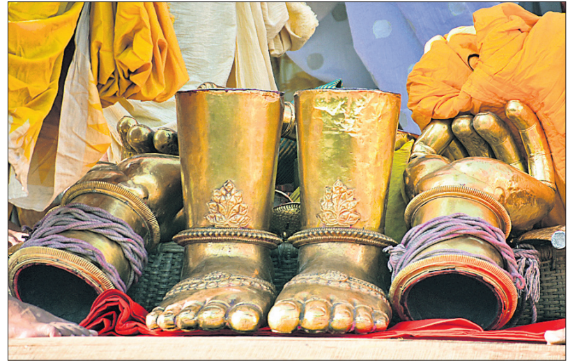
ମହାପ୍ରଭୁଙ୍କ ସୁବର୍ଣ୍ଣ ହସ୍ତ ଓ ପୟର ।