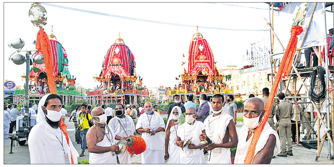
ପୂରୀ ସିଂହଦ୍ୱାରଠାରେ ରଥ ସମ୍ମୁଖରେ ସଂକୀର୍ତ୍ତନ ପରିବେଷଣ କରାଯାଉଛି ।