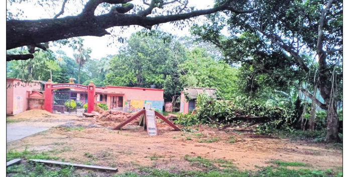
ଅଙ୍ଗନୱାଡ଼ି କେନ୍ଦ୍ର ନିର୍ମାଣ କରାଯାଇଛି ।

ରଞ୍ଜନପୁର ବ୍ଲକ୍ ଅଧୀନ ମୁରୁପାଳ ପଞ୍ଚାୟତସ୍ଥିତ ଖଇରାବାଦ ପାଟଣା ପ୍ରାଥମିକ ବିଦ୍ୟାଳୟ ପରିସର ସଂକଳ୍ପ କାର୍ଯ୍ୟ ବନ୍ଦ କରିବାକୁ ଗ୍ରାମବାସୀଙ୍କ ଦାବି