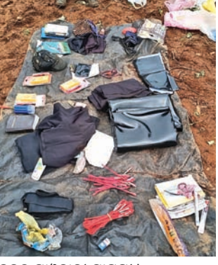
ଜବତ ମାଓବାଦୀ କ୍ୟାମ୍ପ ।