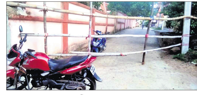
ପ୍ରଶାସନ ପକ୍ଷରୁ ବାଉଁଶ ପୋଡ଼ା ଘଟଣାରେ ବାରିକେଡ୍ କରାଯାଇଛି ।