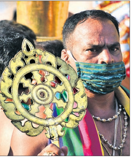
ଶ୍ରୀଜୀଉଙ୍କ ଶ୍ରୀଚକ୍ର ।