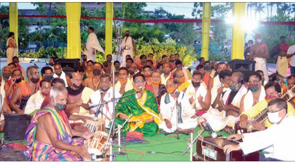
ରଥ ସମ୍ମୁଖରେ ସେବାୟତମାନେ ଭଜନ ପରିବେଷଣ କରୁଛନ୍ତି ।