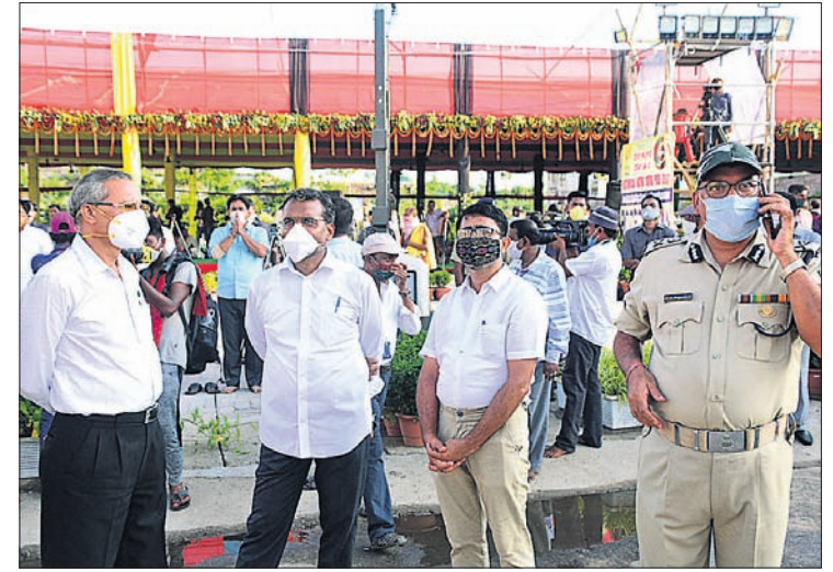
ପ୍ରଶାସନିକ ଅଧିକାରୀମାନେ ବଡ଼ଦାଣ୍ଡରେ ସୁନାବେଶ ସୁପରିଚାଳନା ନେଇ ସ୍ଥିତି ଅନୁଧ୍ୟାନ କରୁଛନ୍ତି ।