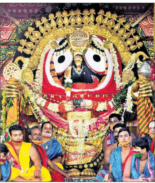
ପୁରୀ ଶ୍ରୀମନ୍ଦିର ସିଂହଦ୍ୱାର ସମ୍ମୁଖରେ ରଥାରୁଡ଼ି ବାବୁଦିଆଁଙ୍କ ସୁନାବେଶ। (ରିପୋର୍ଟ: ପୁଷ୍ପା-୪)