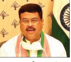
କେନ୍ଦ୍ରମନ୍ତ୍ରୀ ଉର୍ଦ୍ଧ୍ୱାଳ ରାଲିକୁ ସମୋଧିତ କରୁଛନ୍ତି।

ଅବହେଳିତ ହୋଇ ପଡିଥିବା ଗୋଟିଏପୁର ସୁତାକଳ ଖୋଲିବାକୁ କେନ୍ଦ୍ରମନ୍ତ୍ରୀ ଧର୍ମେନ୍ଦ୍ର ପ୍ରଧାନଙ୍କ ଦୃଷ୍ଟି ଆକର୍ଷଣ କରିଛନ୍ତି।