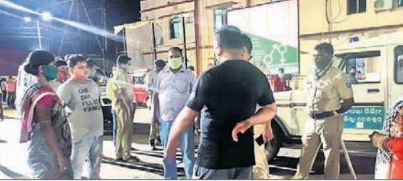
ମେଡିକାଲ ପରିସରରେ ଉତ୍ତେଜନା। ସମ୍ପା ପର୍ଯ୍ୟନ୍ତ ପ୍ରସବ ନ ହେବାରୁ ଚିକିତ୍ସା କରୁଥିବା ଡାକ୍ତର ଡାକ୍ତର ସେହି ଅବସ୍ଥାରେ ଯାହା ଧରାରେ କଟକ ସ୍ଥାନାନ୍ତର କରିବାକୁ କହିଥିଲେ।

ଶିଶୁମୃତ ଜନ୍ମ ଦେଇଥିଲେ। ଜିଲ୍ଲା ଚିକିତ୍ସାଳୟରେ ଡାକ୍ତରଙ୍କ ଅବହେଳା ଯୋଗୁ ଶିଶୁମୃତ ମୃତ୍ୟୁ ହୋଇଥିବା ଅଭିଯୋଗ କରି ପରିବାର ଲୋକେ ଯେଠାରେ ପହଞ୍ଚିବା ପରେ ଉତ୍ତେଜନା ଦୃଷ୍ଟି ହୋଇଥିଲା।