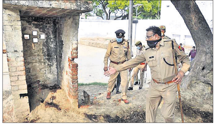
ଉତ୍ତରପ୍ରଦେଶର ବିଖରୁ ଗ୍ରାମରେ ପୋଲିସ୍‌ର ତନାୟନା।

ଉତ୍ତରପ୍ରଦେଶ(ଉପି)ର କୁଖ୍ୟାତ ଗ୍ୟାଙ୍ଗସ୍ତର ବିକାଶ ଦୁବେଙ୍କୁ ଧରିବାକୁ ଯାଇ ଶୁକ୍ରବାର ଭୋର ସମୟରେ କାନପୁର ନିକଟରେ ଜଣେ ଡିଏସ୍‌ପିଙ୍କ ସମେତ ୮ ପୋଲିସ୍ ପ୍ରାଣ ହରାଇଛନ୍ତି। ଏକାଠି ଥିବା ପୂର୍ବରୁ ଅପରାଧୀଙ୍କ ଅତୀତ ଆକ୍ରମଣରେ ଅନ୍ୟ ୭ ପୋଲିସ୍ କର୍ମଚାରୀ ଆହତ ହୋଇଛନ୍ତି। ଦୁର୍ଘଟଣା ବିକାଶ ଖସିପକାଇବାରେ ସକ୍ଷମ ହୋଇଥିବାବେଳେ ଅନ୍ୟ ଏକ ଏକାଠି ଥିବା ପୂର୍ବରୁ ଅପରାଧୀଙ୍କ ନିହତ ହୋଇଛନ୍ତି। ମୃତ ପୋଲିସ୍‌ର ନିଦ ହଜାଇଦେଇଥିବା ବିକାଶ ଦୁବେଙ୍କ ବିରୋଧରେ ୬୦ଟି ଆପରାଧୀଙ୍କ ମାମଲା ରହିଛି। କାନପୁରସ୍ଥିତ ଚୌକିରେ ଥାନା ଅଧୀନ ବିଖରୁ ଗ୍ରାମରେ ବିକାଶଙ୍କ ଉପସ୍ଥିତ