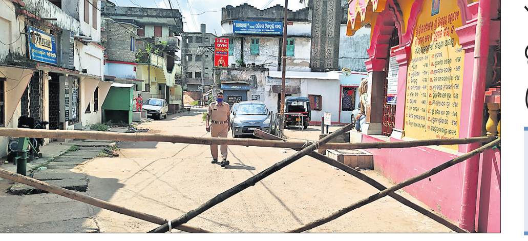
କଟକ ରାଣାହାଟ ସ୍ଥିତ ମାଲିଆହି ଅଞ୍ଚଳକୁ ଶନିବାର କଣ୍ଠେନେମ୍‌ସ୍ କୋର୍ଡ୍ ଘୋଷଣା ପରେ ସେଠାକାର ରାସ୍ତାକୁ ବନ୍ଦ କରାଯାଇଛି।

ସ୍ୱାସ୍ଥ୍ୟ ଓ ପରିବାର କଲ୍ୟାଣ ବିଭାଗ ତଥ୍ୟରୁ ଜଣାପଡିଛି। ସେପଟେ ଶନିବାର ଆଉଜଣେ କରୋନା ଆକ୍ରାନ୍ତଙ୍କ ଅନ୍ୟ ରୋଗରେ ମୃତ୍ୟୁ ଘଟିଛି। ଫଳରେ ଅନ୍ୟ ରୋଗରେ ମରିଥିବା କରୋନା ଆକ୍ରାନ୍ତଙ୍କ ସଂଖ୍ୟା ୧୦ ହୁଏ। ଲକ୍ଷ୍ମୀନଗର ହସ୍ପିଟାଲରେ ପରୀକ୍ଷା କରୁଥିବା ରାଜ୍ୟରେ କରୋନା ସଂକ୍ରମଣ ବଢ଼ିବା ଆରମ୍ଭ କରିଛି। ମାସକ ମଧ୍ୟରେ କରୋନାଜନିତ ମୃତ୍ୟୁ ସଂଖ୍ୟା ୩୫ରେ ପାଠିତ ଥିଲେ। ସେହିଭଳି ଖୋର୍ଦ୍ଧାର ମୃତ ଦୁଇଜଣଙ୍କ ମଧ୍ୟରୁ ଜଣେ ୬୪ ବର୍ଷୀୟ ବ୍ୟକ୍ତି ମଧୁମେହ ରୋଗରେ ଓ ଅନ୍ୟଜଣେ ୫୧ବର୍ଷୀୟ ପୁରୁଷ ଯକ୍ଷ୍ମା ରୋଗରେ