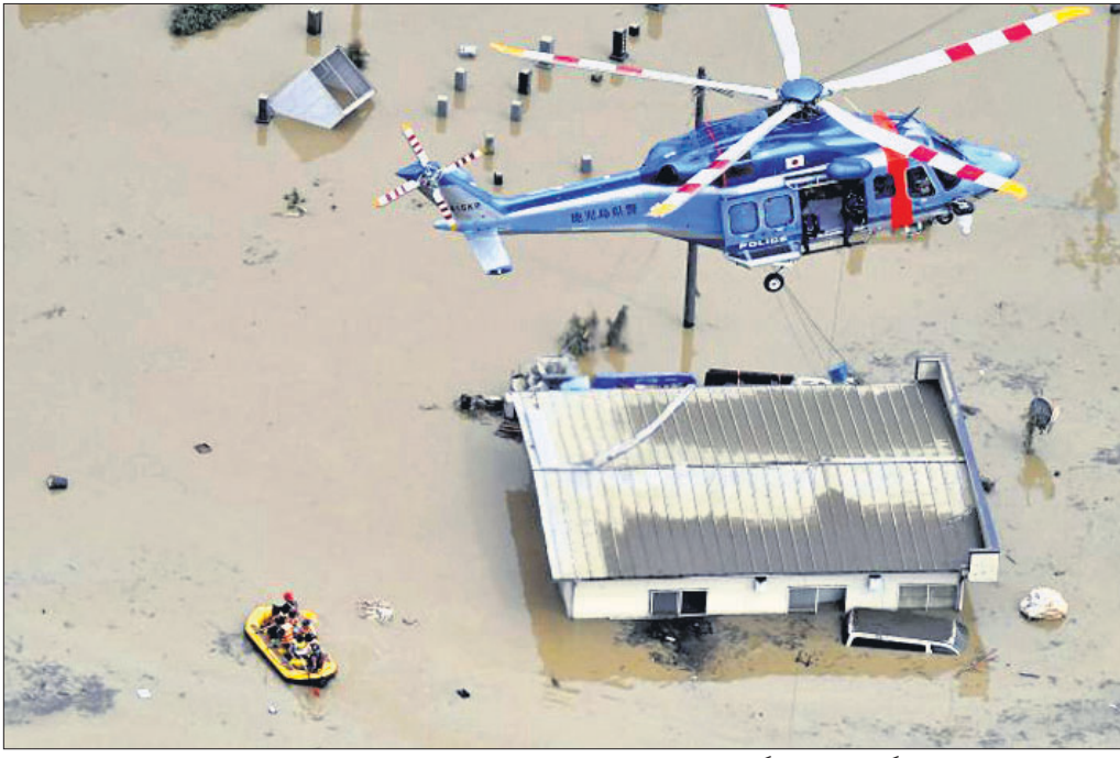
ଜାପାନରେ ପ୍ରକଳ୍ପକରା ବନ୍ୟା ଚାଣ୍ଡ ବଢ଼ିଛି । ହିଟୋଯୋଶିରେ ଆକାଶମାର୍ଗରୁ ଉଦ୍ଧାର କାର୍ଯ୍ୟ ଚାଲିଛି ।