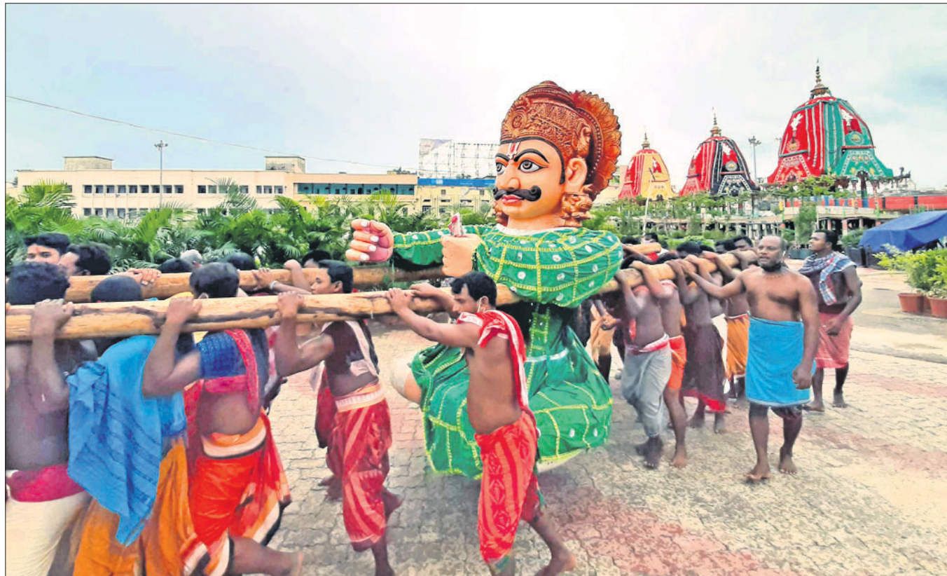
ରଥଯାତ୍ରା ସମାପନ ପରେ ରବିବାର ସାରଥିଙ୍କୁ ରଥକୁ କଢ଼ାଯାଇ ଦୋଳବେଦି କୋଣ ପରିସରକୁ ଭୋଜ ସେବକମାନେ କାନ୍ଧେଇ ନେଉଛନ୍ତି।

ସ୍ଥାନୀୟ ଆକ୍ରାନ୍ତ ରହିଛନ୍ତି। ଗୋଟିଏ ଦିନରେ ରାଜ୍ୟରେ ଟିକ୍ସ ହୋଇଥିବା ସ୍ଥାନୀୟ ଆକ୍ରାନ୍ତଙ୍କ ମଧ୍ୟରେ ଏହା ସର୍ବାଧିକ। ତେବେ ନୂଆ ଆକ୍ରାନ୍ତଙ୍କ ମଧ୍ୟରୁ ଗଞ୍ଜାମ ଜିଲ୍ଲାରେ ସବୁଠୁ ଅଧିକ ୧୨୬ ଜଣ ରହିଛନ୍ତି। ସେହିପରି କଟକ ଜିଲ୍ଲାରେ ୯୪, ସୁନ୍ଦରଗଡ଼ ୭୬, ଖୋର୍ଦ୍ଧା ୭୬, କେନ୍ଦୁଝର ଓ ଯାଜପୁର ୨୫ ଜଣ ଲେଖାଏ, ନୟାଗଡ଼ ୨୪, ଭଦ୍ରକ ୧୬, ସମ୍ବଲପୁର ୧୩, ଗଜପତି ୧୨, ଅନୁଗୋଳ ୧୧, ବାଲେଶ୍ୱର ଓ ପୁରୀ ୮ ଜଣ ଲେଖାଏ, ମୟୂରଭଞ୍ଜ ୬, କେନ୍ଦ୍ରାପଡ଼ା ୫, ବଲାଙ୍ଗୀର ୩, କଳାହାଣ୍ଡି ଓ ନବରଙ୍ଗପୁର ୨ ଜଣ ଲେଖାଏ, କନ୍ଧମାଳ ଓ ମାଲକାନଗିରି ଜଣେ ଲେଖାଏ ରହିଛନ୍ତି। ଏଥିସହ ପଶ୍ଚିମବଙ୍ଗରୁ ଫେରିଥିବା ଆଉ ୪ ଜଣ ଏନ୍ଡିଆରଏସ୍ କର୍ମଚାରୀ କରୋନାରେ ସଂକ୍ରମିତ ହୋଇଛନ୍ତି। ଫଳରେ ରାଜ୍ୟରେ ମୋଟ କରୋନା ପଜିଟିଭ୍ ସଂଖ୍ୟା ୯,୦୭୦ରେ ପହଞ୍ଚିଥିବା ପୃଷ୍ଠା-୪