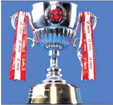
ପ୍ରକାଶ ପାଇଥିଲା। ଆଇଏସ୍‌ଏଲ୍‌ସ୍‌ଲି ଟ୍ରଫି ରାଜ୍ୟର ଏକାଧିକ ସ୍ଥାନରେ ଆୟୋଜନ କରିବା ଲାଗି ଯୋଜନା ରହିଛି।

ଇଣ୍ଡିଆନ୍ ସୁପର ଲିଗ୍ (ଆଇଏସ୍‌ଏଲ୍)ର ୭ମ ସଂସ୍କରଣ ଆୟତ୍ନ ନଭେମ୍ବରରୁ ମାର୍ଚ୍ଚ ପର୍ଯ୍ୟନ୍ତ ରୁଜ୍‌ହାବରେ ଅନୁଷ୍ଠିତ ହେବ। କୋଭିଡ୍-୧୯ ମହାମାରୀ ଯୋଗୁଁ ଏହି ପୁରବଳ ଇଭେଣ୍ଟ ଦୁଇଟି ରାଜ୍ୟ ମଧ୍ୟରେ ଖେଳାଯିବା ସମ୍ଭାବନା ରହିଛି। ପ୍ରତିଯୋଗିତା ଆୟୋଜନ ଯୋଜନାରେ ଗୋଆ ଓ କେରଳ ଆଗରେ ରହିଛନ୍ତି।