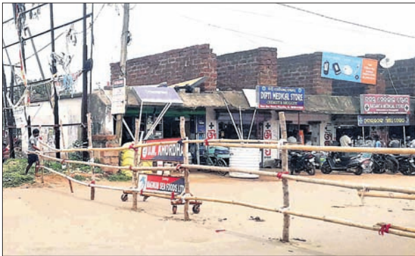
ଖୋର୍ଦ୍ଧା ନୂଆ ବସଷ୍ଟାଣ୍ଡ ରୋଡ୍ରେ ବ୍ୟାରିକେଡ୍ କରି ରାସ୍ତା ବନ୍ଦ କରାଯାଇଛି।

ଆଞ୍ଚଳିକ ଭେଷଜ ଉତ୍ପାଦନା କେନ୍ଦ୍ର (ଆରବିଆରସି)ରେ କୋଭିଡ୍ ପରୀକ୍ଷାଗାର କାର୍ଯ୍ୟ କରୁଛି। ଏବେ ଆରବିଆରସି ରାଜ୍ୟରେ ୧ ଲକ୍ଷରୁ ଊର୍ଦ୍ଧ୍ୱ କୋଭିଡ୍-୧୯ ନମୁନା ପରୀକ୍ଷା କରି ଏକ ନୂତନ ମାଲକୂଖ୍ୟ ସ୍ଥାପନ କରିଥିବାରୁ ମୁଖ୍ୟମନ୍ତ୍ରୀ ନବୀନ ପଟ୍ଟନାୟକ ଅଭିନନ୍ଦନ ଜଣାଇଛନ୍ତି।