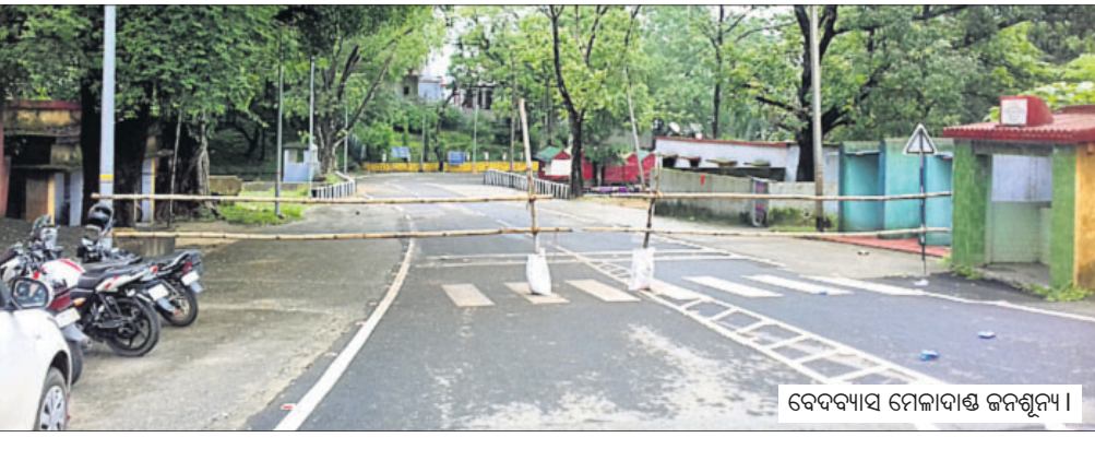
ବେଦବ୍ୟାସ ମେଳାଦାଣ୍ଡ ଜନଗୁମ୍ଫା ।

ବେଦବ୍ୟାସ, ୬/୭ (ଡି.ଏନ.ଏ) ପଶ୍ଚିମ ଓଡ଼ିଶାର ପ୍ରସିଦ୍ଧ ଶୈବ ତଥା ବ୍ୟାସପାଠ ବେଦବ୍ୟାସ ତ୍ରିବେଣୀ ସଙ୍ଗମରେ ବହୁ ବର୍ଷ ଧରି ଚାଲି ଆସୁଥିବା ଶ୍ରୀବତ୍ସା ମେଳା (ବୋଲବନ୍ଦ) ଚଳିତ ବର୍ଷ କରୋନା ମହାମାରିକୁ ଦୃଷ୍ଟିରେ ରଖି ଜିଲ୍ଲା ପ୍ରଶାସନ ସମ୍ପୂର୍ଣ୍ଣ ଭାବେ ବନ୍ଦ କରିଛନ୍ତି ।