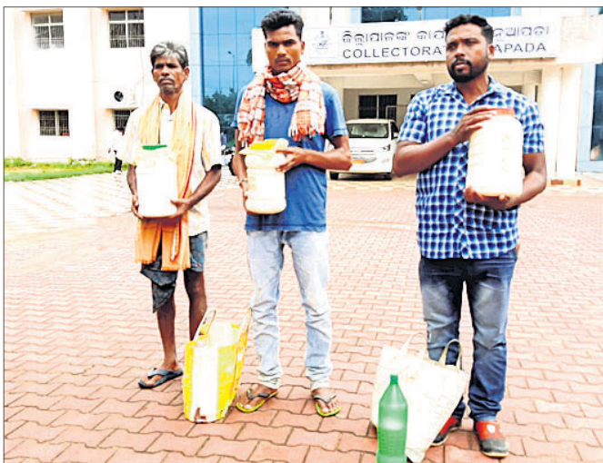
ଚାଷୀମାନେ ବୁସ୍ତ ଧରି ଜିଲ୍ଲାପାଳଙ୍କୁ ଭେଟିବାକୁ ଆସିଛନ୍ତି ।

ଚରବୋଡ଼ ସୋସାଇଟିରେ ମଧ୍ୟ ସଭାପତି ଓ ସମ୍ପାଦକ ଉଦ୍ଦେଶ୍ୟମୂଳକ ଭାବେ ଚାଷୀଙ୍କୁ ହଇରାଣ କରୁଥିବା ନେଇ କିଛି ଚାଷୀ ଅଭିଯୋଗ କରି ସୋମବାର ନୂଆପଡା ଆସି ଜିଲ୍ଲାପାଳଙ୍କୁ ଦାବିପତ୍ର ପ୍ରଦାନ କରିଛନ୍ତି ।