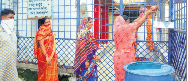
ଭକ୍ତମାନେ ଫାଟକ ବାହାରୁ ଦସ୍ତା ପାଇପରେ ମହାଦେବଙ୍କୁ ଜଳ ଅର୍ପଣ କରୁଛନ୍ତି।

କରୋନା କଟକଣା ଯୋଗୁ ସମ୍ବଲପୁର ସହର ଶିବାଳୟ ଗୁଡ଼ିକରେ ତାଲା ଝୁଲୁଛି। ତେଣୁ ଶ୍ରାବଣର ପ୍ରଥମ ପରାମର୍ଶ ମହାଦେବଙ୍କ ମନ୍ଦିର ଭକ୍ତ ଶୂନ୍ୟ ରହିଥିଲା। କାଁ ଭାଁ ଭକ୍ତମାନେ ମନ୍ଦିର ସମ୍ମୁଖରେ ମହାଦେବଙ୍କୁ ପ୍ରଣୀପାତ କରୁଥିବା ଦେଖିବାକୁ ମିଳିଥିଲା। ସ୍ଥାନୀୟ ଜାଗେଶ୍ଵର ମନ୍ଦିର ଟ୍ରଷ୍ଟ ବୋର୍ଡ ଜଳମାରି ପାଇଁ ଏକ ଅଭିନବ ବ୍ୟବସ୍ଥା କରାଯାଇଥିଲା। ଟ୍ରଷ୍ଟ ବୋର୍ଡ ପକ୍ଷରୁ ଦସ୍ତାରେ ଡିଆରି ହୋଇଥିବା ଏକ ପାଇପକୁ ମନ୍ଦିର ଫାଟକରୁ ଶିବଲିଙ୍ଗ ପର୍ଯ୍ୟନ୍ତ ସଂଯୋଗ