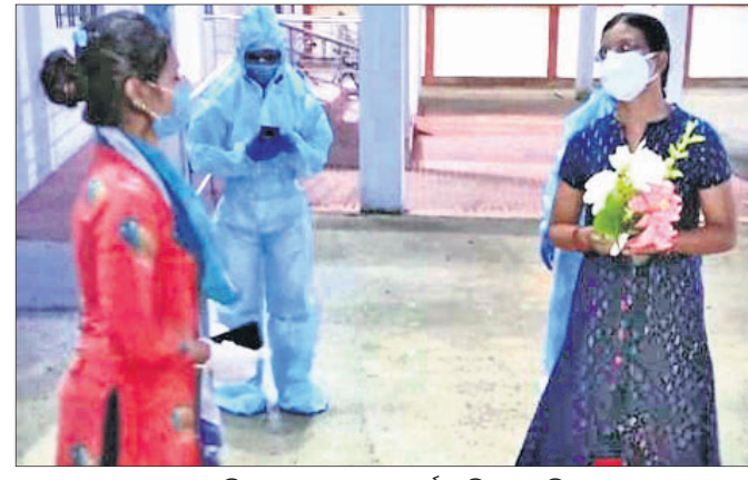
ସୁସ୍ଥ କରୋନା ଯୋଦ୍ଧାଙ୍କୁ ବିକାଶ ଗ୍ରୁପ ପକ୍ଷରୁ ସମର୍ଥନା ଦିଆଯାଇଛି ।

କୋଭିଡ୍ ହସ୍ପିଟାଲର କର୍ମଚାରୀମାନେ ତାଙ୍କୁ ଫୁଲଗୋଡ଼ା ଦେଇ ସମର୍ଥନା ଦେବା ସହିତ ଉତ୍ସାହିତ କରିଥିଲେ ।