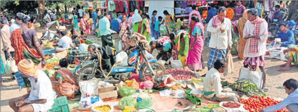
ଭବାନୀପାଟଣାରେ ଏକ ମାର୍ଜେଟରେ ଭିଡ଼।

କଳାହାଣ୍ଡି ଜିଲ୍ଲା ଭବାନୀପାଟଣା ସହରରେ ସଂକ୍ରମିତ ସଂଖ୍ୟା ଦିନକୁ ଦିନ ବଢି ଚାଲିଛି। ସୋନପୁର ସ୍ତରୀୟ ୨୭ କରୋନା ଆକ୍ରାନ୍ତ ଚିକିତ୍ସା ହୋଇଛନ୍ତି। ପୂର୍ବରୁ ରାଜ୍ୟ ବାହାରୁ ଆସୁଥିବା ପ୍ରବାସୀ ଓ ତାଙ୍କ ସଂସ୍ପର୍ଶରେ ଆସୁଥିବା ଲୋକମାନେ କରୋନା ଆକ୍ରାନ୍ତ ହେଉଥିଲେ। କିନ୍ତୁ ଜୁନ ୨୮ରେ ଭବାନୀପାଟଣା ସହରର ଅଧିକାଂଶାଂଶ ପଡ଼ାର ଜଣେ ୫୮ ବର୍ଷ ବୟସ୍କ ବ୍ୟକ୍ତି କରୋନାରେ ଆକ୍ରାନ୍ତ ହେବା ପରେ ଗତ ୨ ତାରିଖ ଦିନ ପୁଣି ସେହି ପଡ଼ାର ୫ ଜଣ ଆକ୍ରାନ୍ତ ହେବା ଘଟଣା ସହରବାସୀଙ୍କୁ ଚିନ୍ତାରେ ପକାଇଛି। ଏବେ ଭବାନୀପାଟଣା ସହର ସମେତ ଜିଲ୍ଲାର ବିଭିନ୍ନ ସହରାଞ୍ଚଳରେ ଆଉ ପୂର୍ବପରି କରୋନା କଟକଣା ନାହିଁ। ଜିଲ୍ଲା ପ୍ରଶାସନ କଟକଣା ସାମାନ୍ୟ କୋହଳ କରିବା ପରେ ସାମାଜିକ ଦୂରତା ନିୟମକୁ କେହି ମାନ୍ୟ ନାହାନ୍ତି। ଏପରି କି ମାଧ୍ୟ ପିନ୍ଧିବା, ସର୍ବସାଧାରଣ ସ୍ଥାନରେ ଛେପ ନ ପକାଇବା ଆଦି ନିୟମକୁ ଲୋକେ ଯେପରି ଭୁଲି ଯାଇଛନ୍ତି। ସେଥିପାଇଁ ହାତ ବଜାରରେ ଭିଡ଼ ଦେଖିବାକୁ ମିଳୁଛି। ବିଶେଷ କରି ପରିବାର ବଜାର, ମାଛ