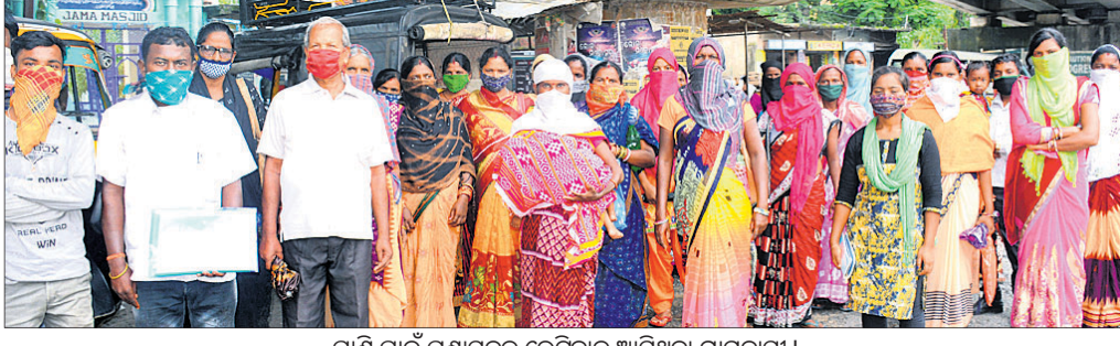
ପାଣି ପାଇଁ ପ୍ରଶାସନକୁ ଭେଟିବାକୁ ଆସିଥିବା ଗ୍ରାମବାସୀ ।

ସମ୍ବଲପୁର ଜିଲ୍ଲା କନଖଣ୍ଡା ପଞ୍ଚାୟତ ଅଞ୍ଚଳରେ ପାନୀୟ ଜଳ ସମସ୍ୟା ଲାଗି ରହିଛି । ଏହି ପଞ୍ଚାୟତ ଅଧୀନ ମାଝିପାଲି ରାଜସ୍ୱ ଗ୍ରାମର ସାଗରପଡା, ରାଧାମାଧବ ନଗର ଓ ଚମାରପଡାବାସୀ ଦୀର୍ଘ ବର୍ଷ ହେବ ପଇସା ପାଣି ପୂରଣ ପାଇ ପାରୁନାହାନ୍ତି ।