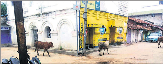
କଞ୍ଚେନମେଣ୍ଡ କୋଡ଼ କଟାପାଲି ।

ବରଗଡ଼ ଜିଲ୍ଲାରେ କରୋନା ସଂକ୍ରମଣ ଥିବା ନାଁ ନେଉନି । ଏଥିରେ ଲୋକେ କେବଳ ସଂକ୍ରମିତ ହେଉଛନ୍ତି ତାହା ନୁହେଁ, କରୋନା ଲୋକଙ୍କ ଜୀବନକାଳକୁ ମଧ୍ୟ ଛଡ଼ାଇ ନେଇଛି ।