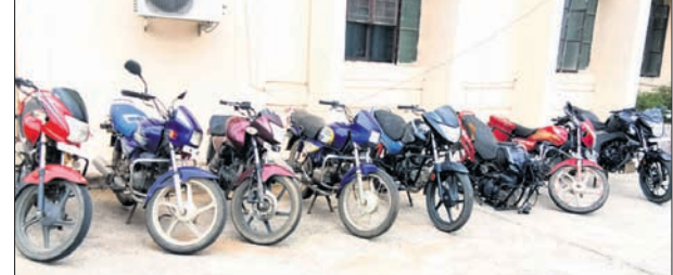
ଉଦ୍ଧାର ହୋଇଥିବା ଚୋରି ବାଇକ।

ବଲାଙ୍ଗୀର ଜିଲ୍ଲାରେ କରୋନା ସଂକ୍ରମିତଙ୍କ ସଂଖ୍ୟା ୨୨୨୭କୁ ବୃଦ୍ଧି ପାଇଛି। ୫୭ ଜଣ ସକ୍ରିୟ ଥିବାବେଳେ ୧୬୫୫ ଜଣ ସୁସ୍ଥ ହୋଇଛନ୍ତି। ରବିବାର ୬ ନୂଆ ସଂକ୍ରମିତ ଚିକିତ୍ସା ହୋଇଛନ୍ତି। ବଲାଙ୍ଗୀର ହାତୀଶାଳପଡ଼ା କର୍ମକ୍ଷେତ୍ରରେ କୋଭିଡ଼ ନୂଆ ୨ ଜଣ ଲୋକାଳ କର୍ମାଳୁ ଚିକିତ୍ସା ହୋଇଛନ୍ତି। ଫଳରେ ଏଠାକାର ମୋଟ ସଂକ୍ରମିତ ୩୯୯୩ ବୃଦ୍ଧି ପାଇଛି। ଲାଲିପୁରରେ ୩୩୫ ସଂକ୍ରମିତଙ୍କୁ ଚିକିତ୍ସା କରାଯାଇଛି। ଏହି ୩୩୫ ଚିକିତ୍ସା ପାଇଁ କଟକ ଆବାସୀ ହରିହର କ୍ୟାମ୍ପରେ ହସ୍ପିଟାଲକୁ ଯାଇଥିଲେ। ସେଠାରେ ସେମାନେ ସଂକ୍ରମିତ ହୋଇଥିବା ଅନୁମାନ କରାଯାଇଛି। ଅନ୍ୟଜଣେ ବଲାଙ୍ଗୀର ରେକର୍ଡ୍ରେ ଅଞ୍ଚଳରେ ଅଞ୍ଚଳରେ ବୋଲି ସୂଚନା ଦିଆଯାଇଛି। ସେହି ବ୍ୟକ୍ତି ଜଣକ ମଧ୍ୟପ୍ରଦେଶରୁ ଫେରି ହୋଇ କ୍ଵାରାଣ୍ଟାଇନ୍ରେ ଥିଲେ।