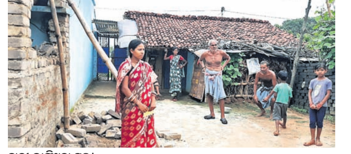
ହାତୀ ଭାଙ୍ଗିଥିବା ଘର ।

କିଛିଦିନ ବ୍ୟବଧାନରେ ପୁଣି ଆରମ୍ଭ ହୋଇଯାଇଛି ହାତୀପଲଙ୍କ ଉପଦ୍ରବ । ବନବିଭାଗ ନାକେଦମ ହେଉଥିବା ବେଳେ ଗ୍ରାମବାସୀ ରାତିଅନିଦ୍ରା ହୋଇ ହାତୀକୁ ଜରି ରଖୁଛନ୍ତି । ସଞ୍ଜ ନଇଁଲେ ବନବିଭାଗ ହାତୀ ଘରଭାଙ୍ଗିବା କାମରେ ଲାଗିଯାଉଛି ସତ ହେଲେ ଅମାନିଆ ହାତୀପଲ କ୍ଷୟକ୍ଷତି କରିବାରେ ଲାଗିଯାଉଛି । ହାତୀ ସମସ୍ୟା ବର୍ତ୍ତମାନ ବନବିଭାଗ ପାଇଁ ଏକପ୍ରକାର ଚ୍ୟାଲେଞ୍ଜ ହୋଇପଡ଼ିଛି । ଗତ କିଛିଦିନ ତଳେ ୨ ହାତୀ ମୃତ୍ୟୁ ଘଟଣା ଚଞ୍ଚୁଆ ରେଞ୍ଜର ଭାବପୂର୍ଣ୍ଣ ପ୍ରତି ଆକୃତି