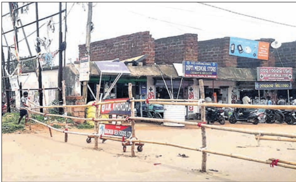
ଖୋର୍ଦ୍ଧା ନୂଆ ବସଷ୍ଟାଣ୍ଡ ରୋଡ୍ରେ ବ୍ୟାରିକେଡ୍ କରି ରାସ୍ତା ବନ୍ଦ କରାଯାଇଛି।

ଆଞ୍ଚଳିକ ଭେଷଜ ଗବେଷଣା କେନ୍ଦ୍ର (ଆର୍ବିଆରସ୍)ରେ କୋଭିଡ୍ ପରୀକ୍ଷାଗାର କାର୍ଯ୍ୟ କରୁଛି। ଏବେ ଆର୍ବିଆରସ୍ ରାଜ୍ୟରେ ୧ ଲକ୍ଷରୁ ଊର୍ଦ୍ଧ୍ୱ କୋଭିଡ୍-୧୯ ନମୁନା ପରୀକ୍ଷା କରି ଏକ ନୂତନ ମାଲକୋଷ୍ଟ ଗ୍ଲାସ୍ କୋଭିଡ୍ ପରୀକ୍ଷା ଶ୍ରେଣୀରେ ଦେଶର ତିନୋଟି ଶ୍ରେଷ୍ଠ ପରୀକ୍ଷାଗାର ମଧ୍ୟରେ ଆର୍ବିଆରସ୍ ଗ୍ଲାସ୍ ପାଇଥିବା ମୁଖ୍ୟମନ୍ତ୍ରୀ ରୁଦ୍ର ଯୋଗେ ସୂଚନା ଦେଇଛନ୍ତି।