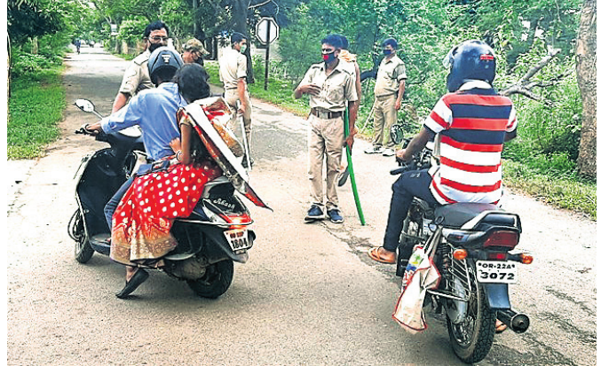
କୁଟକଇପଦା ଛକଠାରେ ପୋଲିସ ବାଇକ ଆରୋହୀଙ୍କୁ ଅଟକାଇଛି ।

ଶ୍ରାବଣ ମାସର ପ୍ରଥମ ସୋମବାର । ଭଦ୍ରକ ଜିଲାର ବାବା ଆଖଣ୍ଡଳଗଣିକ ମନ୍ଦିରରେ ଜଳଲାଗି ପାଇଁ କାର୍ଡିଆମାନେ ଆରତି ଆସିଥାନ୍ତି । ମାତ୍ର କରୋନା ମହାମାରୀ ପାଇଁ ପାଠରେ ୧୪୪ ଧାରା ଲାଗୁ କରାଯାଇଛି । କାର୍ଡିଆ ତଥା ଶ୍ରୀକଳ୍ପମାନେ ପାଠକୁ ଆସିବାର ସମ୍ଭାବନା ଥିବାରୁ ପୋଲିସ ପ୍ରଶାସନ ପକ୍ଷରୁ କଡ଼ା ପଦକ୍ଷେପ ନିଆଯାଇଛି ।