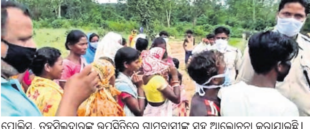
ପୋଲିସ, ତହସିଲଦାରଙ୍କ ଉପସ୍ଥିତିରେ ଗ୍ରାମବାସୀଙ୍କ ସହ ଆଲୋଚନା କରାଯାଇଛି ।