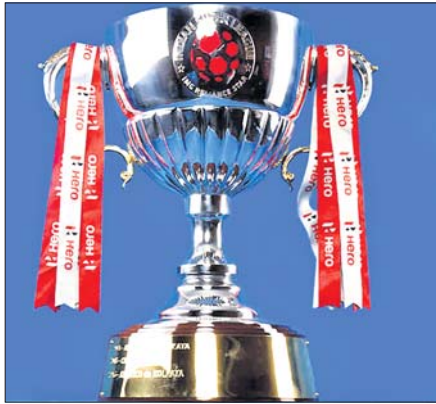
ପ୍ରକାଶ ପାଇଥିଲା। ଆଇଏସଏଲକୁ ବୁଲି ରାଜ୍ୟର ଏକାଧିକ ସ୍ଥାନରେ ଆୟୋଜନ କରିବା ଲାଗି ଯୋଜନା ରହିଛି। ରାଜ୍ୟ ଏବଂ ଭେଲ୍ସ୍ ବୃତ୍ତାନ୍ତ କରିବା ପୂର୍ବରୁ

ଇଣ୍ଡିଆନ୍ ସୁପର ଲିଗ୍ (ଆଇଏସଏଲ)ର ୭ମ ସଂସ୍କରଣ ଆସନ୍ତା ନଭେମ୍ବରରୁ ମାର୍ଚ୍ଚ ପର୍ଯ୍ୟନ୍ତ ରୁଜ୍ୱାରେ ଅନୁଷ୍ଠିତ ହେବ। କୋଭିଡ୍-୧୯ ମହାମାରୀ ଯୋଗୁ ଏହି ପୂର୍ବରୁ ଇଭେଣ୍ଟ ବୁକିଂ ରାଜ୍ୟ ମଧ୍ୟରେ ଖେଳାଯିବା ସମ୍ଭାବନା ରହିଛି। ପ୍ରତିଯୋଗିତା ଆୟୋଜନ ବୌଦ୍ଧରେ ଗୋଆ ଓ କେରଳ ଆଗରେ ରହିଛନ୍ତି। ସୋମବାର ଆଇଏସଏଲ ଆୟୋଜକ ପୂର୍ବରୁ ଘୋର୍ଣ୍ଣ ଡେଭଲପମେଣ୍ଟ ଲିମିଟେଡ୍ (ଏଫଏସଡିଏଲ) ଏବଂ କ୍ଲବ୍ ପ୍ରତିନିଧିମାନଙ୍କର ଏକ ବୈଠକ ବସିଥିଲା। ଏଥିରେ କେରଳ, ଗୋଆ, ପଶ୍ଚିମବଙ୍ଗ ଏବଂ ଉତ୍ତରପ୍ରଦେଶ ରାଜ୍ୟଗୁଡ଼ିକ ସମ୍ପର୍କରେ ଆଲୋଚନା ହୋଇଥିଲା। ତେବେ ବର୍ତ୍ତମାନ ପରିସ୍ଥିତିରେ ଗୋଆ ଓ କେରଳ ଦୁର୍ନିୟମେ ପାଇଁ ଉପଯୁକ୍ତ ସ୍ଥାନ ବୋଲି ଏଥିରେ ମତ