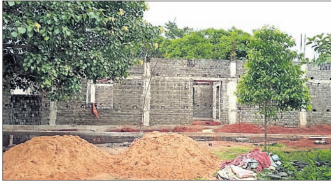
ନିର୍ମାଣାଧୀନ ଏକ କଲ୍ୟାଣମଣ୍ଡପ

୮୫ରୁ ସମ୍ପୂର୍ଣ୍ଣ ହୋଇଛି ମାତ୍ର ୨୦ ପ୍ରତି ପଥପ ପିଛା ୨୦ରୁ ୩୫ ଲକ୍ଷ ମଧ୍ୟରେ