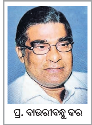
ପ୍ର. ବାଉରୀବନ୍ଧୁ କର