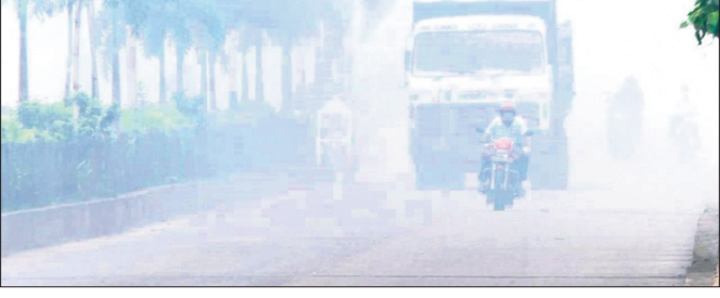
୩ ତାରିଖରେ ଧୂଆଁ ଭଳି ଆଲୁମିନିୟମ ହୋଇଥିବା ଦୃଶ୍ୟ

ପାରାଦୀପ, ୮୭(ସ୍ୱ.ପ୍ର.): ପାରାଦୀପ ବନ୍ଦର ସହରରେ ଚାରି ଦିନ ହେଲା ଗ୍ୟାସ୍ ନିର୍ଗତ ହେଉଥିବା ନେଇ ଚର୍ଚ୍ଚା କୋର ଧରିଛି। ଏପରି କି ରୁଧିରୀ ଅଠରବାଳି ଅଞ୍ଚଳର ଜଣେ ବ୍ୟକ୍ତି ଆମୋନିଆ ଗ୍ୟାସ୍ ପ୍ରଭାବରେ ଅସୁସ୍ଥ ହୋଇଛନ୍ତି ବୋଲି ଗଣମାଧ୍ୟମରେ ଅଭିଯୋଗ କରିଛନ୍ତି। ସେ ତାଙ୍କ ଅଭିଯୋଗରେ ଦର୍ଶାଇଛନ୍ତି ଯେ, ଗ୍ୟାସ୍ ଲିକ୍ ଯୋଗୁ ତାଙ୍କ ଆଖି, ନାକ ପୋଡ଼ିବା ସହ ଛାତିର ମନୁଣା ହେଉଛି। ଏହି ଗ୍ୟାସ୍ ପାରାଦୀପରେ