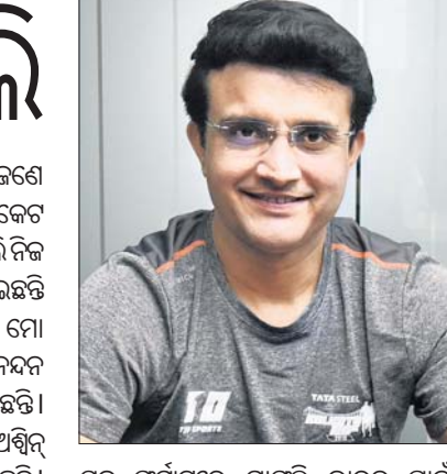
ସବୁ ଫର୍ମାଟ୍‌ରେ ଗାଙ୍ଗୁଲି ଭାରତ ପାଇଁ ୧୯୫୮ ମ୍ୟାଚ୍‌ରେ ନେତୃତ୍ୱ ନେଇଥିଲେ।

ନୂଆଦିଲ୍ଲୀ, ୮୭(ପି.ଟି.): ଭାରତୀୟ କ୍ରିକେଟକୁ ନୂଆ ରୂପ ଦେଇଥିବା ପୂର୍ବତନ ଅଧିନାୟକ ତଥା ଭାରତୀୟ କ୍ରିକେଟ କେଣ୍ଡ୍ରାଲ ବୋର୍ଡ (ବିସିଆଇ) ସଭାପତି ସୌରଭ ଗାଙ୍ଗୁଲି କୁସ୍‌ବାର ୪୮ ବର୍ଷରେ ପଦାର୍ପଣ କରିଛନ୍ତି। ଜନ୍ମଦିନରେ ଗାଙ୍ଗୁଲିଙ୍କୁ ଶୁଭେଚ୍ଛା ଦିଆ ଅଭିନନ୍ଦନ ଶୁଣି ଛୁଟିଛି। ବ୍ୟାଟିଂ ଲିକେଣ୍ଡ ସଦିନ ତେନ୍ଦୁଲକର ଏହି ଅବସରରେ ତାଙ୍କୁ ଶୁଭେଚ୍ଛା ଜଣାଇଛନ୍ତି। ପଡ଼ିଆ ଭିତରେ ଯେପରି ଆମର ବନ୍ଧୁ ରହିଥିଲା ପଡ଼ିଆ ବାହାରେ ମଧ୍ୟ ତାହା ଅଧିକ ରୁଚୁ ଓ ଆଗାମୀ ବର୍ଷ ମଙ୍ଗଳମୟ ହେଉ ବୋଲି ସଦିନ ରୁଜୁ କରୁ ଉଲ୍ଲେଖ କରିଛନ୍ତି। ସେହିପରି ପୂର୍ବତନ ବ୍ୟାଟ୍‌ମ୍ୟାନ ଭି.ଭି.ଏସ୍. ଲକ୍ଷ୍ମଣ ଶୁଭେଚ୍ଛା ଜଣାଇଛନ୍ତି। ଆଗକୁ ଆପଣ ଆହୁରି ସଫଳତା ଓ ଭଲପାଇବା ହାସଲ କରନ୍ତୁ ବୋଲି ସେ ରୁଜୁ କରୁଛନ୍ତି।