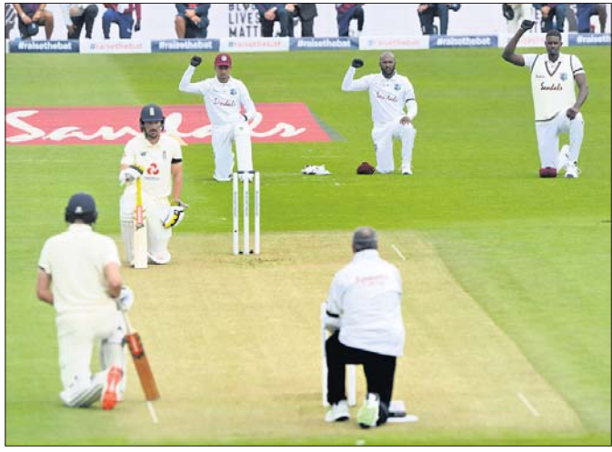
ଭାରତୀୟ ଖେଳାଳିମାନେ ଆନ୍ତର୍ଜାତୀୟ କ୍ରିକେଟରେ ଭାଗ ନେଉଛନ୍ତି।

କରୋନା ଭାଇରସ୍ ସଂକ୍ରମଣ ଜନିତ କାରଣରୁ ଦୀର୍ଘ ୪ ମାସର ବ୍ରେକ୍ ପରେ ଅନ୍ତର୍ଜାତୀୟ କ୍ରିକେଟ ଫେରିଛି। ରୁସ୍‌ଲ୍ୟାନ୍ଦା ଓ ଫ୍ରେଣ୍ଡ୍‌ସ୍ ଫୁଟ୍‌ବଲ୍ ଲିଗ୍ ଆରମ୍ଭ ହୋଇଛି ପ୍ରଥମ କ୍ରିକେଟ ଟେଷ୍ଟ। ମ୍ୟାଚ ଆରମ୍ଭ ପୂର୍ବରୁ ଲାଲ୍ ଲାଇଟ୍ ମ୍ୟାଚର ଆନ୍ଦୋଳନକୁ ସମର୍ଥନ ଜଣାଇ ଲାଲ୍ ଲାଇଟ୍ ଓ ଫ୍ରେଣ୍ଡ୍‌ସ୍ ଫୁଟ୍‌ବଲ୍ ଲିଗ୍ ଆରମ୍ଭ ହୋଇଛି। ଉଭୟ ଦଳର ଖେଳାଳି ଓ ସପୋର୍ଟର ଖେଳାଳିମାନେ ପିନ୍ଧିଥିବା ଟି-ଶାର୍ଟର କଲରରେ ମଧ୍ୟ ଲାଲ୍ ଲାଇଟ୍ ମ୍ୟାଚର ଲୋଗୋ ଲଗାଯାଇଛି। ଉଭୟ ଦଳର ଖେଳାଳି ଓ ସପୋର୍ଟର ଖେଳାଳିମାନେ ପିନ୍ଧିଥିବା ଟି-ଶାର୍ଟର କଲରରେ ମଧ୍ୟ ଲାଲ୍ ଲାଇଟ୍ ମ୍ୟାଚର ଲୋଗୋ ଲଗାଯାଇଛି। ଉଭୟ ଦଳର ଖେଳାଳି ଓ ସପୋର୍ଟର ଖେଳାଳିମାନେ ପିନ୍ଧିଥିବା ଟି-ଶାର୍ଟର କଲରରେ ମଧ୍ୟ ଲାଲ୍ ଲାଇଟ୍ ମ୍ୟାଚର ଲୋଗୋ ଲଗାଯାଇଛି।