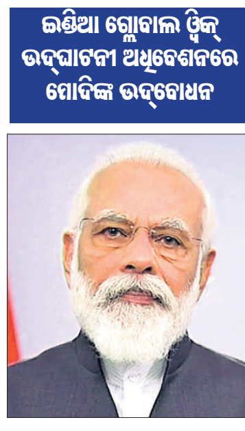
ପରିଲକ୍ଷିତ ହୋଇଛି। ଭାରତ ବିଶ୍ୱର ସବୁରୁ ପ୍ରମୁଖ ଅର୍ଥନୀତି ହୋଇ ରହିଛି। ଏଠାକୁ ଆସି ଶିଳ୍ପ ପ୍ରତିଷ୍ଠା ପାଇଁ ଆମେ ବିଶ୍ୱର ସବୁ କମ୍ପାନୀକୁ

ଲକ୍ଷ୍ମଣ, ୯୨(ପି.ଟି.) କୋଭିଡ୍-୧୯ ଯୋଗୁଁ ସାରା ବିଶ୍ୱର ଅର୍ଥନୀତି ଗୁରୁତର ଭାବେ ପ୍ରଭାବିତ ହୋଇଛି। ଏଥିରୁ ପୂର୍ବଦିନ ପାଇଁ ବିଭିନ୍ନ ଦେଶ ଉଦ୍ୟମ ଚଳାଇଥିବାବେଳେ ଭାରତରେ ସ୍ଥିତି ସୁଧୁରୁଥିବାର ସକାରାତ୍ମକ ଚିତ୍ର ଦେଖିବାକୁ ମିଳିଛି। ବିଶ୍ୱ ଅର୍ଥନୀତିକୁ ସୁଧାରିବାରେ ଭାରତ ପ୍ରମୁଖ ଭୂମିକା ଗ୍ରହଣ କରିବ ବୋଲି ବିଶ୍ୱାସ ରହିଥିବା ପ୍ରଧାନମନ୍ତ୍ରୀ ନରେନ୍ଦ୍ର ମୋଦି ଗୁରୁବାର କହିଛନ୍ତି। ତ୍ରିଟେନ ଦ୍ୱାରା ଆୟୋଜିତ ଇଣ୍ଡିଆ ଗ୍ଲୋବାଲ ଫିକ୍ସର ଉଦ୍‌ଘାଟନା ଅଧିବେଶନକୁ ଭିତ୍ତି କର୍ତ୍ତବ୍ୟରେ କ୍ରିଆରେ ଉଦ୍‌ଘୋଷଣା ଦେଇ ପ୍ରଧାନମନ୍ତ୍ରୀ ଏହା କହିଥିଲେ। ଅଧିକ ବୋଲି ଯାହା ବିଶ୍ୱାସ କରାଯାଉଥାଏ ତାକୁ ହାସଲ କରିବାର ମନୋବଳ ଭାରତୀୟଙ୍କର ରହିଛି। ଏହାର ପୁଷ୍ଟି କାରଣ ହେଉଛି ଭାରତୀୟଙ୍କଠାରେ ପ୍ରତିଭା ରହିଥିବାବେଳେ ସଂସ୍କାର ଏବଂ ନୂତନତା ଆଣିବାର ସାମର୍ଥ୍ୟ ଭାରତର ରହିଛି। ଦେଶର ଅର୍ଥନୀତିରେ ସୁଧାର ଆସୁଥିବା ସ୍ପଷ୍ଟ