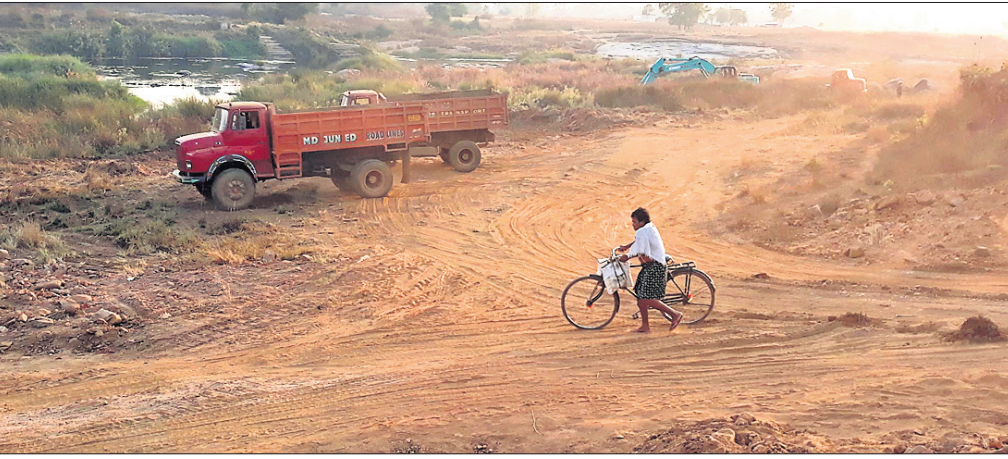
ସମ୍ବଲପୁର ମହାନଗର ନିଗମ ଅଧୀନ ମାନେଶ୍ୱର ଥିବା ଶୁଶାନ ଚାଡ଼ି ଦିଆଯାଇଛି ।

ସମ୍ବଲପୁର-ଅନୁଗୋଳ ୫୫ ନମ୍ବର ଜାତୀୟ ରାଜପଥ ଚାଡ଼ିଥାନ୍ତିଆ ରାସ୍ତାନିର୍ମାଣ କରାଯାଇଛି । ଏଥିପାଇଁ ଜମି ଅଧିଗ୍ରହଣ ସମୟରେ ମାନେଶ୍ୱର ମାଳତୀ ନଦୀ ତଟରେ ଥିବା ଶୁଶାନ ଉଚ୍ଛେଦ ହୋଇଛି । ଇତିମଧ୍ୟରେ ୩ବର୍ଷ ବିତିଛି । ହେଲେ ନୂତନ ଶୁଶାନ ନିର୍ମାଣ କରାଯାଇନାହିଁ । ଫଳରେ ମାନେଶ୍ୱର, ହାଲିପାଲି, କେଶେଇପାଲି ଗ୍ରାମବାସୀ ମୃତଦେହ ସହାର ପାଇଁ ସମସ୍ୟା ଭୋଗୁଛନ୍ତି । ଗୁରୁବାର ମାନେଶ୍ୱର ଗ୍ରାମର ଜଣେ ବ୍ୟକ୍ତିଙ୍କ ମୃତ୍ୟୁ ଘଟିଥିଲା । ତାଙ୍କ ମୃତଦେହ ସହାର ପାଇଁ ଏଭଳି ଅସୁବିଧା ହୋଇଥିଲା । ଏହାକୁ ନେଇ ଅଞ୍ଚଳବାସୀଙ୍କ ଅସନ୍ତୋଷ ବଢ଼ିବାରେ ଲାଗିଛି । ଶାନ୍ତ ଶୁଶାନ ନିର୍ମାଣ କରିବା ପାଇଁ ଗ୍ରାମବାସୀ ଦାବି କରିଛନ୍ତି । ଅଭିଯୋଗ ଅନୁସାରେ,