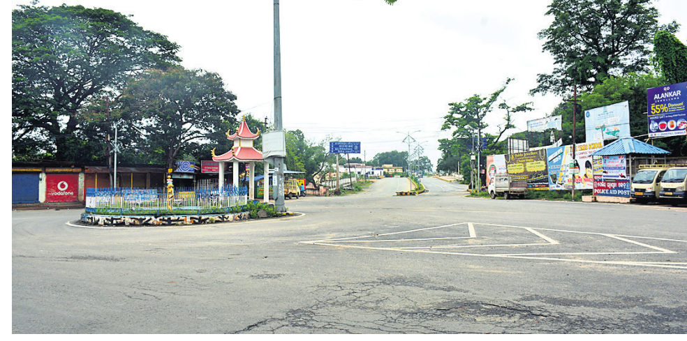
ଶନିବାର ସମ୍ବଲପୁରରେ ଶରତାଭନ୍ଦ ପାଇଁ ଜେଲ ଛକ ସମ୍ପୂର୍ଣ୍ଣ ଜନଶୂନ୍ୟ ।