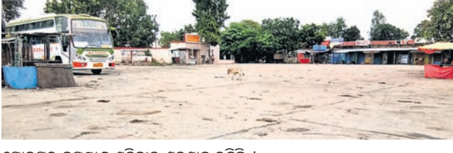
ସୋନପୁର ବସଷ୍ଟାଣ୍ଡ ଶନିବାର ଶୁନ୍ୟାନ ରହିଛି ।

ଶରତାଭନ୍ଦର ପ୍ରଭାବ ଅନୁଭୂତ ହୋଇଛି । ଜନସାଧାରଣ ଏଥିରେ ସହଯୋଗ ଦେବାକୁ ସମର୍ଥନ ଦେଇଛନ୍ତି । ତେବେ ଅଫିସ୍, ନିର୍ମାଣ କାର୍ଯ୍ୟ, ଯାନବାହାନ ଚଳାଚଳ ସମ୍ପୂର୍ଣ୍ଣ ବନ୍ଦ ରହିଛି । ପୋଲିସ୍ ପକ୍ଷରୁ ଜିଲ୍ଲାର ସାମାଜିକ ଦୂରତା ବ୍ୟବସ୍ଥା କଡ଼ାକଡ଼ି କରାଯାଇଥିଲା । କେବଳ ଜରୁରୀ କାର୍ଯ୍ୟରେ ଯାଉଥିବା ଲୋକଙ୍କୁ ଛଡ଼ା ଯାଇଥିଲା । ଜିଲ୍ଲାର ୬ଟି ବ୍ଲକ୍, ଗୋଟିଏ ମୁନିସିପାଲିଟି ଓ ୨ଟି ଏନ-ଏସି ଅଞ୍ଚଳରେ