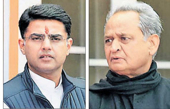
ସଚିବ ପାଇଲଟ୍ ଅଶୋକ ରେହଲଟ୍

ନୂଆଦିଲ୍ଲୀ, ୧୨୭ କର୍ମଚାରୀ ଓ ମଧ୍ୟସ୍ତରରେ କଂଗ୍ରେସ ସରକାରକୁ ଭାଙ୍ଗିବାରେ ସଫଳ ହେବା ପରେ ରାଜସ୍ଥାନରେ ମୁଖ୍ୟ ପୂରାଇଛି ଭାଙ୍ଗିପା। ଏଥିଯୋଗୁ ରାଜସ୍ଥାନ କଂଗ୍ରେସରେ ବଡ଼ ସଙ୍କଟ ସୃଷ୍ଟି ହେବା ସହ ଅଶୋକ ରେହଲଟ୍ ସରକାର ଟଙ୍କାମଳ ଅବସ୍ଥାକୁ ଚାଲି ଆସିଛି। ଶାସକ କଂଗ୍ରେସର ବରିଷ୍ଠ ଓ ଯୁବ ନେତୃତ୍ୱ ମଧ୍ୟରେ ଦୀର୍ଘଦିନ ଧରି ରହିଆସିଥିବା ବନ୍ଧୁ ପୁଣିଥରେ ଉଗ୍ରରୂପ ଧାରଣ କରିଛି। ରାଜସ୍ଥାନ ମୁଖ୍ୟମନ୍ତ୍ରୀ ଦୌଡ଼ରେ ହାରିଯାଇ ଅସହଜ ଥିବା ଉପମୁଖ୍ୟମନ୍ତ୍ରୀ ସଚିବ ପାଇଲଟ୍ ଭାଙ୍ଗିପା ସହ ଭିତ୍ତି ମନୁଷୀ ଚଳାଇଥିବା ଘନିଷ୍ଠ ସ୍ତରରୁ ପୁରୀର ମିଳିଛି। ତାଙ୍କ ପଛରେ କଂଗ୍ରେସ ଓସାଧାନ ଭାବେ ଚିତ୍ତୁରୀ ୩୦ ବିଧାନସଭା ସମର୍ଥନ ରହିଥିବା ପାଇଲଟ୍ ଦାବି କରିଛନ୍ତି। ଲକ୍ଷତାଉନ ପୂର୍ବରୁ ବିରୋଧୀ ଦଳ ସହ ପାଇଲଟ୍ ଗୋଷ୍ଠୀର ଆଲୋଚନା ଚାଲିଥିଲେ ହେଁ ସରକାରରେ ଅସ୍ଥିରତା ସୃଷ୍ଟି ଅଭିଯୋଗରେ ଜେରା ପାଇଁ ସ୍ୱତନ୍ତ୍ର ଅପରେଶନ ଗ୍ରୁପ୍ (ଏସ୍.ଏସ୍.ଏସ୍) ଗଠନ ପାଇବା ପରେ ସ୍ଥିତି ଗୁରୁତର ହୋଇଛି। ମୁଖ୍ୟମନ୍ତ୍ରୀ ଅଶୋକ ରେହଲଟ୍ଙ୍କ ହାତରେ ଥିବା ଗୃହ ବିଭାଗ ଅଧୀନରେ ରହିଛି ଏସ୍.ଏସ୍.ଏସ୍। ସମନ ପାଇବା ପରେ ଟେଷ୍ଟ-୪