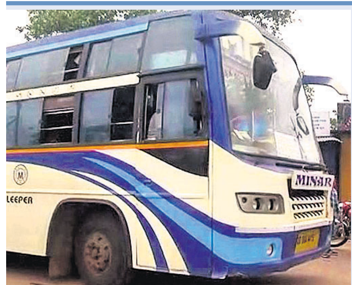
ସେହିପରି ରାଜ୍ୟରେ ୧୪,୦୦୦ ଘରୋଇ ବସ ମଧ୍ୟରୁ ୭୦୦୦ ବସ ଚଳାଚଳ କରୁଥିଲା।

ମହାମାରୀ କରୋନା କେବଳ ସାମ୍ବଲପୁର, ବିଭିନ୍ନ କ୍ଷେତ୍ରରେ ଜାରିକା ଉପରେ ପ୍ରଭାବ ପ୍ରଦାନ ଦେଇଛି। ରାଜ୍ୟ ଅର୍ଥନୀତିରେ ଯାତ୍ରା ପରିବହନ ସେବା ଏକ ବଡ଼ ଅଂଶ। କରୋନା ସଂକ୍ରମଣ ଆଶଙ୍କା ଦେଖାଦେବା ଦିନ ଠାରୁ ଏହି କ୍ଷେତ୍ର ଏକ ପ୍ରକାର ଛୁଟିଦିନ ପ୍ରଭାବୀ ହୋଇ ଆସିଛି। ଯାତ୍ରା ପରିବହନରେ ନିୟୋଜିତ ଥିବା ଘରୋଇ ବସ, ଅଟୋ ରିକ୍ଷା ଏବଂ ଟ୍ୟାକ୍ସିଗୁଡ଼ିକ ଉପରେ ନିର୍ଭର କରି ଚଳୁଥିବା ଲୋକମାନଙ୍କର ଜୀବିକା ବିପଦ ହୋଇପଡ଼ିଛି। ଏଭଳି ସ୍ଥିତିରୁ ମୁକ୍ତିଲାଭ କରି ରୋଡ୍ ଟ୍ୟାକ୍ସ ଛାଡ଼ି କରିବା ସକାଶେ ବସ ମାଲିକ ସଂଘ ପକ୍ଷରୁ ଦାବି କରାଯାଇଛି। ସରକାର ଏଥିପ୍ରତି ଦୃଷ୍ଟି ନ ଦେଲେ ସଡ଼କ ପରିବହନ ବ୍ୟବସ୍ଥା ଅଧିକ ବିପର୍ଯ୍ୟସ୍ତ ହେବାର ଆଶଙ୍କା ଉଠୁଛି।