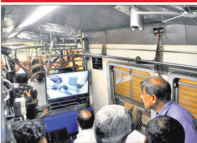
ଭାରତ କେନ୍ଦ୍ରୀୟ ରେଳଦେଇ ପ୍ରଥମ ଥର ପାଇଁ ନିରାପତ୍ତ ଓ ଆରାମଦାୟକ ଯାତ୍ରା ପାଇଁ ୨୦ ଲକ୍ଷ ଲକ୍ଷମାନଙ୍କୁ

ଲୋକମାନଙ୍କୁ ସୁରକ୍ଷା ଦେବା ପାଇଁ ଏକ ଉପକ୍ରମ । ଏହା ଲୋକମାନଙ୍କୁ ସୁରକ୍ଷା ଦେବା ପାଇଁ ଏକ ଉପକ୍ରମ । ଏହା ଲୋକମାନଙ୍କୁ ସୁରକ୍ଷା ଦେବା ପାଇଁ ଏକ ଉପକ୍ରମ ।