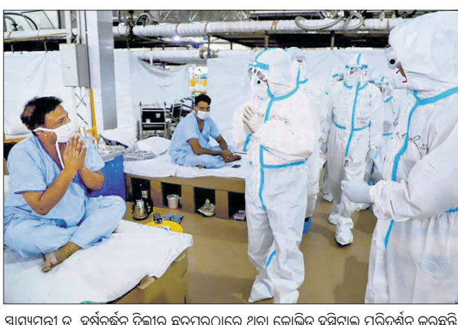
ସାମ୍ବାମନୀ ଡ. ହର୍ଷବର୍ଦ୍ଧନ ଦିଲ୍ଲୀର ଛତ୍ରପୁରୀଠାରେ ଥିବା କୋଭିଡ୍ ହସ୍ପିଟାଲ ପରିବର୍ଦ୍ଧନ କରୁଛନ୍ତି ।

ସୁସ୍ଥ ହାର ୨୨.୯୩%କୁ ବୃଦ୍ଧି ହେଉଛି । ଏହା ଲୋକମାନଙ୍କୁ ସୁରକ୍ଷା ଦେବା ପାଇଁ ଏକ ଉପକ୍ରମ । ଏହା ଲୋକମାନଙ୍କୁ ସୁରକ୍ଷା ଦେବା ପାଇଁ ଏକ ଉପକ୍ରମ ।