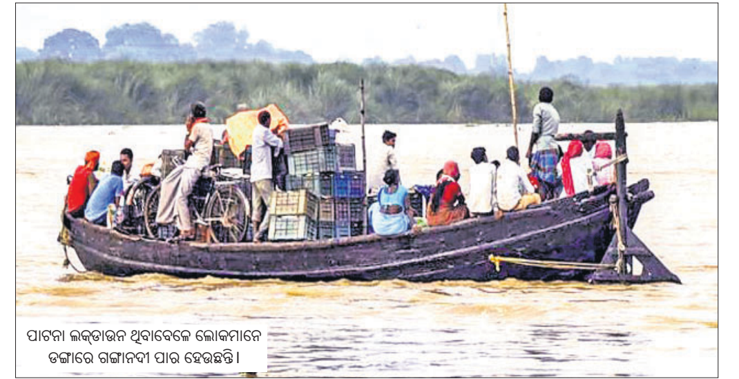
ପାଟଣା ଲକ୍ଷ୍ମୀନାଥ ଥିବାବେଳେ ଲୋକମାନଙ୍କୁ ତତ୍କାରେ ଗଠାନ୍ତାପା ପାର ହେଉଛି ।

ରାଜଭବନର ୧୮ କର୍ମଚାରୀଙ୍କୁ କରୋନା ହେଉଛି । ଏହା ଲୋକମାନଙ୍କୁ ସୁରକ୍ଷା ଦେବା ପାଇଁ ଏକ ଉପକ୍ରମ । ଏହା ଲୋକମାନଙ୍କୁ ସୁରକ୍ଷା ଦେବା ପାଇଁ ଏକ ଉପକ୍ରମ ।