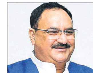
ନିଜାଙ୍କ ନୂଆ ଟିମ୍ ଖୁବ୍ ଶୀଘ୍ର ଗଠିତ ହେବ । ଏହା ଲୋକମାନଙ୍କୁ ସୁରକ୍ଷା ଦେବା ପାଇଁ ଏକ ଉପକ୍ରମ ।

ନିଜାଙ୍କ ନୂଆ ଟିମ୍ ଖୁବ୍ ଶୀଘ୍ର ଗଠିତ ହେବ । ଏହା ଲୋକମାନଙ୍କୁ ସୁରକ୍ଷା ଦେବା ପାଇଁ ଏକ ଉପକ୍ରମ । ଏହା ଲୋକମାନଙ୍କୁ ସୁରକ୍ଷା ଦେବା ପାଇଁ ଏକ ଉପକ୍ରମ ।