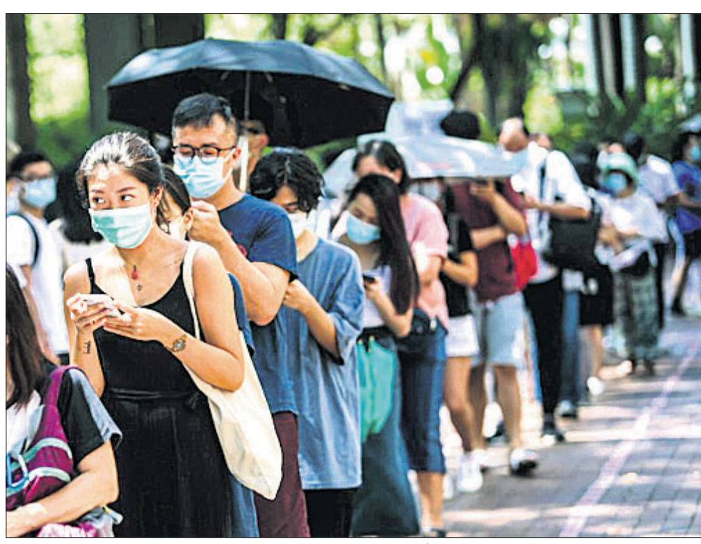
ଚାଇନା ସୁରକ୍ଷା ଆଇନ ବିରୋଧରେ ଭୋଟ୍ ଦେବା ପାଇଁ ଭୋଟରମାନଙ୍କ ଲମ୍ବା ଯାତ୍ରା

ସମ୍ପର୍କରେ କହିଛନ୍ତି । ଗଣତନ୍ତ୍ର ଓ ସ୍ୱାଧୀନତାକୁ ଆମର ସମର୍ଥନ ଅବ୍ୟାହତ ରହିବ ବୋଲି ସେ ଦୃଢ଼ଭାବେ କହିଛନ୍ତି । ଅନ୍ୟପକ୍ଷରେ ହିନ୍ଦୁଙ୍କୁ ବିରୋଧ କରାଯାଇଛି । ଏହା ଲୋକମାନଙ୍କୁ ସୁରକ୍ଷା ଦେବା ପାଇଁ ଏକ ଉପକ୍ରମ ।