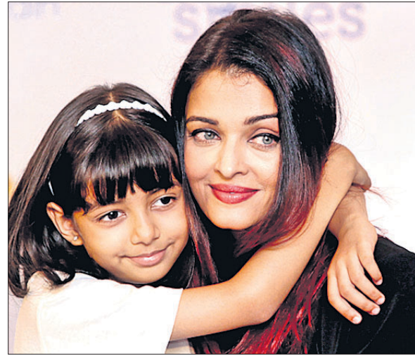
ଅଭିନେତ୍ରୀ ଶୈଶ୍ଵର୍ଯ୍ୟା ରାୟ ବଚନଙ୍କ ସହ ଝିଅ ଆରାଧ୍ୟା ।