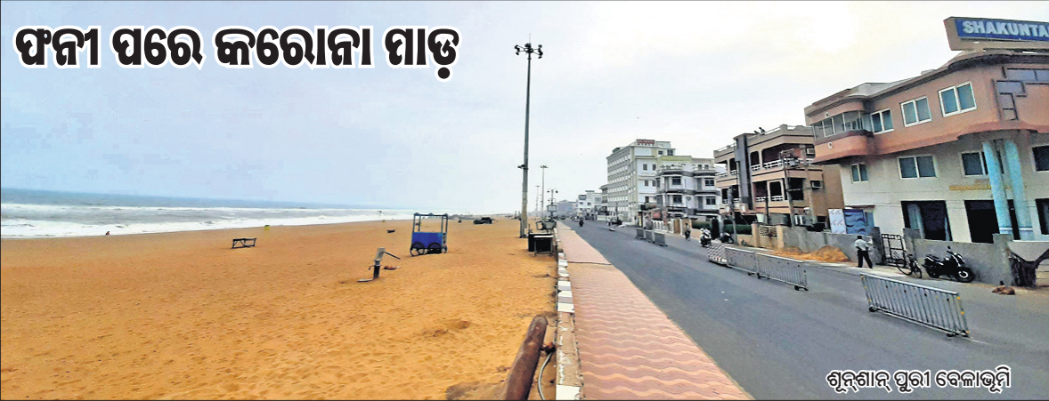
ପୁରୀ ଅଫିସ, ୧୨।୭

ପୁରୀ ଜିଲାର ପର୍ଯ୍ୟଟନ ସ୍ଥଳ ହେଉ କି ବେଳାଭୂମି ସବୁଠି ଏବେ ଛାଇଯାଇଛି ନିର୍ଜନତା। କୌଣସି ଦର୍ଶନୀୟ ସ୍ଥାନରେ ପର୍ଯ୍ୟଟକଙ୍କୁ ଦେଖିବାକୁ ମିଳୁନାହିଁ କି ଶୁଣାଯାଉନି କୋଳାହଳ। ପୁରୀ ହୋଟେଲଗୁଡ଼ିକରେ ସତେଯେମିତି ଜାରି ହୋଇଛି ଅଯୋଗିତ କର୍ମ୍ମ। ପ୍ରଥମେ ପୁରୀ ପର୍ଯ୍ୟଟନ ଶିଳ୍ପର ଅଧିକ ଭାଙ୍ଗି ଦେଇଥିଲା ବାତ୍ୟା ଫନୀ। ଏଥିରୁ ପୁଲୁକିବାକୁ ଚେଷ୍ଟା ଚାଲିଥିବା ବେଳେ ହଠାତ୍ ମହାମାରୀ କରୋନା ଦେଇଛି ଶକ୍ତ ପ୍ରହାର। ଫଳରେ ମୁହଁ ମାଡ଼ିପଡ଼ିଛି ପୁରୀ ପର୍ଯ୍ୟଟନ ଶିଳ୍ପ। ସ୍ଥିତିରେ କେବେ ସୁଧାର ଆସିବ ତାହାର କୌଣସି ଠିକ୍ ଠିକଣା ନ ଥିବାବେଳେ ପର୍ଯ୍ୟଟନ ଶିଳ୍ପ ଉପରେ ନିର୍ଭର କରୁଥିବା ବ୍ୟକ୍ତିମାନେ ଦେବାଳିଆ ହୋଇପଡ଼ିଲେଣି। ପୁରୀ ଜିଲାରେ ଶ୍ରୀମନ୍ଦିର, କୋଣାର୍କ ସୂର୍ଯ୍ୟ ମନ୍ଦିର, କାକଟପୁର ମା' ମଙ୍ଗଳା ମନ୍ଦିର,