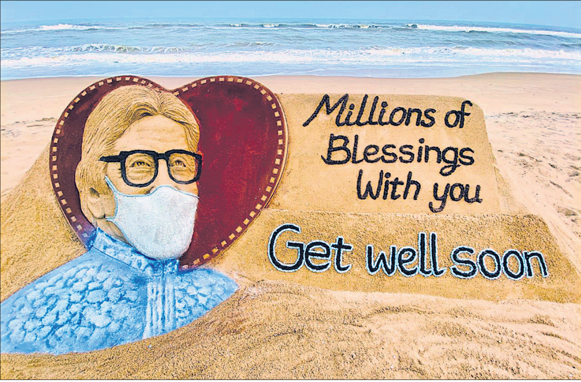
ମେଗାଷ୍ଟର ଅମିତାଭ ବଚ୍ଚନ କରୋନା ସଂକ୍ରମିତ ହେବା ପରେ ତାଙ୍କ ଆଶୁ ଆରୋଗ୍ୟ କାମନା କରି ରବିବାର ପୁରୀ ବେଳାଭୂମିରେ ସୁଦର୍ଶନ ପଟ୍ଟନାୟକଙ୍କ ବାଲୁକା କଳା ।