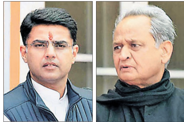
ସଚିନ ପାଲଟ ଅଶୋକ ରେହଲଟ

ନୂଆଦିଲ୍ଲୀ, ୧୨୭ ମଧ୍ୟପ୍ରଦେଶରେ କଂଗ୍ରେସ ସରକାର ଭାଙ୍ଗିବାର ୩ ମାସ ପରେ ରାଜସ୍ଥାନ କଂଗ୍ରେସରେ ବଡ଼ ସଙ୍କଟ ଦେଖାଦେଇଛି। ଦଳର ବରିଷ୍ଠ ଓ ଯୁବ ନେତୃତ୍ଵ ମଧ୍ୟରେ ଦୀର୍ଘଦିନରୁ ରହିଆସିଥିବା ବନ୍ଧୁ ପୁଣିଥରେ ଉଗ୍ରରୂପ ଧାରଣ କରିଛି। ରାଜସ୍ଥାନ ମୁଖ୍ୟମନ୍ତ୍ରୀ ଦୌଡ଼ରେ ହାରିଯାଇ ଅସହଜ ଥିବା ଉପମୁଖ୍ୟମନ୍ତ୍ରୀ ସଚିନ ପାଲଟ ଭାଙ୍ଗିବା ସହ ଆଲୋଚନା ଚଳାଇଥିବା ଘନିଷ୍ଠ ସୂତ୍ରରୁ ସୂଚନା ମିଳିଛି। ତାଙ୍କ ପଛରେ ଦଳର ୧୬ ବିଧାୟକ ଏବଂ ୩ ସାଧାନ ସଦସ୍ୟଙ୍କ ସମର୍ଥନ ରହିଥିବା ପାଲଟ ଦାବି କରିଛନ୍ତି। ଲକଡାଉନ ପୂର୍ବରୁ ବିରୋଧୀ ଦଳ ସହ ପାଲଟଙ୍କ ଗୋଷ୍ଠୀର ଆଲୋଚନା ଚାଲିଥିଲେ ହେଁ ସରକାରରେ ଅସ୍ଥିରତା ସୃଷ୍ଟି ଅଭିଯୋଗରେ କେରା ପାଇଁ ସ୍ଵତନ୍ତ୍ର ଅପରେଶନ ଗ୍ରୁପ୍ (ଏସ୍‌ଓଜି)ଠାରୁ ସମନ ପାଇବା ପରେ ସ୍ଥିତି ସୁରୁତର ହୋଇଛି। ଏସ୍‌ଓଜି ଗୃହ ମନ୍ତ୍ରଣାଳୟ ଅଧୀନରେ ରହିଥିବାବେଳେ ମୁଖ୍ୟମନ୍ତ୍ରୀ ଅଶୋକ ରେହଲଟ ଏହାର ମୁଖ୍ୟ ଅଛନ୍ତି। ସମନ ପାଇବା ପରେ ପାଲଟଙ୍କ ଉଦ୍ଦେଶ୍ୟ ଚାଲିବ କେତେକ ଅନୁରତ ବିଧାୟକଙ୍କୁ ସାଙ୍ଗରେ ନେଇ ଦିଲ୍ଲୀ ଆସିଛନ୍ତି। ତେବେ ଭାଙ୍ଗିବା ତାଙ୍କୁ ମୁଖ୍ୟମନ୍ତ୍ରୀ ପଦ ଦେବା ପାଇଁ ପ୍ରସ୍ତୁତ ନ ଥିବାରୁ ପାଲଟଙ୍କ ନୂଆ ଆଞ୍ଚଳିକ ଦଳ ଗଠନ କରିପାରନ୍ତି ବୋଲି କେତେକଙ୍କ ନେତା ସୂଚନା ଦେଇଛନ୍ତି। ଅନ୍ୟପକ୍ଷରେ ପାଲଟଙ୍କ ସହ କୌଣସି କଥାବାର୍ତ୍ତା ହୋଇ ନ ଥିବା ଭାଙ୍ଗିବା କହିଛି। ସରକାରରେ ସଙ୍କଟ ଦେଖାଦେବା ପରେ ମୁଖ୍ୟମନ୍ତ୍ରୀ ଟେଷ୍ଟିଂ-୪