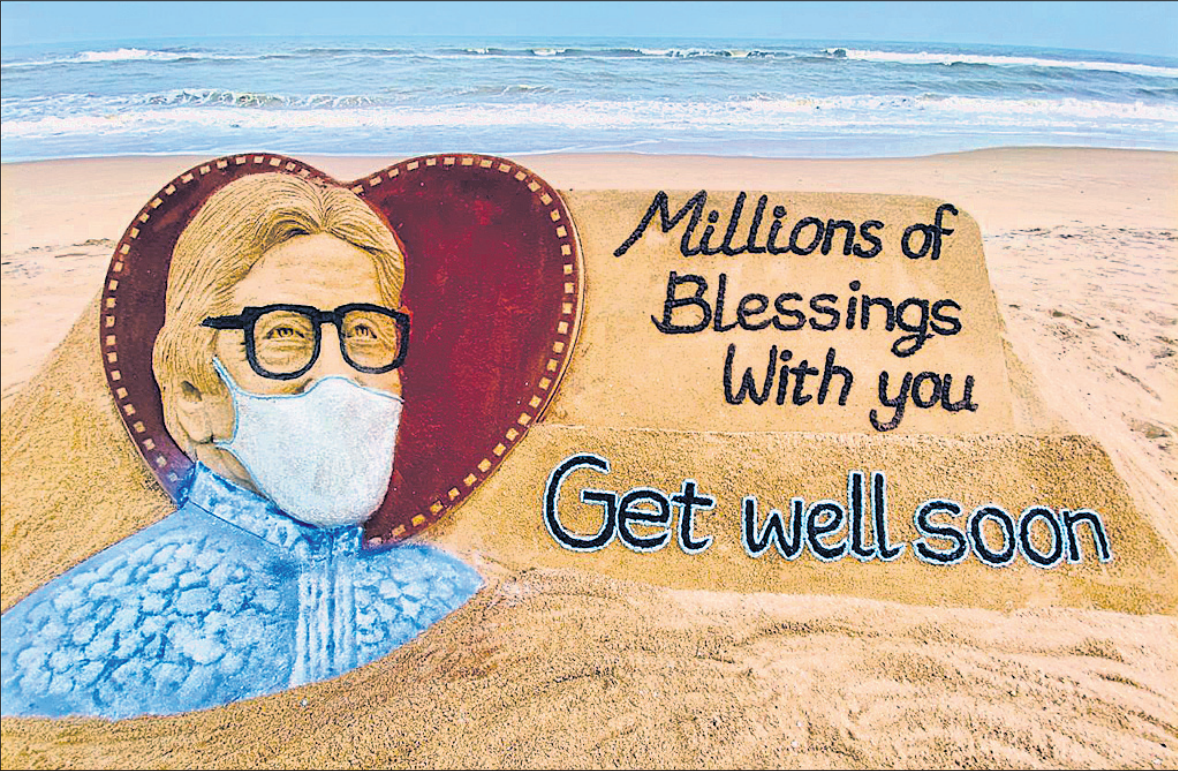
ମେଗାଷ୍ଟର ଅମିତାଭ ବଚ୍ଚନ କରୋନା ସଂକ୍ରମିତ ହେବା ପରେ ତାଙ୍କ ଆଶୁ ଆରୋଗ୍ୟ କାମନା କରି ରବିବାର ପୁରୀ ବେଳାଭୂମିରେ ସୁଦର୍ଶନ ପଟ୍ଟନାୟକଙ୍କ ବାଲୁକା କଳା ।