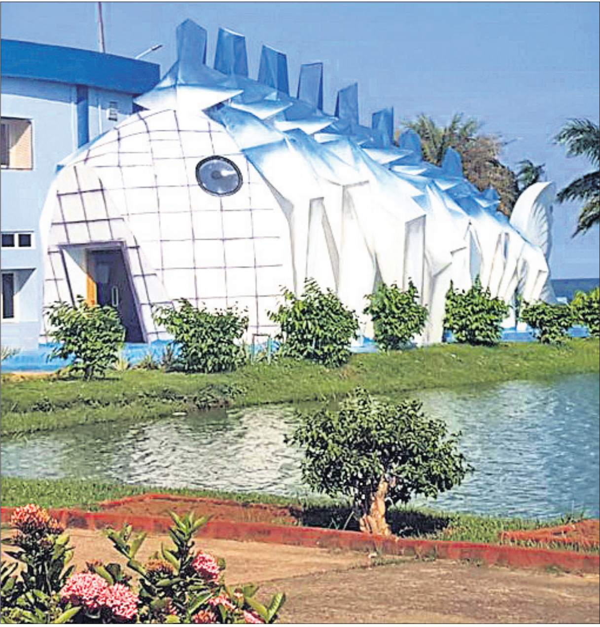
ଚିଲିକାର ବଡ଼କୁଳ ନିକଟରେ ତିଆରି ହୋଇଥିବା ମାଛ ସଂଗ୍ରହାଳୟ । କରୋନା ସ୍ଥିତି ସୁଧରିଲେ ପର୍ଯ୍ୟଟକଙ୍କ ପାଇଁ ଖୋଲାଯିବ ।