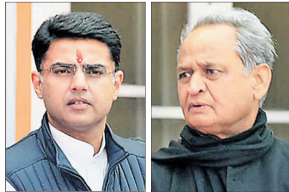
ଉପମୁଖ୍ୟମନ୍ତ୍ରୀ ସତ୍ୟ ପାଲଟଟ ମୁଖ୍ୟମନ୍ତ୍ରୀ ଅଶୋକ ରେହଲଟ

ନୂଆଦିଲ୍ଲୀ, ୧୨୭ ମଧ୍ୟପ୍ରଦେଶରେ କଂଗ୍ରେସ ସରକାର ଭାଙ୍ଗିବାର ୩ ମାସ ପରେ ରାଜସ୍ଥାନ କଂଗ୍ରେସରେ ବଡ଼ ସଙ୍କଟ ଦେଖାଦେଇଛି। ଦଳର ବରିଷ୍ଠ ଓ ଯୁବ ନେତୃତ୍ଵ ମଧ୍ୟରେ ଦୀର୍ଘଦିନରୁ ରହିଆସିଥିବା ବନ୍ଧୁ ପୁଣିଥରେ ଉଗ୍ରରୂପ ଧାରଣ କରିଛି। ରାଜସ୍ଥାନ ମୁଖ୍ୟମନ୍ତ୍ରୀ ଦୌଡ଼ରେ ହାରିଯାଇ ଅସବୁଷ୍ଟ ଥିବା ଉପମୁଖ୍ୟମନ୍ତ୍ରୀ ସତ୍ୟ ପାଲଟଟ ଭାଙ୍ଗିବା ସହ ଆଲୋଚନା ଚଳାଇଥିବା ଘନିଷ୍ଠ ସୂତ୍ରରୁ ସୂଚନା ମିଳିଛି। ତାଙ୍କ ପଛରେ ଦଳର ୧୬ ବିଧାୟକ ଏବଂ ୩ ସାଧାନ ସଦସ୍ୟଙ୍କ ସମର୍ଥନ ରହିଥିବା ପାଲଟଟ ଦାବି କରିଛନ୍ତି। ଲକ୍ଷତାଉନ ପୂର୍ବରୁ ବିରୋଧୀ ଦଳ ସହ ପାଲଟଟଙ୍କ ଗୋଷ୍ଠୀର ଆଲୋଚନା ଚାଲିଥିଲେ ହେଁ ସରକାରରେ ଅସ୍ଥିରତା ସୃଷ୍ଟି ଅଭିଯୋଗରେ କେରା ପାଇଁ ସ୍ଵତନ୍ତ୍ର ଅପରେଶନ ଗ୍ରୁପ୍ (ଏସ୍ଓଜି)ଠାରୁ ସମନ ପାଇବା ପରେ ସ୍ଥିତି ଗୁରୁତର ହୋଇଛି। ଏସ୍ଓଜି ଗ୍ରୁପ୍ ମନ୍ତ୍ରଣାଳୟ ଅଧୀନରେ ରହିଥିବାବେଳେ ମୁଖ୍ୟମନ୍ତ୍ରୀ ଅଶୋକ ରେହଲଟ ଏହାର ମୁଖ୍ୟ ଅଛନ୍ତି। ସମନ ପାଇବା ପରେ ପାଲଟଟ ରବିବାର ତାଙ୍କର କେତେକ ଅନୁଗତ ବିଧାୟକଙ୍କୁ ସାଙ୍ଗରେ ନେଇ ଦିଲ୍ଲୀ ଆସିଛନ୍ତି। ତେବେ ଭାଙ୍ଗିବା ତାଙ୍କୁ ମୁଖ୍ୟମନ୍ତ୍ରୀ ପଦ ଦେବା ପାଇଁ ପ୍ରସ୍ତୁତ ନ ଥିବାରୁ ପାଲଟଟ ନୂଆ ଆଞ୍ଚଳିକ ଦଳ ଗଠନ କରିପାରନ୍ତି ବୋଲି କେତେକଙ୍କ ନେତା ସୂଚନା ଦେଇଛନ୍ତି। ଅନ୍ୟପକ୍ଷରେ ପାଲଟଟଙ୍କ ସହ କୌଣସି କଥାବାର୍ତ୍ତା ହୋଇ ନ ଥିବା ଭାଙ୍ଗିବା କହିଛି। ସରକାରରେ ସଙ୍କଟ ଦେଖାଦେବା ପରେ ମୁଖ୍ୟମନ୍ତ୍ରୀ ଟେଷ୍ଟିଂ-୪