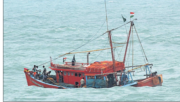
ଉଦ୍ଧାର ହୋଇଥିବା କ୍ରିଷ୍ଣା କହେୟା ବୋଟ୍