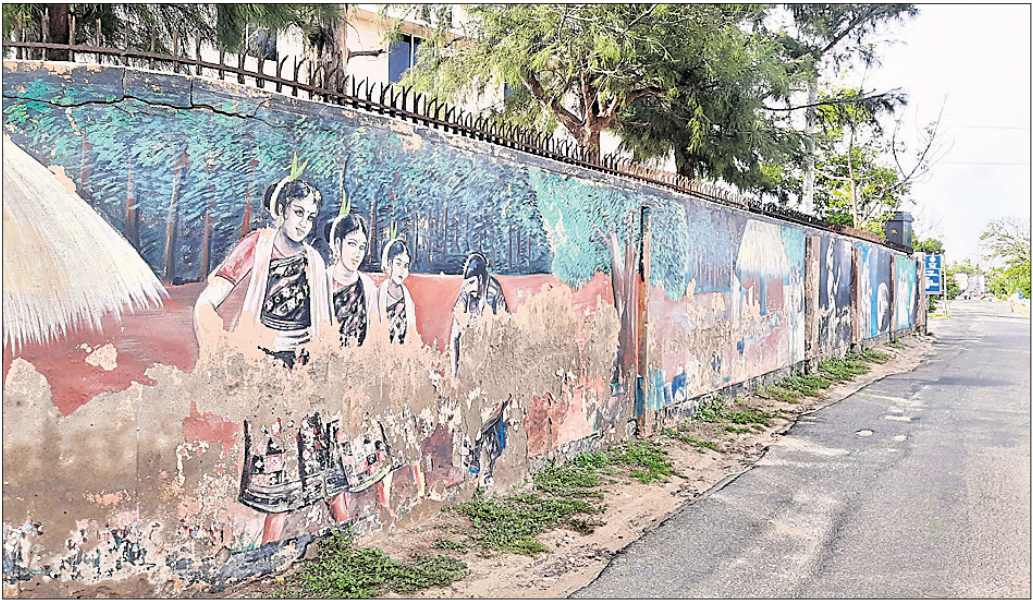
ଭିଆଇପି ରୋଡ୍ ପାର୍ଶ୍ୱ ପାଟେରି କାନ୍ଧରେ ଅଙ୍କାଯାଇଥିବା ଚିତ୍ରକୁ ରଙ୍ଗ ଛାଡ଼ିବାକୁ ନାହିଁ।