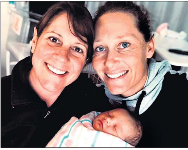
ଘୋଷୁରଙ୍କ ପାର୍ଟନର କନ୍ୟା ସନ୍ତାନର ଜନ୍ମ ହେଲା।

ଘୋଷୁରଙ୍କ ପାର୍ଟନର କନ୍ୟା ସନ୍ତାନର ଜନ୍ମ ହେଲା। ଏହାକୁ ନେଇ ଆମେ ଆପଣଙ୍କୁ ଅବଗତ କରିବା।