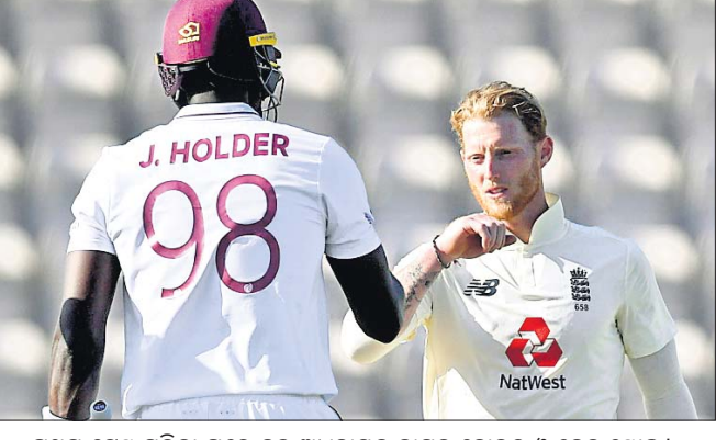
ପ୍ରଥମ ଟେଷ୍ଟ ସରିବା ପରେ ଭୁଲ ଅଧିନାୟକ ଭାବେ ଘୋଷଣା କରାଯାଇଛି।

ଫିଫା ବିଶ୍ୱକପ ଯୋଗ୍ୟତା ପର୍ଯ୍ୟାୟ ଆରମ୍ଭ ହେବ। ଏହାକୁ ନେଇ ଆମେ ଆପଣଙ୍କୁ ଅବଗତ କରିବା।