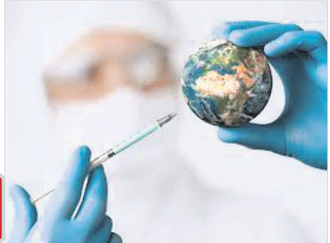
ରୋଗ ଉପରେ ବିଜୟ

ରୋଗ ଏବଂ ମାନବସଭ୍ୟତା ସମାଜର ଲକ୍ଷଣ ଭାବେ ଆମକୁ ବଢ଼ିଚାଲିଛି। ପ୍ରତି ଶତାବ୍ଦୀରେ କୌଣସି ନା କୌଣସି ଭୟଙ୍କର ସଂକ୍ରାମକ ରୋଗ ପ୍ରାକୃତ୍ୟରେ ଧରଣ ହେଉଛି ପୃଥିବୀ ଏବଂ ଏଥିରୁ ମୃତ୍ୟୁ ଲାଗି ଉଦ୍‌ୟମ କରି ଆସିଛି ମଣିଷ। ଏଭଳି ଛଦାପତ୍ର ଭିତରେ କେତେବେଳେ ରୋଗ କିଛି ତ ଆଜ କେବେ ଦାକିନୀୟ କରିଛି ମଣିଷ। ଚିକିତ୍ସା ବିଜ୍ଞାନର ଚମତ୍କାରିତା ଯୋଗୁ ଏକଦା ମୃତ୍ୟୁର ତାଣ୍ଡବ ସୃଷ୍ଟି କରିଥିବା ଅନେକ ସଂକ୍ରାମକ ରୋଗର ଭୟ ବୃଦ୍ଧ ହେଉଛି।