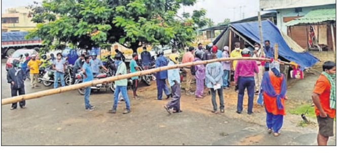
ଛତ୍ରପୁର ପ୍ରକଳ ପଥକୁ ସ୍କ୍ରାପ୍ କରାଯାଇଛି।

ଛତ୍ରପୁର, ୧୫.୭.୨୦ (ସ୍ୱାଭାବ): ଗଞ୍ଜାମ ଜିଲାର ଛତ୍ରପୁର ସର୍ବତ୍ରିଭଙ୍ଗ ଅଧୀନ ସମସ୍ତ ୯ଟି ସହରକୁ ପୁଣି ଶର୍ତ୍ତାଭିନ ଯୋଗ୍ୟ କରାଯାଇଛି। ଗୁରୁବାରଠାରୁ ଆସନ୍ତା ୨୧ ତାରିଖ ପର୍ଯ୍ୟନ୍ତ ଛତ୍ରପୁର, ରଘୁ, ଖଲିକୋଟ, ପୋଲସରା, କୋଦଳା, କବିସୂର୍ଯ୍ୟନଗର ଯୋଗ୍ୟ ହୋଇଥିଲା। ଛତ୍ରପୁର ସର୍ବତ୍ରିଭଙ୍ଗ ଅଧୀନ ସମସ୍ତ ୯ଟି ସହରରେ ଯୋଗ୍ୟ କରାଯାଇଛି। ଏମ୍ପ୍ଲୋୟାମେଣ୍ଟ ସାକ୍ଷରତା କମିଶନ୍ ସହ ଏମ୍ପ୍ଲୋୟାମେଣ୍ଟ ସାକ୍ଷରତା ହୋଇଥିଲା।