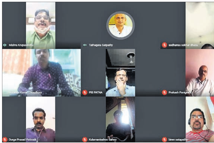
ୱେବିନାରରେ ଭାଗ ନେଇଥିବା ମୁଖ୍ୟବନ୍ଧୁ ଓ ଅନ୍ୟମାନେ ।

ଆମେ ସମସ୍ତେ ଏକ ବୈଶ୍ୱିକ ସଙ୍କଟ ମଧ୍ୟଦେଇ ଗତି କରୁଛୁ । ବର୍ତ୍ତମାନ କରୋନା ମହାମାରୀ ସହ ଚାଲିଥିବା ସୂଚନା ମହାମାରୀ (ଇନ୍‌ଫୋଡେମିକ) ମଧ୍ୟ ଦେଖାଦେଇଛି ।