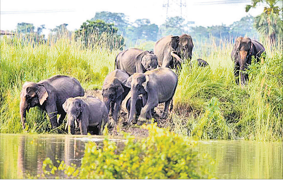
ବନ୍ୟା ଯୋଗୁ ଆସାମର କାକିରଜା ଜାତୀୟ ଉଦ୍ୟାନ ଜଳମଗ୍ନ ହୋଇଯାଇଥିବା ବେଳେ ବୁରାପାହାର ରେଖାର ଉଚ୍ଚ ସ୍ତରରେ ଆଖିପରି ନେଇଛନ୍ତି ହାତୀମାନେ ।