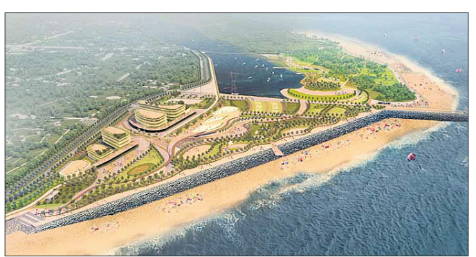
ଶାମୁକା ପ୍ରକଳ୍ପର ଏକ ମଡେଲ୍।

ଓଡ଼ିଶାର ପର୍ଯ୍ୟଟନ-ଶିଳ୍ପ ପାଇଁ ଗୋଟିଏ ନୂଆ ଆଶା ସୃଷ୍ଟି ହୋଇଛି। ୨୦୧୫ରେ ଗଠିତ ଶାମୁକା ଟୁରିଜମ ଡେଭଲପମେଣ୍ଟ କର୍ପୋରେଶନ (ଏସ୍‌ଟିସି) ବୋର୍ଡରେ ରାଜ୍ୟ ସରକାର ବ୍ୟାପକ ପରିବର୍ତ୍ତନ କରିଛନ୍ତି। ଏସ୍‌ଟିସିର ଅଧ୍ୟକ୍ଷତାରେ ରାଜ୍ୟ ପର୍ଯ୍ୟଟନ ବିଭାଗ ଶାସନ ସମିତିକୁ ନିଯୁକ୍ତି ଦିଆଯାଇଛି। ସେହିଭଳି ନିର୍ଦ୍ଦେଶକତାରେ ମୋଟ ୧୨ଜଣଙ୍କୁ ଦାୟିତ୍ଵ ମିଳିଛି। ନିର୍ଦ୍ଦେଶକତାରେ ଇଡ଼େକା ଅଧ୍ୟକ୍ଷ ତଥା ଏସ୍‌ଟିସି ପର୍ଯ୍ୟଟନ ବିଭାଗ ନିର୍ଦ୍ଦେଶକ, ଓଡ଼ିଶା ପର୍ଯ୍ୟଟନ ଉନ୍ନୟନ ନିଗମ (ଓଟିସି) ଏସ୍‌ଟିସି, ପୁରୀ ଜିଲ୍ଲାପାଳ, ପୁରୀ ଡିଏସ୍‌ପିଏକ୍ ସହ ଅଧିକାରୀ, ରାଜସ୍ଵ ଏବଂ ବିପର୍ଯ୍ୟୟ ପରିଚାଳନା ବିଭାଗ, ଜଳାଳ ଓ ପରିବେଶ ବିଭାଗ, ଗୃହ ଏବଂ ନଗର ଉନ୍ନୟନ