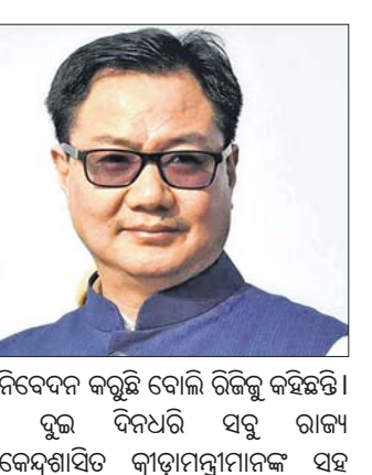
ନିବେଦନ କରୁଛି ବୋଲି ରିଜିକୁ କହିଛନ୍ତି। ଦୁଇ ଦିନଧରି ସବୁ ରାଜ୍ୟ କେନ୍ଦ୍ରଶାସିତ କ୍ରୀଡ଼ାମନ୍ତ୍ରାଳୟ ସହ

ଭର୍ତ୍ତ୍ୟାଳ ମିଟିଂ ଶେଷ ହେବା ପରେ ସେ ଏହି କଥା କହିଛନ୍ତି। ପରିସ୍ଥିତି ସୁଧୁରିଲେ ନନ୍ କଣ୍ଟାକ୍ଟ ଷୋର୍ଟ୍ସ ବା ଶାରୀରିକ ସମ୍ପର୍କରେ ଆସୁ ନ ଥିବା କ୍ରୀଡ଼ା ଆରମ୍ଭ କରିବା ଉପରେ ସେ ରୁଚୁଛନ୍ତି ବୋଲି କହିଛନ୍ତି। ନନ୍ କଣ୍ଟାକ୍ଟ ଷୋର୍ଟ୍ସକୁ ସାମିତ ଭାବେ ଆରମ୍ଭ କରିବାରେ କୌଣସି ଅସୁବିଧା ନାହିଁ କେତେକ ରାଜ୍ୟରେ ଷୋର୍ଟ୍ସ ଟ୍ରେନିଂ ମଧ୍ୟ ଆରମ୍ଭ ହେଲାଣି। ଯଦି ସ୍ଥିତିରେ ଆହୁରି ସୁଧାର ଆସେ ତା'ହେଲେ ଅନ୍ ଫିଲ୍ଡ ଷୋର୍ଟ୍ସ ପ୍ରତ୍ୟାବର୍ତ୍ତନ ପାଇଁ ପ୍ରସ୍ତାବ କରିବୁ ବୋଲି ସେ କହିଛନ୍ତି।