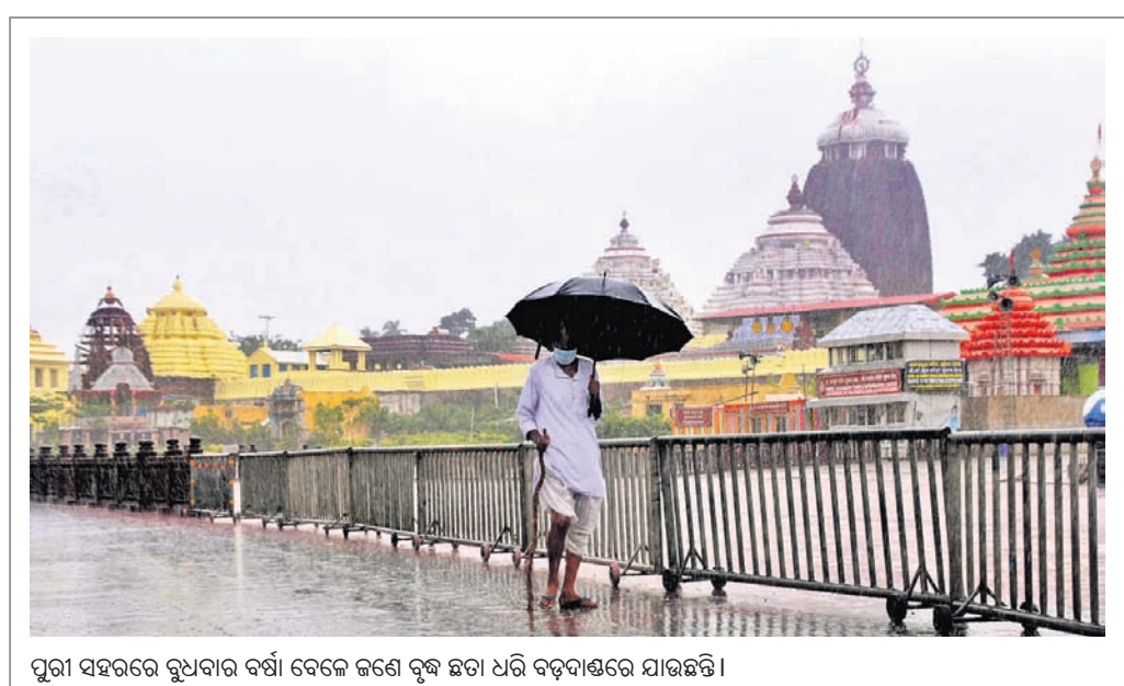
ପୁରୀ ସହରର ରୁପସାଧନ ବର୍ଷା ବେଳେ ଜଣେ ବୃଦ୍ଧ ଛତା ଧରି ବଡ଼ବାଞ୍ଚରେ ଯାଉଛନ୍ତି।

ଗ୍ରାମିଣ ସେବାୟତଙ୍କୁ କରୋନା ସଂକ୍ରମଣରୁ ଦୂରରେ ରଖିବା ଲାଗି ଗ୍ରାମିଣ ପ୍ରଶାସନ ଯୋଜନା କରିଛି। ତେଣୁ ସେବାୟତଙ୍କ ରୋଗ ପ୍ରତିରୋଧକ ଶକ୍ତି ବୃଦ୍ଧି ପାଇଁ ସେମାନଙ୍କୁ ପୁଣି ଥରେ ହୋମିଓପାଥ ଔଷଧ ବ୍ୟବହାର କରାଯିବ। ଆସନ୍ତା ୧୭ ଓ ୧୮ ତାରିଖରେ ପର୍ଯ୍ୟାୟ କ୍ରମେ ବିଭିନ୍ନ ସେବାୟତ ନିଯୋଗ ଏବଂ ଗ୍ରାମିଣ କର୍ମଚାରୀଙ୍କୁ ହୋମିଓପାଥ ଔଷଧ ଦିଆଯିବ। ଏଥିଲାଗି ନାଳନ୍ଦ୍ର ଉଚ୍ଚନିବାସ ପରିସରରେ ସ୍ଵାସ୍ଥ୍ୟ ଶିବିର ହେବ। ଏଥିପାଇଁ ଆବଶ୍ୟକ ବ୍ୟବସ୍ଥା କରିବାକୁ କେନ୍ଦ୍ର ଆୟୁଷ ମନ୍ତ୍ରାଳୟର ଭାରପ୍ରାପ୍ତ ଅଧିକାରୀଙ୍କୁ ଗ୍ରାମିଣ ପ୍ରଶାସନ ତରଫରୁ ଅନୁରୋଧ କରାଯାଇଛି। ୧୭ତାରିଖରେ ସୁଆର ଓ ମହାସୁଆର, ପୁସ୍ତାଳକ, ବିନାବସ୍ତୁ, ଦକ୍ଷତାପତି, ବହୁ ସୁଆର, ଖୁଣ୍ଟିଆ, ପାଟରୀ ବିଶୋଇ, ଘଣ୍ଟୁଆ ଏବଂ ପାର୍ଶ୍ଵ ଦେବଦେବୀ ମନ୍ଦିର