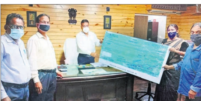
ଖୋର୍ଦ୍ଧା ଶିକ୍ଷା ଜିଲ୍ଲା ପକ୍ଷରୁ ପୁଞ୍ଜାମନ୍ତ୍ରାଳୟ ଠିକିଏ ପାଠିକ୍ଷା ଚେକ୍ ପ୍ରଦାନ କରାଯାଇଛି।

ଅଞ୍ଚଳରେ ଫେରନ୍ତାଙ୍କ ପାଇଁ ସଂକ୍ରମଣ ବଢୁଥିବା ଦେଖିବାକୁ ମିଳୁଛି। ଲକ୍ଷ୍ମୀବଜାର ବସ୍ତି, ସାଲିଆ ସାହିର ନିରକାରୀ, ବିଏମ୍‌ସି ତଥ୍ୟ ଦେଉଛି। ଅନ୍ୟପକ୍ଷେ ଆଦି ୨୦ରୁ ଉର୍ଦ୍ଧ୍ଵ ବସ୍ତିରେ ବୃଦ୍ଧି ପାଉଥିବା ସଂକ୍ରମଣରୁ ଏହା କ୍ଷୟ ହୋଇଛି। ବିଏମ୍‌ସି ଗଞ୍ଜାମ, ଗଜପତି, କଟକ, ବାଲେଶ୍ଵର, ଯାଜପୁର ହସିଗାଲକୁ ଲୋକଙ୍କୁ ଭୁବନେଶ୍ଵର ବସ୍ତି ମନା ବୋଲି ନିର୍ଦ୍ଦେଶନାମା ଜାରି କରିଛି। ହେଲେ ଏହି ନିର୍ଦ୍ଦେଶନାମାର କାର୍ଯ୍ୟକାରୀତା ନେଇ ବସିଷ୍ଠ ନାଗରିକମାନେ ପ୍ରଶ୍ନ ଉଠାଇଛନ୍ତି। ଏଥିସହିତ ହସିଗାଲ ଡାକ୍ତରୀ ଲୋକଙ୍କ ଭୁବନେଶ୍ଵର ଆଗମନରେ ଲଗାମ୍ ଲଗାଇବାରେ ଫଳପ୍ରସ୍ତ ପଦକ୍ଷେପ ନିଆଯାଇନାହିଁ ବୋଲି ଅଭିଯୋଗ କରିଛନ୍ତି। ସହରର ପ୍ରବେଶ ପଥଗୁଡ଼ିକରେ ବ୍ୟାପକ ଯାଞ୍ଚ ବ୍ୟବସ୍ଥା କରାଯିବାକୁ ସେମାନେ ଦାବି କରିଛନ୍ତି।