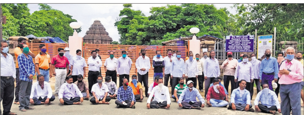
ସୂର୍ଯ୍ୟ ମନ୍ଦିର ସମ୍ମୁଖରେ ଧାରଣାରେ ବସିଥିବା ଗାଈଡ, ଫଟୋଗ୍ରାଫରମାନେ।

ବସ୍ତିରୁ ୪୦ବର୍ଷୀୟ ପୁରୁଷ, ନୟାପଲ୍ଲୀରୁ ୩୦ବର୍ଷୀୟ ମୁକ୍ତ, ସୁନି-୪ରୁ ୨୭ ବର୍ଷୀୟ ମୁକ୍ତ, ରଘୁନାଥପୁର ଜଣେ ୧୬ ବର୍ଷୀୟ ବାଳକ ଓ ଅନ୍ୟଜଣେ ୫୦ବର୍ଷୀୟ ପୁରୁଷ, ଖଣ୍ଡଗିରିରୁ ୬୫ ବର୍ଷୀୟ ପୁରୁଷ ଓ ଅନ୍ୟଜଣେ ୬୩ ବର୍ଷୀୟ ମୁକ୍ତ, କୋଭିଡ୍‌ଆରୁ ୩୦ବର୍ଷୀୟ ମହିଳା, ପାପୁଡ଼ାପୁରୁ ୩୮ବର୍ଷୀୟ ପୁରୁଷ, ଖଣ୍ଡଗିରିରୁ ୩୯ବର୍ଷୀୟ ପୁରୁଷ, ବରମୁଣ୍ଡାରୁ ୨୪ ଓ ୩୫ ବର୍ଷୀୟ ମହିଳା, ଘରୋଇ ହସିଗାଲକୁ ଜଣେ ୩୦ ବର୍ଷୀୟ ମହିଳା କର୍ମଚାରୀ ପଞ୍ଜିଟିଭ୍ ଟିକ୍ସ ହୋଇଛନ୍ତି। ଏମାନଙ୍କ ମଧ୍ୟରୁ ୬ ଆକ୍ରାନ୍ତ ବାହାର ହସିଗାଲ ଡାକ୍ତରୀରେ କରୋନା ସଂକ୍ରମଣରୁ ରକ୍ଷିତ ହୋଇଥିବାବେଳେ ୬ ଆକ୍ରାନ୍ତ ଘରୋଇ ମେଡିକାଲ କର୍ମଚାରୀ। ଅନ୍ୟ ୧୫ଜଣ ଗ୍ଲାନାୟ ଆକ୍ରାନ୍ତ ଟିକ୍ସ ହୋଇଥିବା ୨୭ଜଣଙ୍କ ମଧ୍ୟରୁ ବିଭିନ୍ନ ନଗରରୁ ହୋଇଥିବା ଭୁବନେଶ୍ଵର ମହାନଗର ନିଗମ (ବିଏମ୍‌ସି) ସୂଚନା ଦେଇଛି। ୬୩ଜଣ କ୍ୟାମ୍ପାୟନରୁ ରହିଥିବାବେଳେ ୨୭ଜଣ ଗ୍ଲାନାୟ ସଂକ୍ରମିତ ରହିଛନ୍ତି। ଏମାନଙ୍କୁ ମିଶାଇ ସହରରେ ଆକ୍ରାନ୍ତଙ୍କ ସଂଖ୍ୟା ୮୫୯ରେ ପହଞ୍ଚିଛି। ତେବେ ଏଥିମଧ୍ୟରୁ ପାଖାପାଖି ୫୦% ଗ୍ଲାନାୟ ଆକ୍ରାନ୍ତ ରହିଛନ୍ତି। କହିବାକୁ ଗଲେ ରାଜଧାନୀରେ କରୋନା ଗୋଷ୍ଠୀ ସଂକ୍ରମଣର ରୂପ ନେଇଥିବାବେଳେ