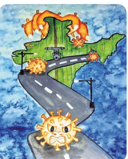
କଳାଶି ଭାବୁ କ୍ଲାସ-୮, ସେଣ୍ଟ ଯୋଶେଫ କନଭେଣ୍ଟସ୍କୁଲ, ସମଲପୁର