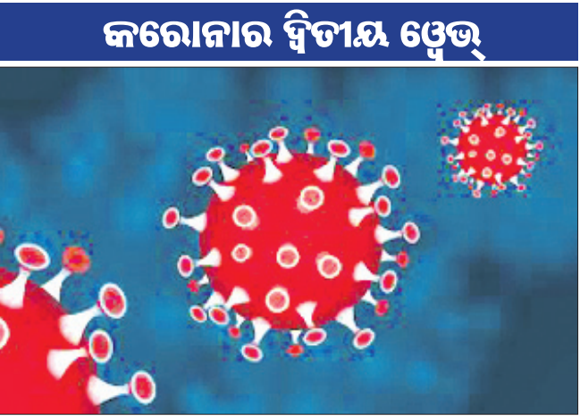
କରୋନା ବିତ୍ୟାୟ ଫେଜ୍