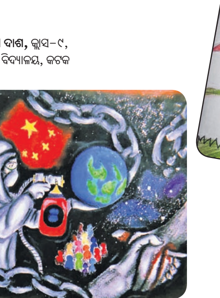
ସୀରାକୀ ଦାଶ, କ୍ଲାସ-୯, କେନ୍ଦ୍ରୀୟ ବିଦ୍ୟାଳୟ, କଟକ