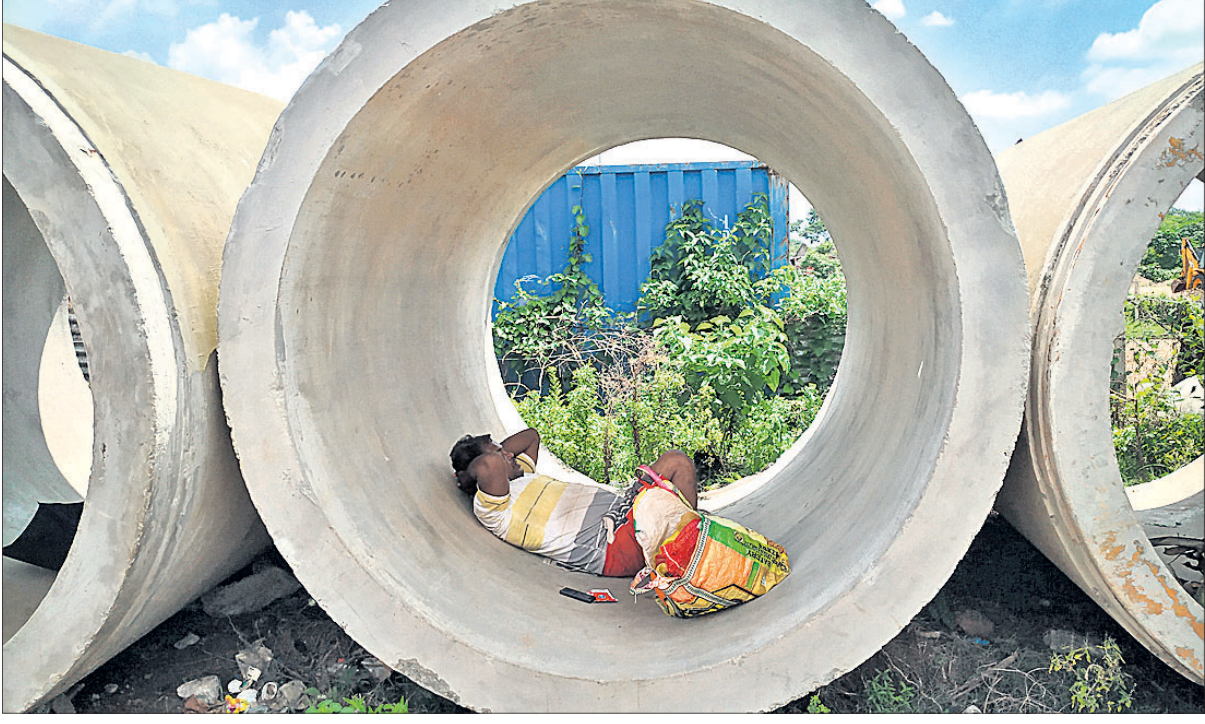
କଟକ ସିଡିପିଓ ରାସ୍ତା ପାର୍ଶ୍ୱସ୍ଥ ସିମେଣ୍ଟ କ୍ୟାଣ୍ଡିଟ ପାଇପ୍ ଲିଟରେ ଶୁକ୍ରବାର ଜଣେ ଶ୍ରମିକ ସାମୟିକ ବିଶ୍ରାମ ନେଉଛନ୍ତି ।