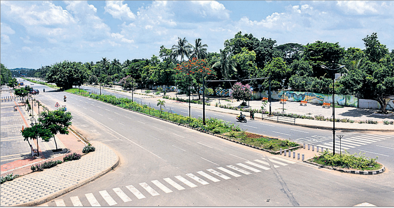
୧୪ ଦିନିଆ ଲକ୍ଷ୍ମୀଭଙ୍ଗର ପ୍ରଥମ ଦିନ ଶନିବାର ରାଜମହଲ ଛକ ଶୁଭଶାନ୍ଦ୍ ।