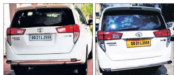
ନମର ପ୍ଲେଟ୍ ରଙ୍ଗ ବଦଳିବା ପୂର୍ବରୁ ଓ ପରେ।