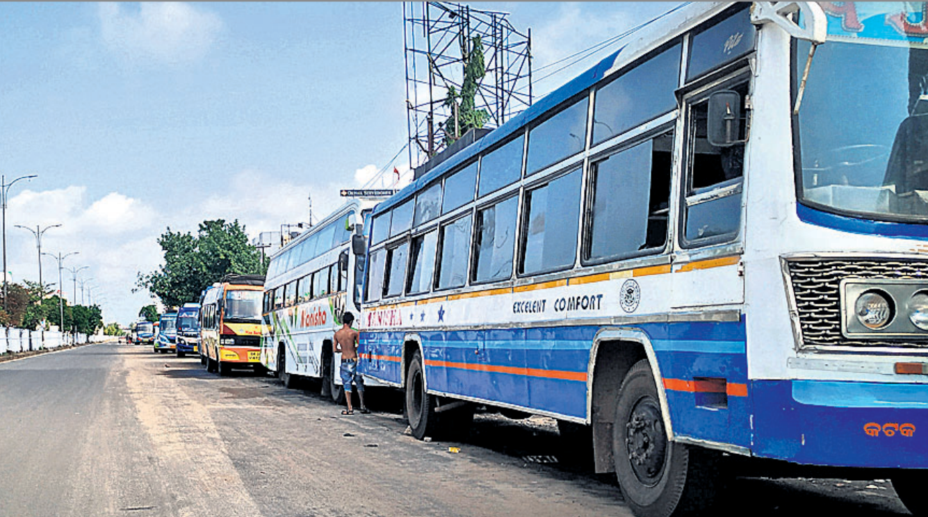
କଟକ ଲିଙ୍କରୋଡ଼ଠାରେ ରାସ୍ତା ପାର୍ଶ୍ୱରେ ଅଟକି ରହିଥିବା ଘରୋଇ ବସ୍ ।