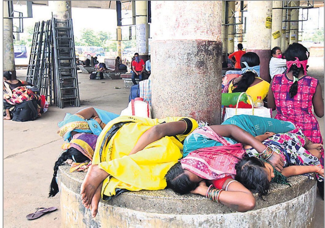
ବରମୁଣ୍ଡା ବସ୍ଷାଞ୍ଚରେ ଯାତ୍ରୀମାନେ ବିଶ୍ରାମ ନେଉଛନ୍ତି ।