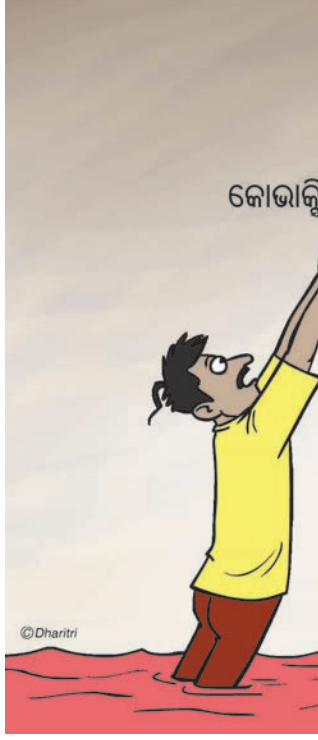
କୋଭାକ୍ସିନ୍ କରୋନା ମହାମାରୀ