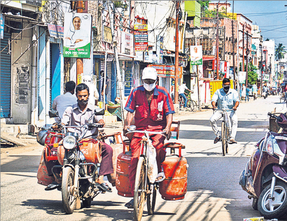
କଟକ ଦୋକମୁଣ୍ଡେଇ ଛକରେ ଅତ୍ୟାବଶ୍ୟକ ସାମଗ୍ରୀ ଭାବେ ଗ୍ୟାସ୍ ସିଲିଣ୍ଡର ନେଇ ଲୋକେ ଯାଉଛନ୍ତି ।