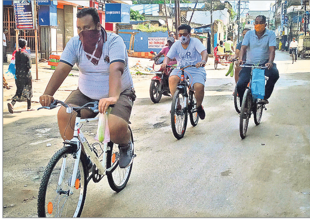
କଟକ ତିନିକୋଣିଆ ବରିଚା ନିକଟରେ ସାଇକେଲ ଚଳାଇ ଲୋକମାନେ ଯାଉଛନ୍ତି ।