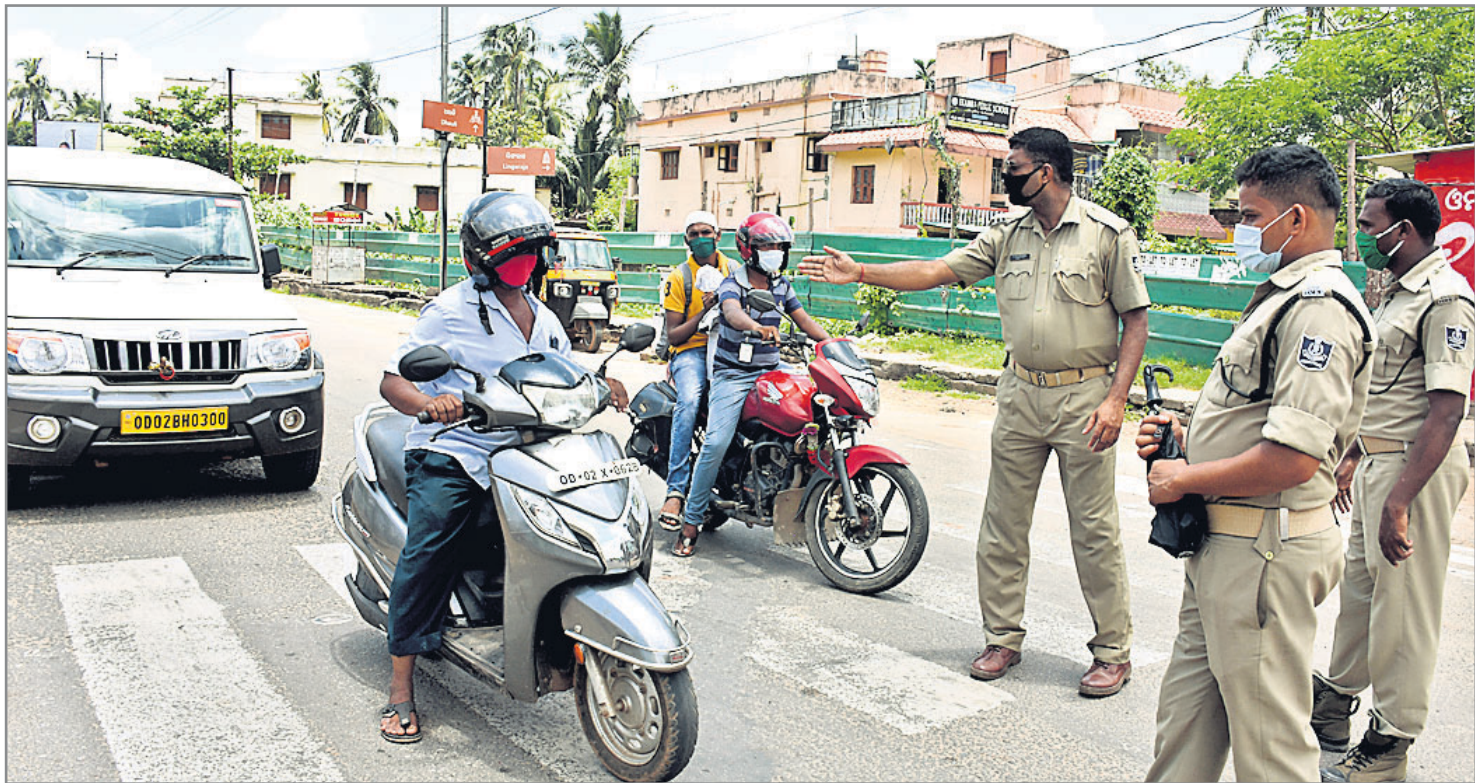
ଭୁବନେଶ୍ୱର ଗ୍ୟାରେଜ ଛକଠାରେ ପୋଲିସ ପକ୍ଷରୁ ଲୋକଙ୍କୁ ଯାଞ୍ଚ କରାଯାଉଛି ।