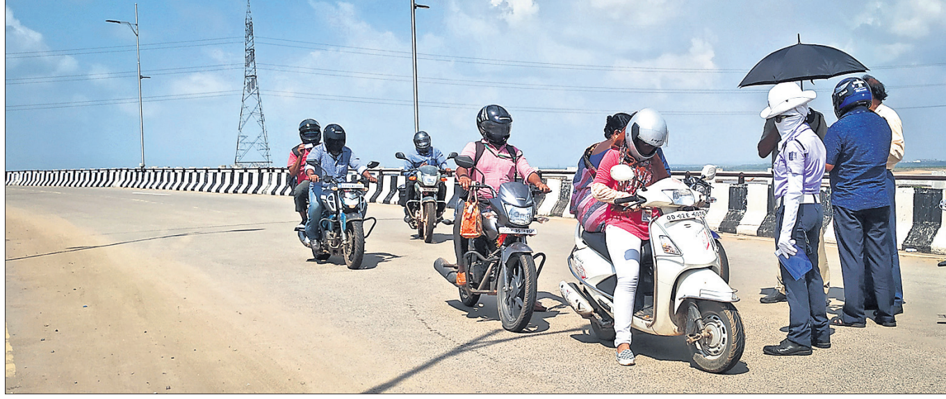
୧୪ ଦିନିଆ ଲକ୍ଷ୍ମୀଭଙ୍ଗ ପ୍ରଥମ ଦିନ ଶନିବାର କଟକର ଅନ୍ୟତମ ପ୍ରଦେଶ ପଥ ସିଡିଏ ନେତାଜୀ ସେତୁ ଉପରେ ପୋଲିସ୍ ସାଥୀ କରୁଛି।