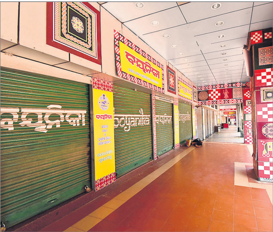
ଭୁବନେଶ୍ୱର ମାର୍କେଟ ବିଲ୍ଡିଂରେ ଥିବା ବୟନିକା ଦୋକାନରେ ତାଲା ।