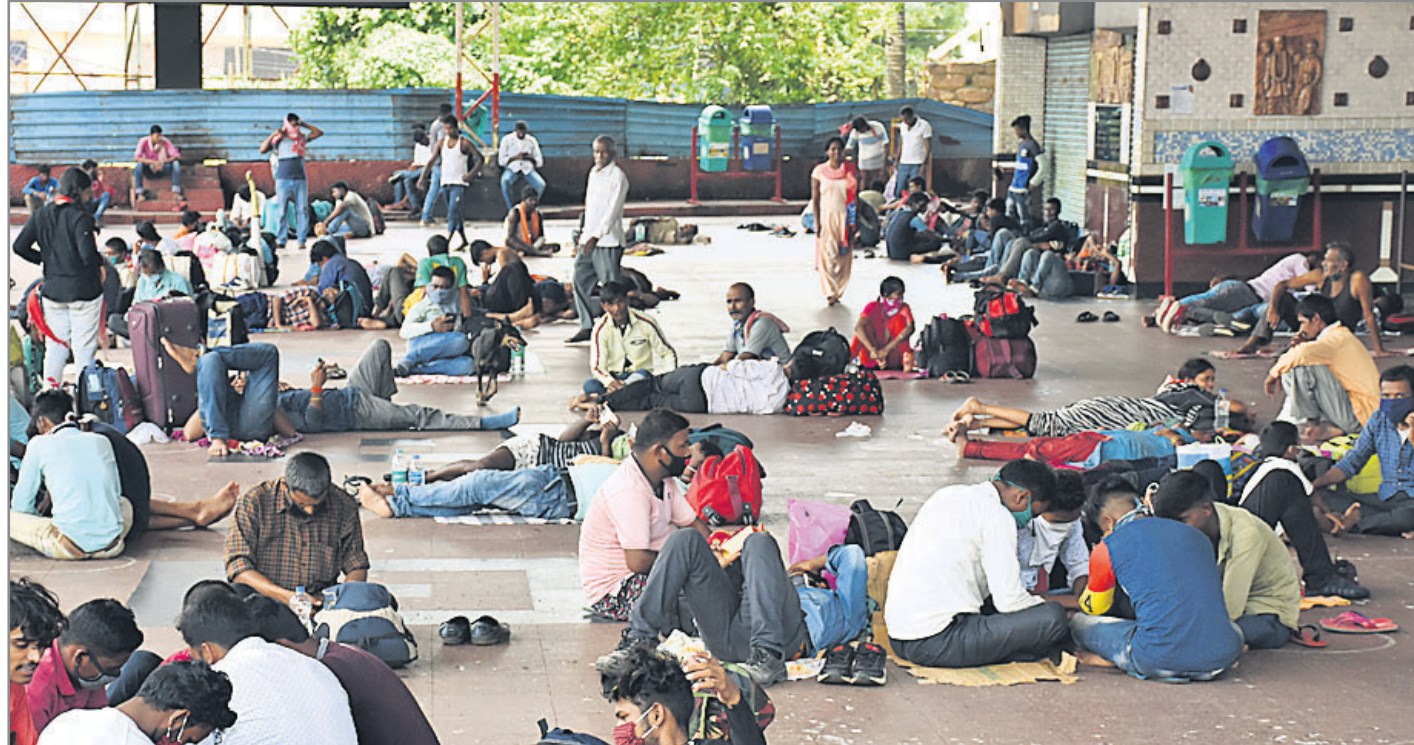
ଭୁବନେଶ୍ୱର ରେଳଷ୍ଟେଶନରେ ଅପେକ୍ଷାରତ ଯାତ୍ରୀ ।