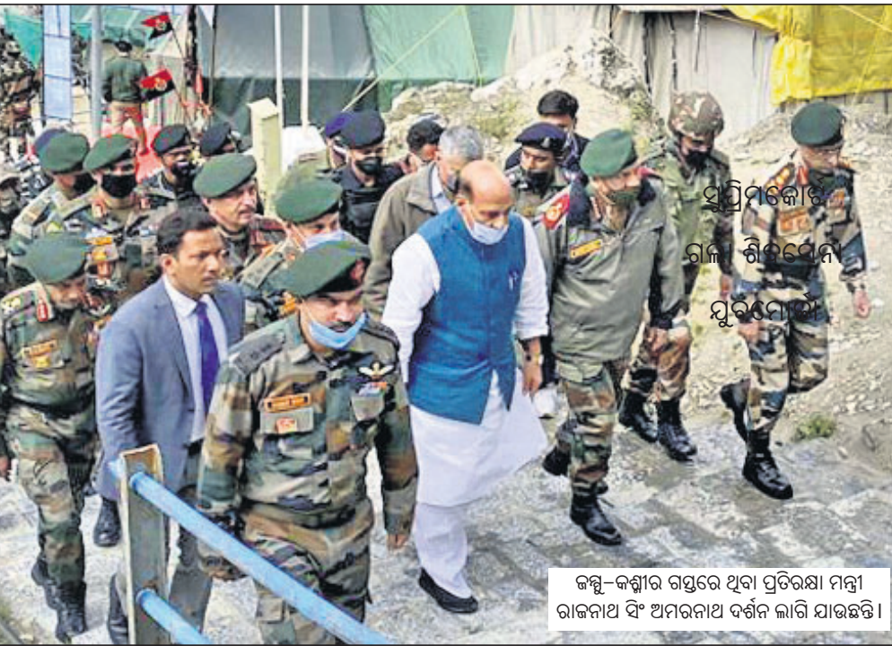
କନ୍ୟା-କନ୍ୟାର ଗପରେ ଥିବା ପ୍ରତିରକ୍ଷା ମନ୍ତ୍ରୀ ରାଜନାଥ ସିଂ ଅମରନାଥ ଦର୍ଶକ ଲାଗି ଯାଉଛନ୍ତି ।

ରାଜସ୍ଥାନ ସରକାରରେ ଅସ୍ଥିରତା ଦେଖାଦେଇଥିବାରୁ ଏହାକୁ ବିଚାରକୁ ନେଇ ରାଜ୍ୟପାଳ କଲରାଜ ମିଶ୍ର ସେଠାରେ ରାଷ୍ଟ୍ରପତି ଶାସନ ଜାରି ଲାଗି ପୁସ୍ତାକରଣ କରୁ ବୋଲି ବସୁନ୍ଦରା ସମାଜ ପାର୍ଟି (ବିଏସ୍ପି) ସୁପ୍ରିମୋ ମାୟାବତୀ ଦାବି କରିଛନ୍ତି । ମୁଖ୍ୟମନ୍ତ୍ରୀ ଅଶୋକ ଗେହଲଟ ଦଳବଦଳ ଆଇନର ଖୋଲା ଉଲ୍ଲଙ୍ଘନ କରି ବିଚାର ଥର ମିଳିତ ଆଲୋଚନା ହୋଇଥିଲା । ଭାରତୀୟ ଗ୍ରାହକଙ୍କ ପାର୍ଟି (ବିପି)ର ବୁଲି ବିଧାୟକ ସରକାରଙ୍କୁ ସେମାନଙ୍କ ସମର୍ଥନ ଘୋଷଣା କରିଥିବା ଗେହଲଟ ରୁଚକ କରିଛନ୍ତି ।