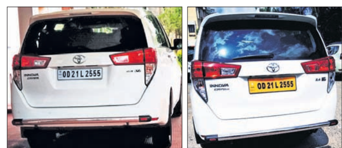
ନମର ପ୍ଲେଟ୍‌ର ରଙ୍ଗ ବଦଳିବା ପୂର୍ବରୁ ଓ ପରେ।