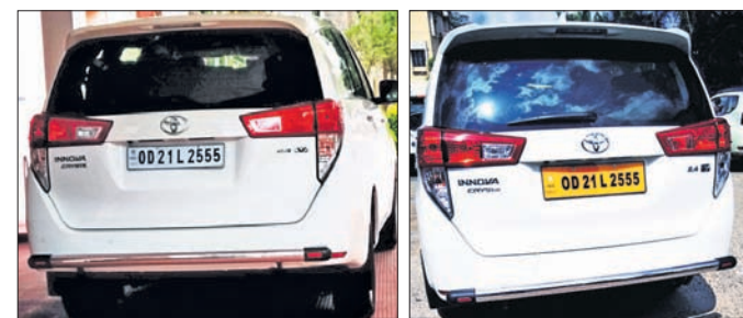
ନମର ପ୍ଲେଟ୍ ରଙ୍ଗ ବଦଳିବା ପୂର୍ବରୁ ଓ ପରେ।

ଓଡ଼ିଶା ସମେତ ସାରା ଦେଶରେ ଏବେ ମହିଳା ବିରୋଧୀ ସାଇବର ଅପରାଧ ଏକ ପ୍ରକାର ଟ୍ରେଣ୍ଡ ପାଲଟିଗଲାଣି। ମହିଳାଙ୍କ ନାମ ଓ ଫଟୋ ବ୍ୟବହାର କରି ଫେକ୍ ପ୍ରୋଫାଇଲ୍ ତିଆରି କରିବା, ସାଇବର ବୁଲିଂ, ଅନ୍‌ଲାଇନ୍ ଷ୍ଟକିଂ ବର୍ତ୍ତମାନ ସମୟରେ ସବୁଠାରୁ ବଡ଼ ଟ୍ୟାଲେଞ୍ଜ ଭାବେ ଉଭାହୋଇଛି। ସେହିଭଳି ସୋସିଆଲ ମିଡିଆରେ ମହିଳାଙ୍କ ବିରୋଧରେ ଅସମ୍ଭବନୀୟ ଘୋଷ୍ଟ ଏବଂ କମ୍ପେକ୍ସ ମଧ୍ୟ ଏହି ଲକ୍ଷ୍ମଣର ସମୟରେ ବୃଦ୍ଧି ପାଇଛି। କରୋନା ସମୟରେ ରାଜ୍ୟରେ ମହିଳା ବିରୋଧୀ କେତେ ସାଇବର ଅପରାଧ ଘଟିଛି ତାହା ନିର୍ଦ୍ଦିଷ୍ଟ ଭାବେ ଜଣାପଡ଼ି ନ ଥିଲେ ହେଁ ନ୍ୟାଶନାଲ କ୍ରାଇମ୍ ରେକର୍ଡ୍ ବ୍ୟୁରୋ(ଏନ୍‌ସିଆର୍‌ସି) ରିପୋର୍ଟ ଅନୁଯାୟୀ, ଫ୍ଲୁପ୍ସା-୪