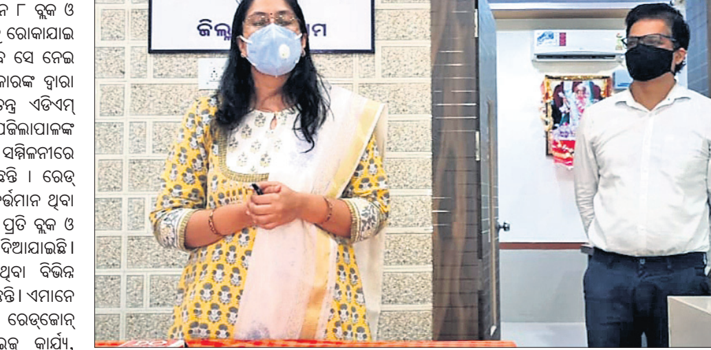
ସତନ୍ତ୍ର ଏଡିଏମ୍ ସୂଚନା ଦେଇଛନ୍ତି।

ଗଞ୍ଜାମ ଜିଲ୍ଲା ଛତ୍ରପୁର ସବ୍ଡିଭିଜନ ଅଧିନ ୮ ବ୍ଲକ ଓ ୯ ସହରରେ କିଲି କରୋନା ସଂକ୍ରମଣକୁ ରୋକାଯାଇ ପାରିବ ଏବଂ ଏହାର ପ୍ରତିରୋଧକ ହେବ ସେ ନେଇ ଉଦ୍ୟମ ଆରମ୍ଭ ହୋଇଛି। ରାଜ୍ୟ ସରକାରଙ୍କ ଦ୍ୱାରା ନିଯୁକ୍ତ ଆଇଏସଏ ତଥା ଛତ୍ରପୁର ସ୍ୱତନ୍ତ୍ର ଏଡିଏମ୍ ପାଠୁଳ ପକ୍ଷରୁ ଶନିବାର ଛତ୍ରପୁର ଉପଜିଲ୍ଲାପାଳଙ୍କ କାର୍ଯ୍ୟାଳୟରେ ଅନୁଷ୍ଠିତ ଖବରଦାତା ସମ୍ମିଳନୀରେ ଏ ସମ୍ପର୍କରେ କେତେକ ସୂଚନା ଦେଇଛନ୍ତି। ରେଡ୍ କୋର୍ଡ କିଲି ଗ୍ରାନ୍ତକୋର୍ଡ ହେବ ଏବଂ ବର୍ତ୍ତମାନ ଥିବା ଗ୍ରାନ୍ତକୋର୍ଡ ବନ୍ଦବନ୍ଦ ରହିବ ସେନେଇ ପ୍ରତି ବ୍ଲକ ଓ ସହର ପାଇଁ ଜଣେ ଓଏସଡିକୁ ନିଯୁକ୍ତି ଦିଆଯାଇଛି। ଓଡିଶା ସରକାରଙ୍କ ପକ୍ଷରୁ ପଠାଯାଇଥିବା ବିଭିନ୍ନ ପ୍ରଶାସନିକ ଅଧିକାରୀ ଏହି ଦାୟିତ୍ୱରେ ଅଛନ୍ତି। ଏମାନେ ରେଡ୍‌କୋର୍ଡକୁ ଗ୍ରାନ୍ତକୋର୍ଡ କିଲି ହେବ, ରେଡ୍‌କୋର୍ଡ ଓ କ୍ୱେନ୍‌ମେଣ୍ଟ କୋର୍ଡରେ ସାମାଜିକ କାର୍ଯ୍ୟ, ଜରୁରୀକାଳୀନ ସେବା, ରାଶନ ସାମଗ୍ରୀ ଲୋକଙ୍କ ପାଖରେ କିଲି ପହଞ୍ଚାଯିବ ଏହାର ମନିଟରିଂ କରି ତଥ୍ୟ ପକ୍ଷରୁ ଦେବେ। ଏଥିସହ ସ୍ୱାସ୍ଥ୍ୟ, ପୋଲିସ୍ ଓ ପ୍ରଶାସନିକ ଅଧିକାରୀଙ୍କ ମଧ୍ୟରେ କୋଭିଡ୍ ପରିଚାଳନା ପାଇଁ ଏମାନେ ସମନ୍ୱୟ ରକ୍ଷା କରିବେ ବୋଲି ପକ୍ଷରୁ ସୂଚନା ଦେଇଛନ୍ତି। ବର୍ତ୍ତମାନ ୧୨୪ ଗାଁ ରେଡ୍‌କୋର୍ଡରେ ଓ ୮୧୩ ଗ୍ରାନ୍ତ କୋର୍ଡରେ ରହିଛି। ସେହିପରି ସହରରେ ୭୩ ଖାଡ୍ ରେଡ୍‌କୋର୍ଡରେ ଓ ୬୩ ଖାଡ୍ ଗ୍ରାନ୍ତକୋର୍ଡରେ ରହିଛି। ଏଥିସହ ସହରାଞ୍ଚଳରେ ୧୨ ଓ ଗ୍ରାମାଞ୍ଚଳରେ ୫୨କ୍ୱେନ୍‌ମେଣ୍ଟ କୋର୍ଡ ହେବ।