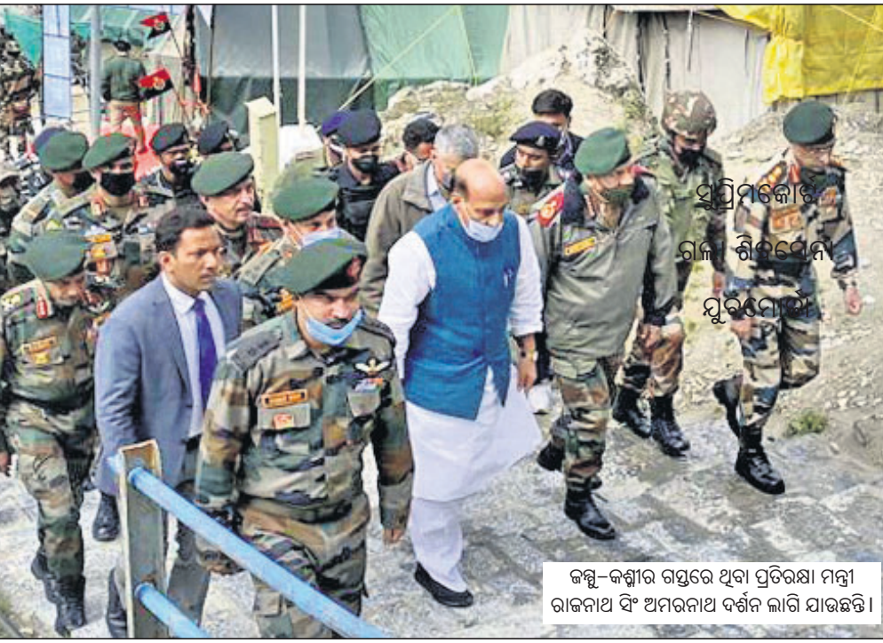
କନ୍ୟା-କନ୍ୟାର ଗପରେ ଥିବା ପ୍ରତିରକ୍ଷା ମନ୍ତ୍ରୀ ରାଜନାଥ ସିଂ ଅମରନାଥ ଦର୍ଶନ ଲାଗି ଯାଇଛନ୍ତି ।