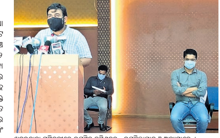
ଖବରଦାତା ସମ୍ମିଳନୀରେ ଉପସ୍ଥିତ କମିଶନର, ଉପଜିଲ୍ଲାପାଳ ଓ ଅନ୍ୟମାନେ।