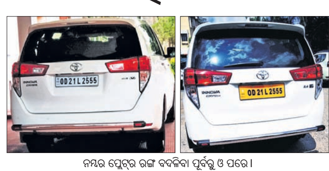
ନମର ପ୍ଲେଟ୍ ରଙ୍ଗ ବଦଳିବା ପୂର୍ବରୁ ଓ ପରେ।