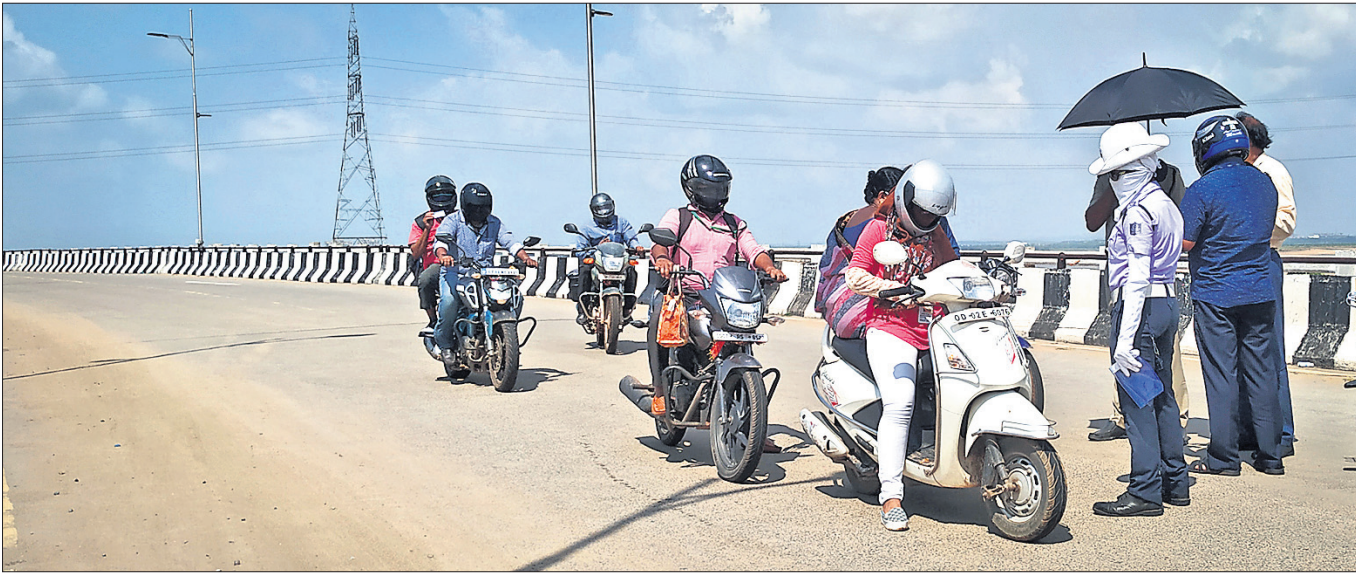
୧୪ ଦିନିଆ ଲକ୍ଷ୍ମୀଭଙ୍ଗ ପ୍ରଥମ ଦିନ ଶନିବାର କଟକର ଅନ୍ୟତମ ପ୍ରଦେଶ ପଥ ସିଡିଏ ନେତାଜୀ ସେତୁ ଉପରେ ପୋଲିସ୍ ଯାଞ୍ଚ କରୁଛି।