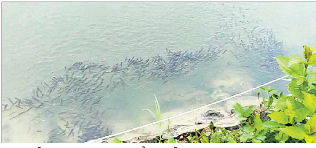
ପୁଲକାଶୀରେ ବିଭାଗ ପକ୍ଷରୁ ଥିବା ପୋଖରୀରେ ମାଛ ଯାଆଁଳ ଛତାଯାଇଛି ।

ରାଜ୍ୟ ସରକାର ମତ୍ୟଜୀବାମାନଙ୍କୁ ମାଛତାଷ ଲାଗି ପ୍ରୋତ୍ସାହନ ଦେଉଛନ୍ତି। ଏବେ ମହିଳା ସ୍ୱୟଂ ସହାୟିକା ଗୋଷ୍ଠୀ ଯେଉଁମାନେ ମାଛ ଚାଷ କରି ଲାଭବାନ୍ ହେବେ ସେ ନେଇ ବି ଯୋଜନା ହୋଇଛି।