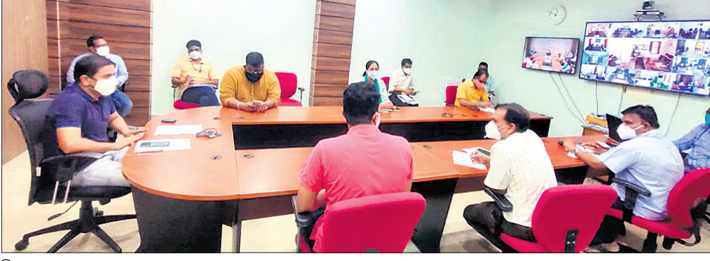
ଜିଲ୍ଲାପାଳ ଓ ଅନ୍ୟମାନେ ।