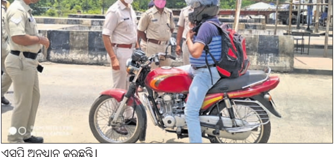
ଏସପି ଅନୁଧ୍ୟାନ କରୁଛନ୍ତି ।

କରୋନା ଆକ୍ରାନ୍ତଙ୍କ ସଂଖ୍ୟା ବୃଦ୍ଧି ପାଇଥିବାରୁ ଗଞ୍ଜାମ ଜିଲ୍ଲାର ସମସ୍ତ ସୀମା ସିଲ୍ କରାଯାଇଛି। ଗଞ୍ଜାମ-ଆନ୍ତ୍ର ସୀମାଠାରେ ଆରମ୍ଭ କରି ଗଜପତି, କନ୍ୟାମାନ, ନୟାଗଡ଼, ଖୋର୍ଦ୍ଧା ଓ ପୁରୀ ସୀମାକୁ ସିଲ୍ କରାଯାଇଛି। ଏଥିସହ ସେମାନଙ୍କୁ କୋଭିଡ୍ କେମ୍ପରେ ସେକ୍ୱେସ୍ଟ୍ରିଂ କରାଯାଇଛି।