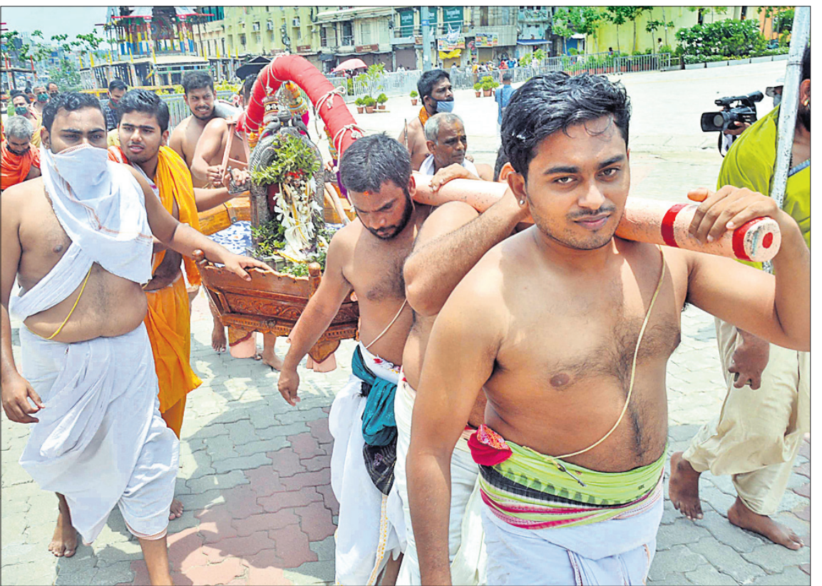
ତିରାଇଣି ଅମାବାସ୍ୟା ଅବସରରେ ସୋମବାର ପୁରୀ ଶ୍ରୀମନ୍ଦିରରୁ ଅମାବାସ୍ୟା ନାରାୟଣଙ୍କ ସାଗର ବିତେ ।