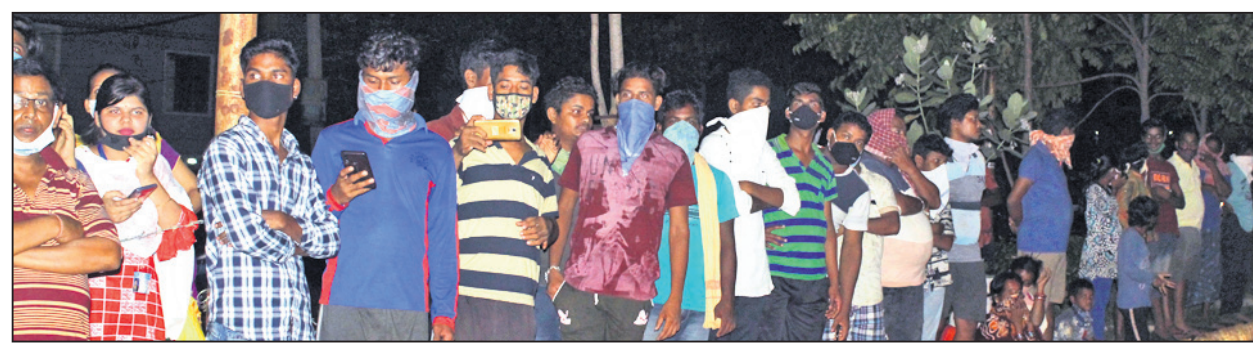
ମୃତ୍ୟୁ ଖବର ଶୁଣିବା ପରେ ହସିଚାଲ ବାହାରେ ପ୍ରଶଂସକଙ୍କ ଭିଡ଼