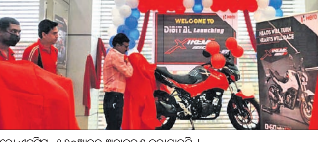
ହିରୋ ଏକ୍ସ୍ପ୍ରେସ୍-୧୬୦ଆର୍ ଅନାବରଣ କରାଯାଇଛି ।