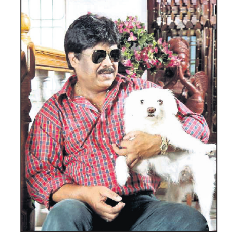
କୁକୁର ସହ ଅବସର ସମୟରେ