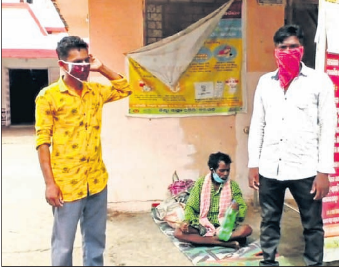
ଶଯ୍ୟାଭାବକୁ ପୁରୁଣା ପୁଖ୍ୟ ଡାକ୍ତରଖାନା ଚଟାଣରେ ଜଣେ ରୋଗୀ ବସିଛନ୍ତି । ଜିଲା ପୁଖ୍ୟ ଡାକ୍ତରଖାନାରେ ମଞ୍ଜୁରୀପ୍ରାପ୍ତ ଡାକ୍ତର ସଂଖ୍ୟା ୧୯ ଅଟେ । କିନ୍ତୁ ଏଠାରେ ୩୯ ଜଣ ଡାକ୍ତର ଥିବାବେଳେ ଅନ୍ୟ ୩୦ଟି ପଦବୀ ଖାଲି ପଡ଼ିଛି । ଏଭଳି ପଡ଼ିଥିବା ବିଭାଗ ରୁଡ଼ିକୁ ଖୋଲାଯାଇଛି ଏବଂ ଆନୁଷ୍ଠାନିକ ବ୍ୟବସ୍ଥା ସଜାଡ଼ିବାରେ ଜିଲା ସ୍ଵାସ୍ଥ୍ୟ ବିଭାଗ ତତ୍ପର ହୋଇ ଉଠିଛି । ଅନ୍ୟପକ୍ଷେ ଡାକ୍ତର ଅଭାବ ରୋଗୀସେବାରେ ବାଧା ସୃଷ୍ଟି କରିଛି ।