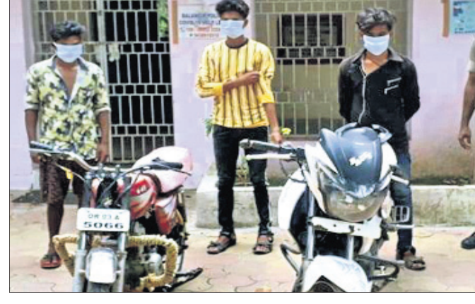
ଗିରଫ ଚଳି ଅଭିଯୁକ୍ତ ସହ ଜବତ ବାଇକ ।