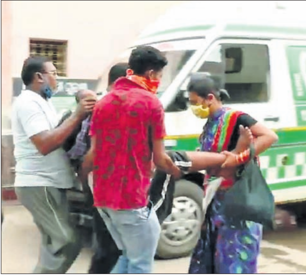
ପୁରୁଣା ପୁଖ୍ୟ ଡାକ୍ତରଖାନାକୁ ଜଣେ ରୋଗୀଙ୍କୁ ବୁକୁଳା ସ୍ଥାନାନ୍ତର କରାଯାଇଛି । ଏଠାକୁ ଆସୁଥିବା ରୋଗୀଙ୍କୁ ହତହତା ହେବାକୁ ପଡ଼ୁଛି । ଏଠାରେ କେବଳ ୨୦ଟି ଶଯ୍ୟା ରହିଛି । ଶଯ୍ୟାଭାବ ଯୋଗୁ ଡାକ୍ତରଖାନା ଚଟାଣରେ ରୋଗୀଙ୍କ ଚିକିତ୍ସା ଚାଲିଛି । ସେହିପରି ପ୍ରତ୍ୟୁତ ବିଭାଗରେ ରୁହେବାରୁ ବିଭାଗରେ ତାଲା ଝୁଲୁଛି । ଆବଶ୍ୟକ ସଂଖ୍ୟକ ଶଯ୍ୟା ନ ଥିବାବେଳେ ବିଭିନ୍ନ ଯନ୍ତ୍ରପାତି ତଥା ସ୍ଵାସ୍ଥ୍ୟ ପରୀକ୍ଷା ଉପକରଣର ଅଭାବ ରହିଛି । ଫଳରେ

ଜଣେ କାର୍ଯ୍ୟରେ ତାଙ୍କର କରୋନା ପଜିଟିଭ ଜଣାପଡ଼ିବା ପରେ ରବିବାରଠାରୁ ବରଗଡ଼ ସହର ଉପକଣ୍ଠ ଖେଦାପାଳି (ବୁକୁଳା)ରେ ଥିବା ଜିଲା ପୁଖ୍ୟ ଡାକ୍ତରଖାନାକୁ ୪୫ଦିନ ପାଇଁ ଶର୍ତ୍ତାଭିତ୍ତି କରି ଦିଆଯାଇଛି । ସେଠାରେ ଚିକିତ୍ସାଧୀନ ରୋଗୀଙ୍କ ମଧ୍ୟରୁ ଗୁରୁତରଙ୍କୁ ଭିମସାର, ବୁକୁଳା ସ୍ଥାନାନ୍ତର କରାଯାଇଛି । ଅପରପକ୍ଷେ ଯେଉଁମାନଙ୍କ ସ୍ଵାସ୍ଥ୍ୟାବସ୍ଥାରେ ଚୁଖିଆର ଆସିଛି, ସେମାନଙ୍କୁ ତିସ୍ତାର୍ଚ୍ଚ କରି ଦିଆଯାଇ ଥିବାବେଳେ ଅନ୍ୟମାନଙ୍କୁ ସହର ମଧ୍ୟରେ ଥିବା ପୁରୁଣା ଜିଲା ପୁଖ୍ୟ ଡାକ୍ତରଖାନା (ବର୍ତ୍ତମାନର ସହରାଞ୍ଚଳ ଗୋଷ୍ଠୀ ସ୍ଵାସ୍ଥ୍ୟକେନ୍ଦ୍ର)କୁ ଅଣାଯାଇଛି । ତେବେ ଏଠାରେ ସ୍ଵାସ୍ଥ୍ୟସେବା ସ୍ଵାଭାବିକ ହୋଇପାରି ନାହିଁ । ରୋଗୀଙ୍କ ଦୁଃଖ ବଢ଼ି ଯାଇଛି । ସ୍ଵାସ୍ଥ୍ୟସେବା ଯୋଗାଣବା ପାଇଁ ପୁରୁଣା ପୁଖ୍ୟ ଡାକ୍ତରଖାନାରେ ଆଗଭଳି ଆଉ ଆନୁଷ୍ଠାନିକ ବ୍ୟବସ୍ଥା ନାହିଁ । ନବକାଟ ଶିଳ୍ପପଦ୍ଧତି କେନ୍ଦ୍ର (ଏସଏଏସିପି), ଅସ୍ତ୍ରୋପଚାର କକ୍ଷ ଭଳି ଅନେକ ଉତ୍କୃଷ୍ଟ ବିଭାଗରେ ତାଲା ଝୁଲୁଛି । ଆବଶ୍ୟକ ସଂଖ୍ୟକ ଶଯ୍ୟା ନ ଥିବାବେଳେ ବିଭିନ୍ନ ଯନ୍ତ୍ରପାତି ତଥା ସ୍ଵାସ୍ଥ୍ୟ ପରୀକ୍ଷା ଉପକରଣର ଅଭାବ ରହିଛି । ଫଳରେ