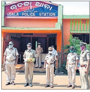
ହାବିଲଦାର କାରୁହରୀ ମାଝିଙ୍କୁ ସ୍ଵାଗତ କରାଯାଇଛି।