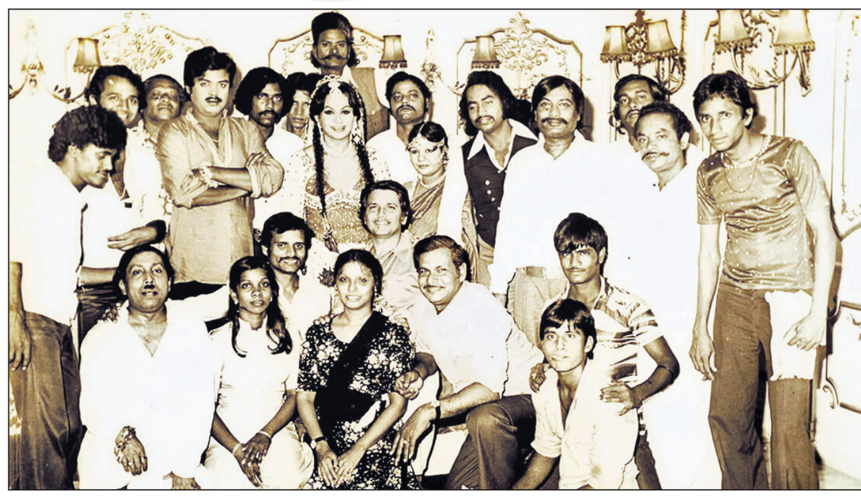
ଆକ୍ସିଡ଼େଣ୍ଟ ସହପୀଠୀଙ୍କ ସହ