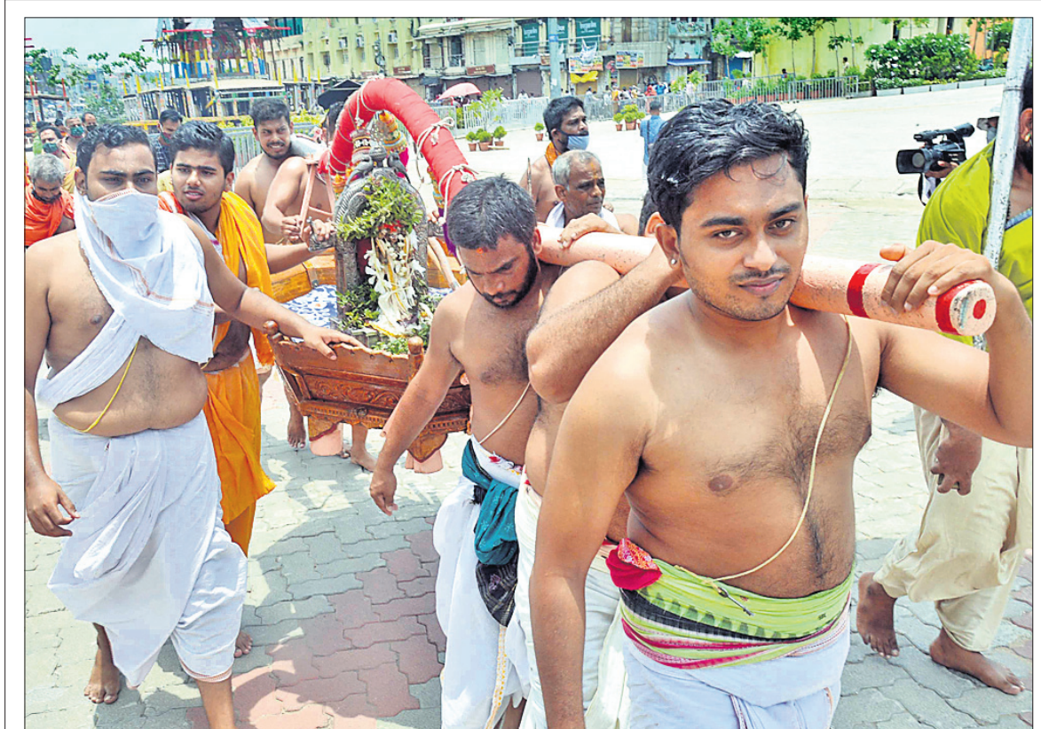
ଚିତାଲାଗି ଅପାବାସୀ ଅବସରରେ ସୋମବାର ପୁରୀ ଶ୍ରୀମନ୍ଦିରରୁ ଅପାବାସୀ ନାରାୟଣଙ୍କ ସାଗର ବିଜେ।