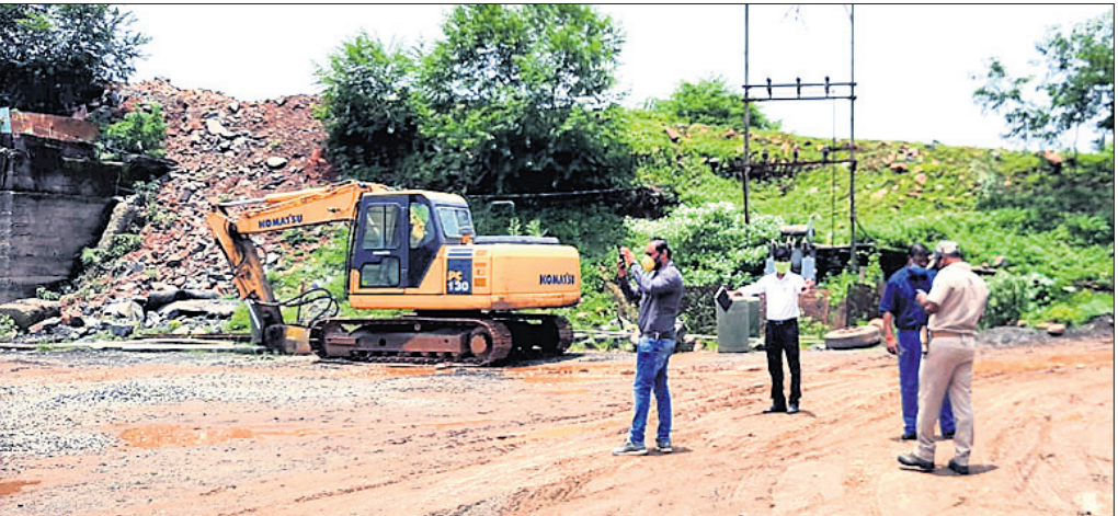
ତହସିଲଦାର ଶାରୀଖୁଆ ପାହାଡ଼ ସଂଳଗ୍ନ କ୍ରମେ ପରିଦର୍ଶନ କରୁଛନ୍ତି।