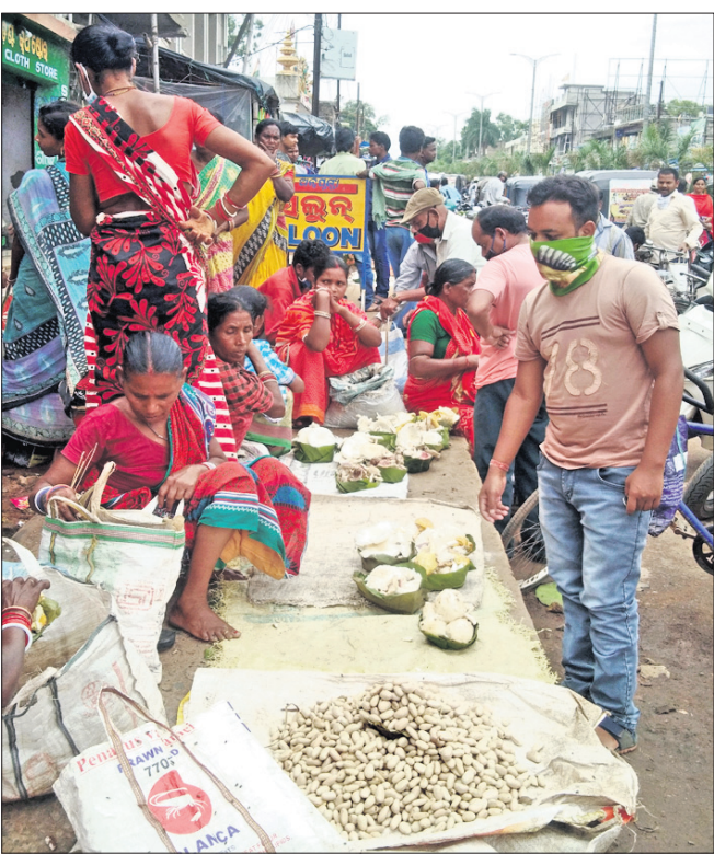
ବନବାସୀମାନେ ଜଙ୍ଗଲଜାତ ଦ୍ରବ୍ୟ ବିକ୍ରି କରୁଛନ୍ତି।

ଉଲ୍ଲେଖଯୋଗ୍ୟ ଯେ, କେନ୍ଦୁଝର ଜିଲ୍ଲାର ୧୩ଟି ବ୍ଲକ୍ ମଧ୍ୟରୁ ୧୦ଟି ବ୍ଲକ୍ ଆଦିବାସୀ ବହୁଳ। ବଣପାହାଡ଼ ଘେରା ଗ୍ରାମର ଅଧିବାସୀମାନେ ଜୀବନଜୀବିକା ପାଇଁ ବିଶେଷ କରି ଜଙ୍ଗଲ ଓ ପାହାଡ଼ ଉପରେ ନିର୍ଭରଶୀଳ। ବହୁ ଲୋକ