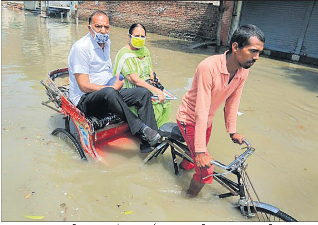
ପଞ୍ଜାବର ବଠିଆରେ ପ୍ରବଳ ବର୍ଷା ଯୋଗୁ ଜଳାଶୟନ ରାସ୍ତାରେ ଜଣେ ଚିକିତ୍ସାକର ଯାତ୍ରାକୁ ନେଉଛନ୍ତି।