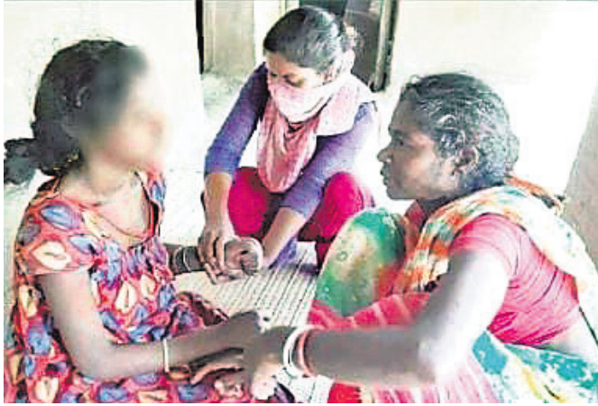
ଗୁଣିଆର ଶିକାର ହୋଇଥିବା ମହିଳା ।