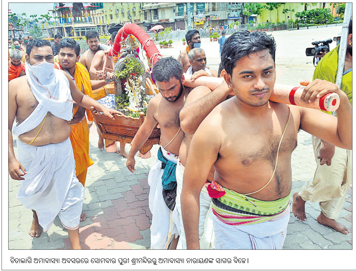
ଚିତ୍ରାଲୀ ଅପାବାସୀ ଅବସରରେ ସୋମବାର ପୁରୀ ଶ୍ରୀମନ୍ଦିରରୁ ଅପାବାସୀ ନାରାୟଣଙ୍କ ସାଗର ବିଜେ।