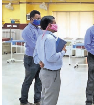
ଜିଲାପାଳ ଓଷାପଡ଼ାସ୍ଥିତ କୋଭିଡ୍ କେୟାର ସେଣ୍ଡର ଅନୁଧ୍ୟାନ କରୁଛନ୍ତି ।