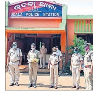
ହାବିଲଦାର କାରୁହରୀ ମାଝିଙ୍କୁ ସ୍ମାରଣ କରାଯାଇଛି।