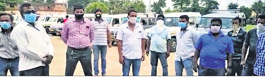
ଧାରଣାର କାର୍ ମାଲିକ ଓ କର୍ମଚାରୀମାନେ।

ବୁଦ୍ଧ କଳାମାଟିଆ ପଞ୍ଚାୟତ ପରିବର୍ତ୍ତେ ଯାକପୁର ବ୍ଲକ୍‌ର ମହେଶ୍ୱର ପଞ୍ଚାୟତ ବୋଲି ଉଲ୍ଲେଖ କରିଛନ୍ତି। ତେବେ ଅନୁଦାନ ଅର୍ଥ ହତୁପ କରାଯାଇ ମିଥ୍ୟା ବିଲ୍ ପ୍ରସ୍ତୁତ କରାଯାଇଛି ବୋଲି ଖୁବ୍ ସମସ୍ତଙ୍କୁ ସନ୍ତୋଷ ଦେଇଛି।