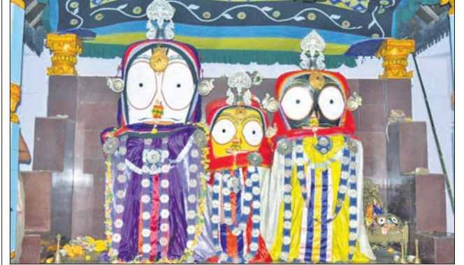
କେନ୍ଦ୍ରାପଡ଼ା ଅଫିସ୍, ୨୦୧୭

ଭୁବନେଶ୍ୱରୀ କ୍ଷେତ୍ରସ୍ୱାପତି ମହାପ୍ରଭୁ ସିଦ୍ଧ ବଳଦେବଜୀଉଙ୍କ ଚିତାଲାଗି ପର୍ବ ଯୋଗଦାନ ଅନୁଷ୍ଠିତ ହୋଇଯାଇଛି।