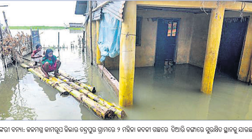
ଆସାମରେ ପ୍ରଜୟକରା ବନ୍ୟା: ଜଳମଗ୍ନ କାମରୁପ ଜିଲାର ତନ୍ତ୍ରପୁର ଗ୍ରାମରେ ୨ ମହିଳା କବନୀ ଗଛରେ ଡିଆରି ହୋଇ ସୁରକ୍ଷିତ ରହିଛନ୍ତି।

ନୂଆଦିଲ୍ଲୀ, ୨୧.୭ ମହାମାରୀ କରୋନା କବଳରେ ରାଜଧାନୀ ଦିଲ୍ଲୀ। ଏଠାର ୨୩.୪୮% ଲୋକ କରୋନା ଭୁଗୋଳ ଦ୍ୱାରା ଆକ୍ରାନ୍ତ। ଜନସଂଖ୍ୟା ଘନତ୍ୱ ଏଠାରେ ବେଶି ରହିଥିବାରୁ ଆକ୍ରାନ୍ତ ସଂଖ୍ୟା ବଢ଼ିବାରେ ଆଶଙ୍କା ରହିଛି ବୋଲି ଦିଲ୍ଲୀର ସେରୋ ପ୍ରିଭାଲେନ୍ସ ଷ୍ଟଡି ରିପୋର୍ଟରେ ଦର୍ଶାଯାଇଛି। ଜୁନ୍ ୨୭ରୁ ଜୁଲାଇ ୧୦ ମଧ୍ୟରେ ଏହାକୁ ପ୍ରତି ଦିନ ୧୫୦୦ରୁ ଅଧିକ କରୋନା ଆକ୍ରାନ୍ତ ହେବାରେ ଯୋଗଦାନ କରିଛି। ଏଥିରୁ