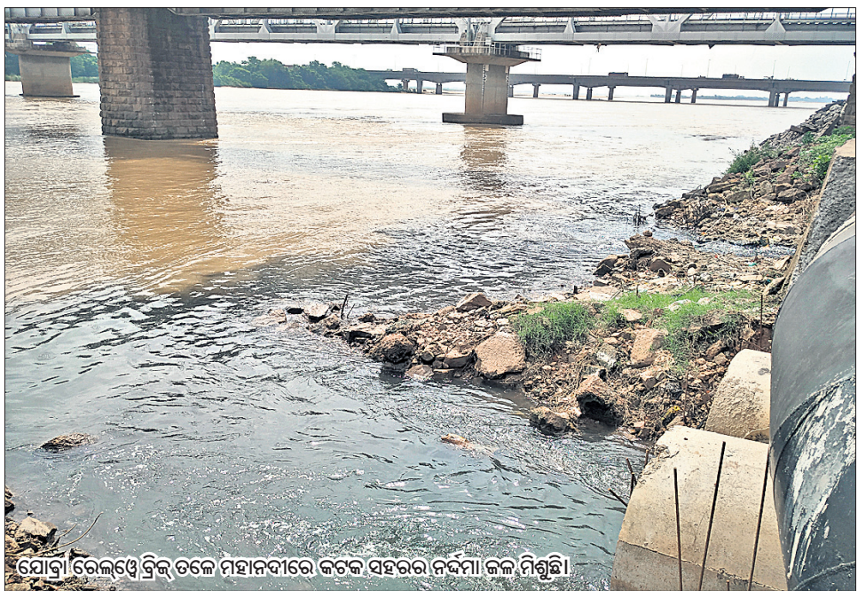
ସୋସିଆଲ ମିଡିଆରେ ସୁରୁତ୍ତିକ ଜଳପ୍ରାପ୍ତି ସୋସିଆଲ ମିଡିଆ ଲଭର। ନିକଟରେ ସେ ପୋଷ୍ଟ କରିଥିବା ଫଟୋକୁ ଫ୍ୟାନ୍‌ମାନେ ବେଶ୍ ଲାଭକ୍ ଏବଂ କମେଣ୍ଟ କରିଛନ୍ତି।