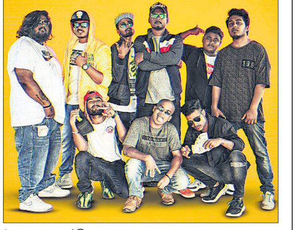
ଉତ୍କଳ ସାହିତ୍ୟ ଚଳ୍ଚର

ବଦଳୁଛି ଓଡ଼ିଶାର ରାସ୍ତା କଲ୍ଚର ବଦଳୁଛି ଓଡ଼ିଶାର ରାସ୍ତା କଲ୍ଚର ବଦଳୁଛି ଓଡ଼ିଶାର ରାସ୍ତା କଲ୍ଚର ବଦଳୁଛି ଓଡ଼ିଶାର ରାସ୍ତା କଲ୍ଚର