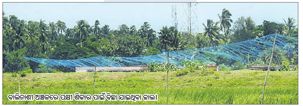
ବାଲିନାଶା ଅଞ୍ଚଳରେ ପକ୍ଷୀ ଶିକାର ପାଇଁ ବିଭାଗୀୟ ଯାଜୁଆ ଜାଲ।

ପକ୍ଷୀ ଶିକାରୀ ମଙ୍ଗଳାଯୋଡ଼ିରେ ମାତିଛନ୍ତି ପକ୍ଷୀ ଶିକାରୀ। ଫାଶ ଜାଲ ବ୍ୟବହାର ବ୍ୟତୀତ ଭାବେ ପକ୍ଷୀ ଶିକାର କରୁଛନ୍ତି। କରୋନା ବାହାନୁରେ ବନ ବିଭାଗର ପାଟ୍ରୋଲ୍ ଏକପ୍ରକାର ବନ୍ଦ ହୋଇଯାଇଥିବାରୁ ଏହା ଶିକାରୀଙ୍କ ପକ୍ଷୀ ଶିକାର କୁହାଯାଉଥିବା ଚିଲିକା ମଙ୍ଗଳାଯୋଡ଼ିରେ ମାତିଛନ୍ତି ପକ୍ଷୀ ଶିକାରୀ। ଫାଶ ଜାଲ ବ୍ୟବହାର ବ୍ୟତୀତ ଭାବେ ପକ୍ଷୀ ଶିକାର କରୁଛନ୍ତି। କରୋନା ବାହାନୁରେ ବନ ବିଭାଗର ପାଟ୍ରୋଲ୍ ଏକପ୍ରକାର ବନ୍ଦ ହୋଇଯାଇଥିବାରୁ ଏହା ଶିକାରୀଙ୍କ ■ ବ୍ୟବହୃତ ବସ୍ତୁ ଫାଶ, ମରୁଛନ୍ତି ଶିଖଣ୍ଡ ଚଢ଼େଇ ■ କର୍ତ୍ତୃପକ୍ଷଙ୍କ ପାଖରେ ସୂଚନା ନାହିଁ