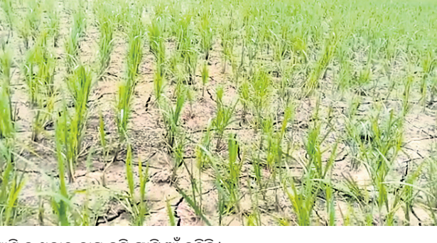
ପାଣି ନ ଥିବାରୁ ଚାଷ ଜମି ଫାଟି ଥାଁ କଲାଣି।