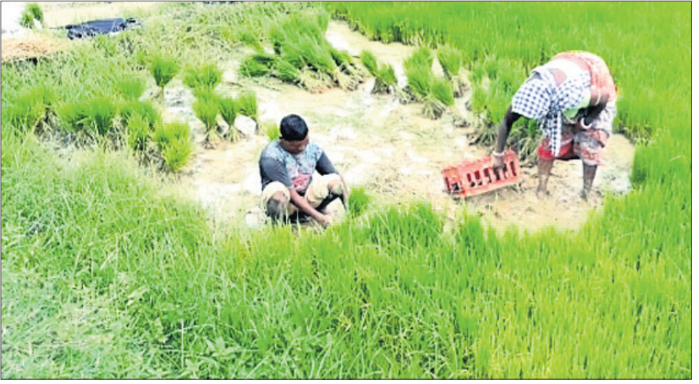
ବର୍ଷା ଆଭାବରୁ ବିଲରେ ପାଣି ଦେଇ ରୁଆ କରାଯାଇଛି।