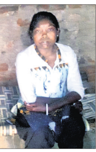
ଭିକ୍ଷମ ଭଉଣୀଭାଇ ବାଜରା ଓ ଗଣେଶ।