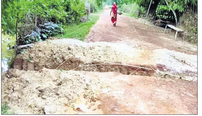
ରାସ୍ତାରେ ସୃଷ୍ଟି ହୋଇଥିବା ଘାଟ।

ରାସ୍ତାରେ ଗୋପନାଥଠାରେ ଜଣେ ଲୋକ ନିଜ ସ୍ୱାଧିନ ସାଧନ ଲାଗି ମଙ୍ଗଳବାର ପୂର୍ବାହ୍ନରେ ରାସ୍ତାକୁ ହାଣି ଦେଇଥିଲେ। ଫଳରେ ଏକ ଘାଟ ସୃଷ୍ଟି ହୋଇଥିଲା ପରେ ଯାତାଯାତ ସମ୍ପୂର୍ଣ୍ଣ ବାଧାପ୍ରାପ୍ତ ହୋଇଥିଲା। କୁରୁଣ୍ଡା ସେବା ସମବାୟ ସମିତିକୁ ବିହନ ସାର ଆଣିବା ଲାଗି ଚାଷୀମାନେ ଏହି ରାସ୍ତା ଏବଂ ହାଣି କରୁଥିବାରୁ ସଂଯୋଗ ବିଚ୍ଛିନ୍ନ ହେବା ପରେ ଚାଷୀମାନେ ଦୁର୍ଦ୍ଦଶାର ସମ୍ମୁଖୀନ ହେଉଛନ୍ତି।