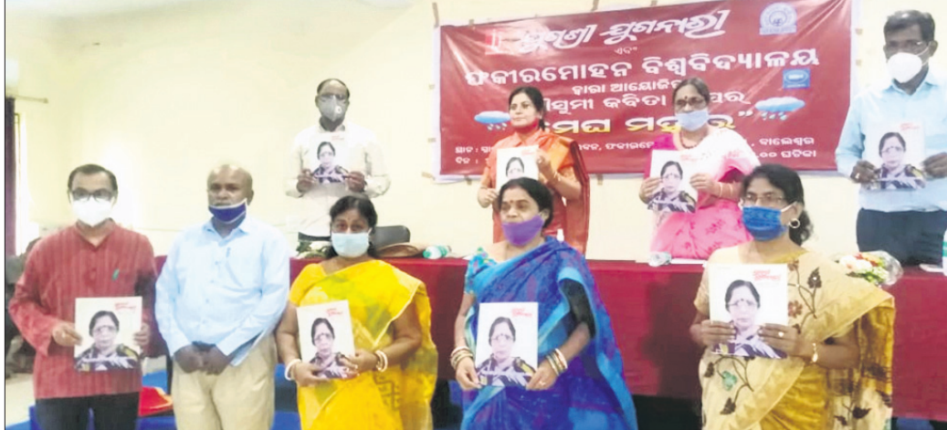
ଅତିଥିଙ୍କ ଦ୍ୱାରା ‘ଯୁଗଶ୍ରୀ ଯୁଗନାରୀ’ ପତ୍ରିକାର ଜୁଲାଇ ସଂସ୍କରଣ ଉନ୍ମୋଚିତ।