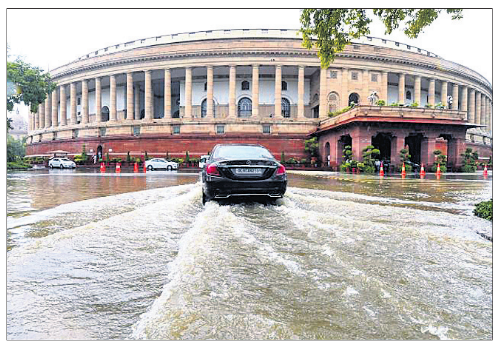
ବର୍ଷାରେ ଦିଲ୍ଲୀ ବେହାଲ: ରାଜ୍ୟ ସଭାର ନବ ନିର୍ବାଚିତ ସଭ୍ୟମାନେ ରୁସ୍ତବାର ଶପଥ ନେଉଥିବାବେଳେ ପାଲିମେଣ୍ଟ ସଭାରେ ପାଣି କମିରହିଛି।

ଭିମ୍ବସାର ଡାକ୍ତରଙ୍କ ପଦୋନ୍ନତିକୁ ନେଇ ବିବାଦ ଘଟିଛି।