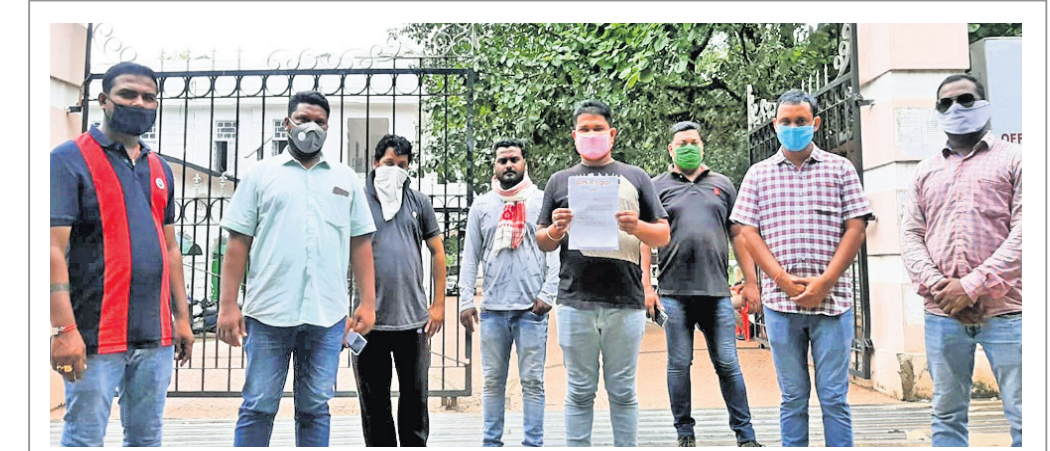
ଜିଲ୍ଲାପାଳଙ୍କୁ ଦାବିପତ୍ର ଦେବାକୁ ଆସିଥିବା ଭଞ୍ଜାସେନାର କର୍ମକର୍ତ୍ତା।