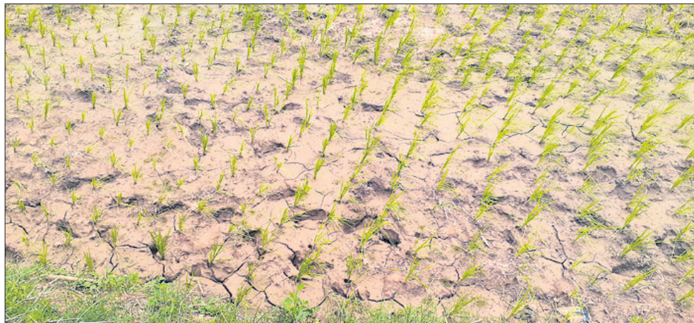
ବର୍ଷା ଅଭାବରୁ ବୁଦ୍ଧମାନଙ୍କ ଗ୍ରାମର ଏକ ଚାଷ ଜମି ଫାଟି ଯାଇଛି।

ଶ୍ରାବଣ ମାସ ସରିବାକୁ ବସିଥିବା ବେଳେ ବର୍ଷାର ଦେଖା ନାହିଁ। ପ୍ରତିଦିନ ବର୍ଷା ଉଠାଇଛି ହେଲେ ବର୍ଷୁ ନାହିଁ। ସ୍ୱଳ୍ପ ବର୍ଷା ଯୋଗୁ ମୟୂରଭଞ୍ଜ ଜିଲ୍ଲାର ଅଧିକାଂଶ ବୁଦ୍ଧରେ ଚାଷ କାର୍ଯ୍ୟ ଆଗେଇ ପାରୁନି। ବାରିପଦା ବୁଦ୍ଧ ବୁଦ୍ଧମାନଙ୍କ ଗ୍ରାମର ଅଧିକାଂଶ ଜମି ବର୍ଷା ଅଭାବରୁ ଫାଟି ଥିବା କିରୋସିନ ଫିଲ୍ଡରେ ଲିଲାଇ ମାସର ବର୍ଷାମାନ ସୁଦ୍ଧା ୨୬ଟି ବୁଦ୍ଧରେ ୩୭୪୮.୨ ମି.ମି. ବର୍ଷା ହୋଇଛି। ଶ୍ୟାମାଖୁଣ୍ଟରେ ୧୩୫ ମି.ମି., ବଡ଼ସାହି ୧୭୪ ମି.ମି., ବେତନଗୀ ୧୯୭ ମି.ମି., ମୋଡ଼ାଡ଼ା ୧୯୧ ମି.ମି., ରାସବୋରିପୁର ୧୪୭.୨୦ ମି.ମି., କୁଳିଆଖା ୨୦୨.୨୦ ମି.ମି., ସାରସକଣା ୨୪୩.୪୦ ମି.ମି., ଶୁଳିଆପଦା ୧୫୦.୯୦ ମି.ମି., ବାଜିରିପୋଖି ୧୧୭.୨୦ ମି.ମି., ବାରିପଦାରେ ୧୫୮ ମି.ମି., ଖୁଣ୍ଟା ୧୪୦.୭୦ ମି.ମି., ଗୋପବନ୍ଧୁନଗର ୧୪୦.୭୦ ମି.ମି., ଉଦଳା ୮୦.୮୦ ମି.ମି., କପ୍ପିପଦା ୧୫୬ ମି.ମି., ବିଶୋଇ ୨୦୨ ମି.ମି., ବିଜଳା ୧୪୦ ମି.ମି., ରାଇରଙ୍ଗପୁର ୨୧୮ ମି.ମି., କୁସୁମି ୩୬ ମି.ମି., କାମଦା ୧୪୨ ୫୪୫୨.୩୪ ମି.ମି. ବର୍ଷା ହୋଇଥିଲା। ମି.ମି., ବହଳଦା ୨୧୨ ମି.ମି., ତିରି