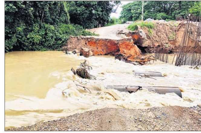
ଧୋଇ ଯାଇଥିବା ଅସ୍ଥାୟୀ ପୋଲ ।