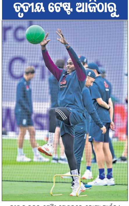
ଇଲ୍ ଲଣ୍ଡ ଦଳର ଟ୍ରେନିଂ ସେଶନରେ କୋପ୍ରା ଆର୍ଚର।

ମାଷ୍ଟେସ୍‌ର, ୨୩।୭ ଇଲ୍ ଲଣ୍ଡ ଓ ଫ୍ରେସ୍‌କଲିକ୍ ମଧ୍ୟରେ ତୃତୀୟ କ୍ରିକେଟ ଟେଷ୍ଟ ଶୁକ୍ରବାରଠାରୁ ଏଠାରେ ଆରମ୍ଭ ହେବାକୁ ଯାଉଛି। ୩ ମ୍ୟାଚ ବିଶିଷ୍ଟ ସିରିଜ ଏବେ ୧-୧ ଭିତ୍ତିରେ ରହିଛି। ପ୍ରଥମ ଟେଷ୍ଟକୁ ଫ୍ରେସ୍‌କଲିକ୍ ଜିତି ଥିବାବେଳେ ଦ୍ୱିତୀୟ ଟେଷ୍ଟରେ ବିଜୟୀ ହୋଇ ଇଲ୍ ଲଣ୍ଡ ସଫଳ ପ୍ରତ୍ୟାବର୍ତ୍ତନ କରିଛି। ତେଣୁ ସିରିଜ ବିଜୟ ପାଇଁ ତୃତୀୟ ଟେଷ୍ଟ ଉପରେ ସ୍ୱାଭାବିକଭାବେ ଉତ୍ତର ଦଳର ନଜର କେନ୍ଦ୍ରୀଭୂତ ହୋଇଛି। କରୋନା ସଂକ୍ରମଣ ପରେ ଅତ୍ୟନ୍ତ ଉଚ୍ଚ ଗ୍ରହଣରେ ଏହା ପ୍ରଥମ ସିରିଜ। ତେଣୁ ଯେଉଁ ଦଳ ବିଜୟୀ ହେଉ ନା କାହିଁକି ନିଶ୍ଚିତ ସ୍ଥରଣୀୟ ରହିବ। ୧୯୮୮ରେ ଇଲ୍ ଲଣ୍ଡ ମାଟିରେ ଟେଷ୍ଟ ସିରିଜ ବିଜୟୀ ହେବାପାଇଁ ଫ୍ରେସ୍‌କଲିକ୍ ନିଜଜୀବନ ସୁଯୋଗ ରହିଛି। ଅନ୍ୟପକ୍ଷରେ ଘରୋଇ ପରିବେଶରେ ୬ ବର୍ଷର ଅପରାଜେୟ ରେକର୍ଡକୁ ଅପରିବର୍ତ୍ତନ ରଖିବା ସହ ଫ୍ରେସ୍‌କଲିକ୍ ଟ୍ରଫି ବଜାୟ ରଖିବା ଆଶାରେ ରହିଛି ଇଲ୍ ଲଣ୍ଡ। ଦ୍ୱିତୀୟ ଟେଷ୍ଟ ଖେଳାଯାଇଥିବା ମାଷ୍ଟେସ୍‌ର ଓ ଓଲ୍ ଗ୍ରାଫୋର୍ଡ ଗ୍ରାଉଣ୍ଡରେ ହିଁ ତୃତୀୟ ଟେଷ୍ଟ ଅନୁଷ୍ଠିତ ହେବ। କମ୍ ଦିନ ମଧ୍ୟରେ ୨ଟି ଅତ୍ୟନ୍ତ ଉଚ୍ଚ ଗ୍ରହଣ ପିଠି ପ୍ରସ୍ତୁତ କରିବା ଗ୍ରାଉଣ୍ଡ ସ୍ୱାପ୍‌କ ପାଇଁ ବଡ଼ ବ୍ୟାଲେଞ୍ଜ ରହିଥିଲା। ଦ୍ୱିତୀୟ ଟେଷ୍ଟ ପିଠି ପ୍ରଶଂସନୀୟ ଥିଲା। ଏହା ଉତ୍ତର ବୋଲର ଓ ବ୍ୟାଟ୍‌ମ୍ୟାନଙ୍କୁ ସହାୟତା କରିଥିଲା। ଦ୍ୱିତୀୟ ପିଠି ମଧ୍ୟ ସ୍କୋର୍ ରହିବା ଆଶା କରାଯାଇଛି। ଦ୍ରୁତ ବୋଲରଙ୍କ ଫର୍ମକୁ ଦୃଷ୍ଟିରେ ରଖି ପିଠି ଅଧିକ ଫାଷ୍ଟ ରହିବା ନେଇ ଇଲ୍ ଲଣ୍ଡ ମ୍ୟାନେଜମେଣ୍ଟ ଆଶା ରଖିଛି। ତୃତୀୟ ଟେଷ୍ଟରେ ମଧ୍ୟ ବର୍ଷା ପ୍ରତିବନ୍ଧକ ସାଜିପାରେ ବୋଲି ପୂର୍ବାନୁମାନ ରହିଛି। କୋଭିଡ-୧୯ ପ୍ରୋଟୋକଲ ଭାଙ୍ଗିବା ଯୋଗୁ ଦ୍ୱିତୀୟ ଟେଷ୍ଟରେ ଖେଳିପାରି ନ ଥିବା କୋପ୍ରା ଆର୍ଚର ୧୪ ଜଣିଆ ଦଳରେ ଘ୍ରାନ ପାଇଛନ୍ତି। ତେଣୁ ଚାକ୍