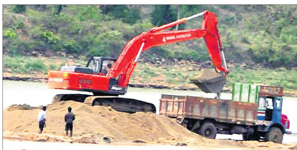
କେସିବି ସାହାଯ୍ୟରେ ବାଲି ଲୋଡ଼ କରାଯାଉଛି ।

ଧର୍ମକୁ ଆଖିରେ ସଦୃଶ । ଭଦ୍ରକ ଜିଲ୍ଲାର ଭଞ୍ଜପୋଖରୀ, ଧାମନଗର ଓ ଚାନ୍ଦବାଲି ବ୍ଲକ୍‌ରେ କିଛି ପଞ୍ଚାୟତ ଏହି ନଦୀ ଅବବାହିକାରେ ଅବସ୍ଥିତ । ପ୍ରତ୍ୟେକବର୍ଷ ବୈତରଣୀରେ ବନ୍ୟା ଆସିଲେ ମୁଖ୍ୟତଃ ଏହି ଗର୍ଭକୁ ବିଶେଷ ଭାବେ ସ୍ପଷ୍ଟ ହୋଇଥାଏ । ଏବେ ଏହି ନଦୀପଠା ବାଲି ମାଫିଆମାନଙ୍କ ପାଇଁ ଚରାଭୂଇଁ ପାଲଟିଛି । ମୁଖ୍ୟତଃ ଭଞ୍ଜପୋଖରୀ ବ୍ଲକ୍‌ର ଆଖୁଆପଦାଠାରୁ ଧାମନଗର ବ୍ଲକ୍‌ର ଦିହୁଡ଼ି ଆନନ୍ଦପୁର ପର୍ଯ୍ୟନ୍ତ ବୈତରଣୀ ନଦୀପଠାରୁ ବେଧଧକ ଭାବେ ବେଆଇନ ବାଲି ଖୋଳା ଚାଲିଛି । ପ୍ରଶାସନ ଏଥିପ୍ରତି କଠୋର ଆଭିମୁଖ୍ୟ ଘୋଷଣା କରିବା ପରିବର୍ତ୍ତେ ଲୋକ ଦେଖାଣିଆ ଚକ୍ରାନ୍ତ କରୁଛି । ମାଫିଆମାନେ ରାତି ଅଧରେ ପଠାରେ ଗାଡ଼ି ଲଗାଇ ଚଳି ଚଳି ବାଲି ଉଠାଇ ନେଉଛନ୍ତି । ଏପରିକି ନଦୀପଠାରେ