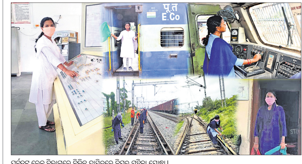
ପୂର୍ବତ ରେଳ ବିଭାଗରେ ବିଭିନ୍ନ ଦାୟିତ୍ୱରେ ନିଯୁକ୍ତ ମହିଳା ଯୋଦ୍ଧା।

କଟକ ଅଫିସ, ୨୩।୭: ଏସ୍‌ସିବିରେ ଗୁରୁବାର ସର୍ବାଧିକ ୧୯ ପଞ୍ଜିକିତ ଚିକିତ୍ସା ହୋଇଛି। ସେମାନଙ୍କ ମଧ୍ୟରେ ଜଣେ ତାଳୁରା ଛାତ୍ର ଓ ଆଉ ଜଣେ ପିଠି ଛାତ୍ରଙ୍କ ବାପା ରହିଛନ୍ତି ଯିଏ କି ଇଏନ୍‌ଟି ବିଭାଗରେ ଡିଜିଟାଲ ରହିଛନ୍ତି। ସେହିପରି ଆଇସୋଲେଶନ ଖାର୍ଡରେ ୧୦ ଏବଂ କାନ୍ଥୁଆଳିରେ ଜଣେ ରୋଗୀଙ୍କ ରିପୋର୍ଟ ପଞ୍ଜିକିତ ଆସିଛି। କାନ୍ଥୁଆଳିରେ ଜଣେ ସଜିଗୁଙ୍କୁ ଆଇସୋଲେଶନ ଖାର୍ଡକୁ ପଠାଯାଇଛି। ସୁପରସେଣ୍ଟିଆଲିଟି ଆରଟୋର ନେପ୍ଟୋଲୋଜି ବିଭାଗ ପାଇଁ ସ୍କିନି କରାଯିବାରୁ ସେଠାରୁ ୩ ଆକ୍ରାନ୍ତ ଚିକିତ୍ସା ହୋଇଛି। ସବୁଠୁ ଗୁରୁତ୍ୱପୂର୍ଣ୍ଣ ବିଷୟ ହେଲା, ନରସିଂହପୁର ଥାନା ଅଞ୍ଚଳରୁ ଜଣେ ଅପରାଧୀଙ୍କୁ ୧୫ ଦିନ ପୂର୍ବେ ନେପ୍ଟୋଲୋଜି ବିଭାଗରେ ଭର୍ତ୍ତି କରାଯାଇ ତାଏଲିସିସ କରାଯାଉଥିଲା। ତାଙ୍କୁ ଭେଟିବାକୁ ଆସିଥିବା ସମ୍ପର୍କୀୟମାନଙ୍କ ଆସିବେଳେ ଚେଷ୍ଟା କରାଯାଉଥିଲା। ୨ଜଣଙ୍କ ରିପୋର୍ଟ ପଞ୍ଜିକିତ ମିଳିଛି। ତାଙ୍କୁ ଜଗୁଥିବା ପୋଲିସ କର୍ମଚାରୀଙ୍କ ଚେଷ୍ଟା ରିପୋର୍ଟ ନେଗେଟିଭ ଆସିଛି। ଆରାଜ୍ୟ ହରିହର ସ୍ମାରକୋତ୍ତର କର୍ବଟ ରୋଗ ପ୍ରତିଷ୍ଠାନରେ ୪୧ ଜଣଙ୍କ ଆସିବେଳେ ଚେଷ୍ଟା କରାଯାଉଥିଲା। ସମସ୍ତଙ୍କ ରିପୋର୍ଟ ନେଗେଟିଭ ଆସିଛି।