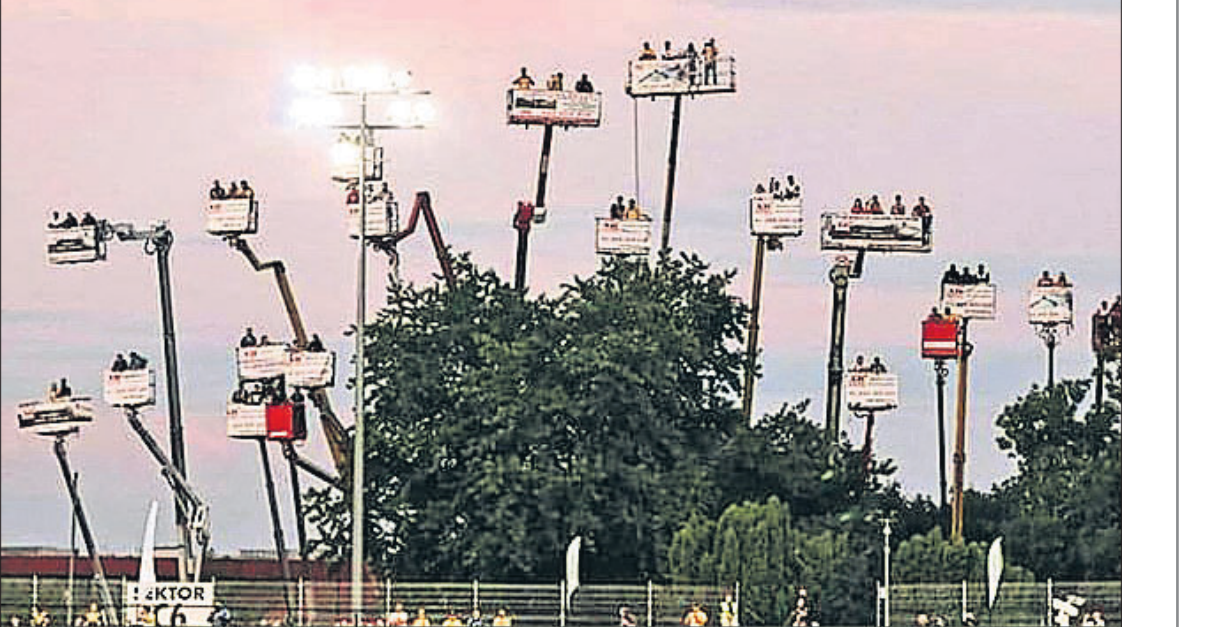
କ୍ରେନ୍ ଉପରେ ବସି ରେସ୍ ଦେଖିବାକୁ ଆସିଥିବା ଲୋକମାନେ

୨୫ ପ୍ରତିଶତ ସିଟ୍ ବୁକ୍ କରାଯାଇଥିଲା। କିନ୍ତୁ ରେସ୍ ପ୍ରଶଂସକମାନେ ମ୍ୟାଚ୍ ଦେଖିବା ପାଇଁ କ୍ରେନ୍ର ସାହାଯ୍ୟ ନେଇଥିଲେ। ରେସ୍ ଦେଖିବା ପାଇଁ ଷ୍ଟାଡ଼ିୟମ ବାହାରେ ୨୧ଟି କ୍ରେନ୍ରେ ଲୋକେ ଆସିଥିଲେ। ଲୋକମାନେ କ୍ରେନ୍ ଭଡ଼ାରେ ନେଇ ଏହି ରେସ୍ ଦେଖିବାକୁ ଆସିଥିଲେ। ଏହି ସମୟରେ ସେମାନେ ସାମାଜିକ ଦୂରତାକୁ ବି ପାଳନ କରିଥିଲେ। ସବୁ କ୍ରେନ୍ରେ ପ୍ରଥମେ ଲୋକେ ବସିଥିଲେ ଓ ପରେ କ୍ରେନ୍କୁ ଉପରକୁ ଉଠାଇ ଷ୍ଟାଡ଼ିୟମ ଉପରେ ରଖାଯାଇଥିଲା। ତେଣୁ ରେସ୍ ଶେଷ ପର୍ଯ୍ୟନ୍ତ ଲୋକେ କ୍ରେନ୍ରେ ବସି ଖେଳର ମଜା ନେଇ ପାରିଥିଲେ। ଷ୍ଟାଡ଼ିୟମର ଚାରିକଡ଼ରେ କ୍ରେନ୍ରୁଡିକ ଛିଡ଼ାହୋଇ ଏକ ଭିନ୍ନ ଦୃଶ୍ୟ ସୃଷ୍ଟି କରିଥିଲା। ଆଉ ଏଥିରେ ବସିଲୋକେ ୬୫ ଫୁଟ ଉପରେ ରହି ରେସ୍ର ମଜା ନେଇଥିଲେ। ସବୁଠୁ ବଡ଼ କଥା ହେଉଛି ରେସ୍ ଶେଷ ହେବା ପରେ କ୍ରେନ୍ ଉପରେ ଥିବା ପ୍ରଶଂସକମାନେ ଆତସବାଜି ମଧ୍ୟ ପୁଟାଇଥିଲେ, ଯାହା ଦେଖିବା ପାଇଁ ଏକ ଭିନ୍ନ ପରିବେଶ ସୃଷ୍ଟି କରିଥିଲା।