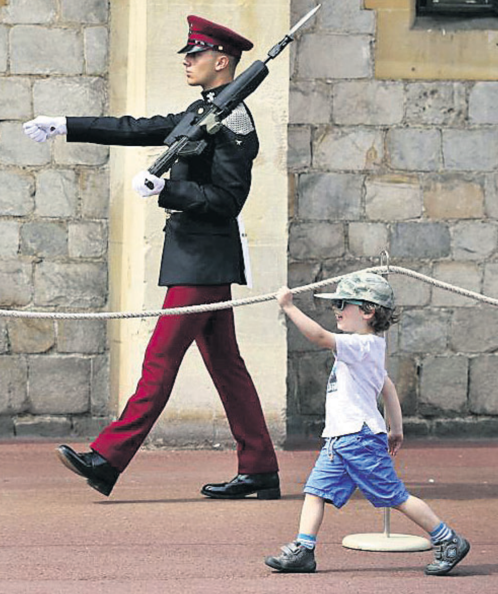
କରୋନା ଲକ୍ଷ୍ମୀର ଯୋଗୁଁ ବନ୍ଦ ଥିବା କ୍ରିଡ଼େନସ୍ ଡିଭିଜନର କ୍ୟାଣ୍ଟିନ୍ ଗୁରୁତାର ସର୍ବସାଧାରଣଙ୍କ ପାଇଁ ଖୋଲିଛି । ଏହି ଅବସରରେ ମହାରାଜା ଏଲିଜାବେଥ ଦ୍ଵିତୀୟଙ୍କ ରୟାଲ ଫୁସ୍ ସର୍ବିସ ଗଣେ ଗାର୍ଡ ମାର୍ଚ୍ଚ କରୁଥିବାବେଳେ ଜଣେ ପୁଅଟି ନିଜର ଚାକ୍ଵା ଅନୁକରଣ କରୁଛନ୍ତି ।

ଅସନ୍ତୁଷ୍ଟ ବିଧାୟକଙ୍କ ସ୍ଵରକୁ ଚପାଇ ଦିଆଯାଇପାରିବ ନାହିଁ କି ଗଣତନ୍ତ୍ର ପଥରୋଧ କରାଯାଇପାରିବ ନାହିଁ: ସୁପ୍ରିମକୋର୍ଟ