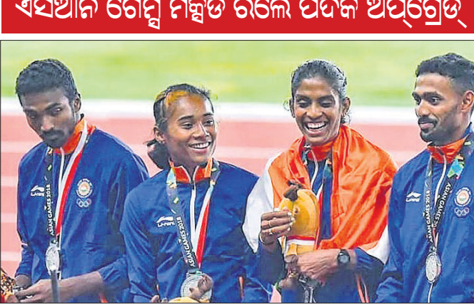
ରୌପ୍ୟ ପଦକ ବିଜୟୀ ଭାରତୀୟ ମିକ୍ସଡ ରିଲେ ରେସ୍ ଦଳ।