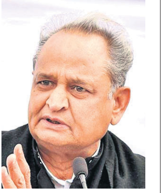
ଗେହଲଟ କହିଛନ୍ତି । ବିଦ୍ରୋହୀ ବିଧାୟକଙ୍କୁ ପଶିବନା ରଖାଯାଇଛି । ସେମାନେ ଯେତେବେଳେ ଫେରିବେ ଆମକୁ ଭୋଟ ଦେବେ ବୋଲି ଆଶା କରାଯାଉଥିବା ମୁଖ୍ୟମନ୍ତ୍ରୀ କହିଛନ୍ତି ।

ଜୟପୁର, ୨୩ତା(ଆଇଏଏନଏ) ବହିଷ୍କୃତ ଉପମୁଖ୍ୟମନ୍ତ୍ରୀ ସଚିନ ପାଲଟୁ ଓ ତାଙ୍କ ଅନୁଗତ ବିଧାୟକମାନଙ୍କ ବିଦ୍ରୋହ ଯୋଗୁଁ ରାଜସ୍ଥାନରେ ରାଜନୈତିକ ସଙ୍କଟ ଜାରି ରହିଥିବାବେଳେ ସରକାରଙ୍କ ପାଖରେ ପୂର୍ଣ୍ଣ ସଂଖ୍ୟାଗରିଷ୍ଠତା ରହିଥିବା ମୁଖ୍ୟମନ୍ତ୍ରୀ ଅଶୋକ ଗେହଲଟ ଗୁରୁତାର ଦାବି କରିଛନ୍ତି । ଖୁବ୍‌ଶୀଘ୍ର ବିଧାନସଭା ଅଧିବେଶନ ଡାକି ସଂଖ୍ୟାଗରିଷ୍ଠତାର ପ୍ରମାଣ ଦେବେ ବୋଲି ସେ ଗଣମାଧ୍ୟମକୁ କହିଛନ୍ତି । ପରେ ସେ ରାଜ୍ୟପାଳ କଲରାଜ ମିଶ୍ରଙ୍କୁ ଭେଟି ବିଧାନସଭା ଅଧିବେଶନ ସମ୍ପର୍କରେ ଆଲୋଚନା କରିଛନ୍ତି । ଯେଉଁମାନେ ଅବାଲତ ଯାଇଛନ୍ତି ସେମାନେ ଭୁଲ୍ କରିଛନ୍ତି ।