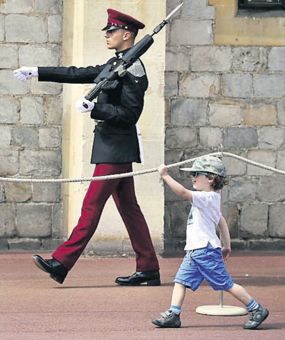
କରୋନା ଲକ୍ଷ୍ମୀଭଙ୍ଗ ଯୋଗୁ ବନ୍ଦ ଥିବା ବ୍ରିଟିଶ୍ ସ୍ମୃତି ସ୍ତମ୍ଭରୁ କ୍ୟାଣ୍ଟିନରୁ ସର୍ବସାଧାରଣଙ୍କ ପାଇଁ ଖୋଲିଛି । ଏହି ଅବସରରେ ମହାରାଜା ଏଲିଜାବେଥ ଦ୍ଵିତୀୟଙ୍କ ରୟାଲ ଫୁସ୍ ସର୍ବିସ ଜଣେ ଗାର୍ଡ ମାର୍ଚ୍ଚ କରୁଥିବାବେଳେ ଜଣେ ପୁଅ ନିର୍ଦ୍ଦେଶ ଦେଇ ତାଙ୍କୁ ଅନୁକରଣ କରୁଛନ୍ତି ।

ଅସନ୍ତୁଷ୍ଟ ବିଧାୟକଙ୍କ ସ୍ଵରକୁ ଚପାଇ ଦିଆଯାଇପାରିବ ନାହିଁ କି ଗଣତନ୍ତ୍ର ପଥରୋଧ କରାଯାଇପାରିବ ନାହିଁ: ସୁପ୍ରିମକୋର୍ଟ