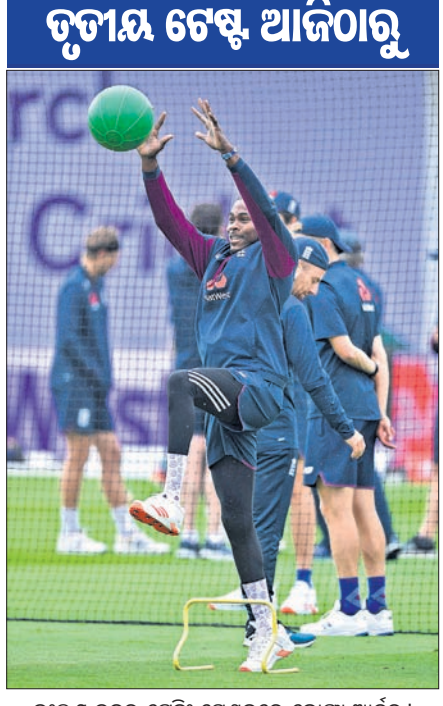
ଇଲ୍‌ସ୍ ଦଳର ଟ୍ରେନିଂ ସେଶନରେ କୋପ୍ରା ଆର୍ଚର।

ମାଣ୍ଡେସ୍ଟର, ୨୩।୭ ଇଲ୍‌ସ୍ ଓ ଫ୍ରେସ୍‌କଣ୍ଡିକ ମଧ୍ୟରେ ତୃତୀୟ କ୍ରିକେଟ ଟେଷ୍ଟ ଶୁକ୍ରବାରଠାରୁ ଏଠାରେ ଆରମ୍ଭ ହେବାକୁ ଯାଉଛି। ୩ ମ୍ୟାଚ ବିଶିଷ୍ଟ ସିରିଜ ଏବେ ୧-୧ ଭିତ୍ତିରେ ରହିଛି। ପ୍ରଥମ ଟେଷ୍ଟକୁ ଫ୍ରେସ୍‌କଣ୍ଡିକ ଜିତି ଥିବାବେଳେ ଦ୍ୱିତୀୟ ଟେଷ୍ଟରେ ବିଜୟୀ ହୋଇ ଇଲ୍‌ସ୍ ସଫଳ ପ୍ରତ୍ୟାବର୍ତ୍ତନ କରିଛି। ତେଣୁ ସିରିଜ ବିଜୟ ପାଇଁ ତୃତୀୟ ଟେଷ୍ଟ ଉପରେ ସ୍ୱାଭାବିକଭାବେ ଉତ୍ତର ଦଳର ନଜର କେନ୍ଦ୍ରୀଭୂତ ହୋଇଛି। କରୋନା ସଂକ୍ରମଣ ପରେ ଅତ୍ୟନ୍ତ ଉଚ୍ଚ ଗ୍ରହଣ ହେଉଥିବା ପ୍ରଥମ ସିରିଜ। ତେଣୁ ଯେଉଁ ଦଳ ବିଜୟୀ ହେଉ ନା କାହିଁକି ନିଶ୍ଚିତ ସ୍ଥରଣୀୟ ରହିବ। ୧୯୮୮ରେ ଇଲ୍‌ସ୍ ମାଟିରେ ଟେଷ୍ଟ ସିରିଜ ବିଜୟୀ ହେବାପାଇଁ ଫ୍ରେସ୍‌କଣ୍ଡିକ ନିଜଜୀବନ ସୁଯୋଗ ରହିଛି। ଅନ୍ୟପକ୍ଷରେ ଘରୋଇ ପରିବେଶରେ ୬ ବର୍ଷର ଅପରାଜେୟ ରେକର୍ଡକୁ ଅପରିବର୍ତ୍ତନ ରଖିବା ସହ ଫିକ୍‌ଡେନ ଟ୍ରଫି ବଜାୟ ରଖିବା ଆଶାରେ ରହିଛି ଇଲ୍‌ସ୍। ଦ୍ୱିତୀୟ ଟେଷ୍ଟ ଖେଳାଯାଇଥିବା ମାଣ୍ଡେସ୍ଟରର ଓଲ୍ଡ ଟ୍ରାଫୋର୍ଡ ଗ୍ରାଉଣ୍ଡରେ ହିଁ ତୃତୀୟ ଟେଷ୍ଟ ଅନୁଷ୍ଠିତ ହେବ। କମ୍ ଦିନ ମଧ୍ୟରେ ୨ଟି ଅତ୍ୟନ୍ତ ଉଚ୍ଚ ଗ୍ରହଣ ପିଠି ପ୍ରସ୍ତୁତ କରିବା ଗ୍ରାଉଣ୍ଡ ସ୍ୱାପ୍‌କ ପାଇଁ ବଡ଼ ବ୍ୟାଲେଞ୍ଜ ରହିଥିଲା। ଦ୍ୱିତୀୟ ଟେଷ୍ଟ ପିଠି ପ୍ରଶଂସନୀୟ ଥିଲା। ଏହା ଉତ୍ତର ବୋଲର ଓ ବ୍ୟାଟ୍‌ମ୍ୟାନଙ୍କୁ ସହାୟତା କରିଥିଲା। ଦ୍ୱିତୀୟ ପିଠି ମଧ୍ୟ ସ୍କୋଟ୍ ରହିବା ଆଶା କରାଯାଉଛି। ଦ୍ରୁତ ବୋଲରଙ୍କ ଫର୍ମକୁ ଦୃଷ୍ଟିରେ ରଖି ପିଠି ଫାଷ୍ଟ ରହିବା ନେଇ ଇଲ୍‌ସ୍ ମ୍ୟାନେଜମେଣ୍ଟ ଆଶା ରଖିଛି। ତୃତୀୟ ଟେଷ୍ଟରେ ମଧ୍ୟ ବର୍ଷା ପ୍ରତିବନ୍ଧକ ସାଜିପାରେ ବୋଲି ପୂର୍ବାନୁମାନ ରହିଛି। କୋଭିଡ-୧୯ ପ୍ରୋଟୋକଲ ଭାଙ୍ଗିବା ଯୋଗୁ ଦ୍ୱିତୀୟ ଟେଷ୍ଟରେ ଖେଳିପାରି ନ ଥିବା କୋପ୍ରା ଆର୍ଚର ୧୪ ଜଣିଆ ଦଳରେ ଘ୍ରାନ ପାଇଛନ୍ତି। ତେଣୁ ଚାକ୍