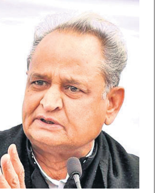
ଗେହଲଟ କହିଛନ୍ତି । ବିଦ୍ରୋହୀ ବିଧାୟକଙ୍କୁ ପଶିବନା ରଖାଯାଇଛି । ସେମାନେ ଯେତେବେଳେ ଫେରିବେ ଆମକୁ ଭୋଟ ଦେବେ ବୋଲି ଆଶା କରାଯାଉଥିବା ମୁଖ୍ୟମନ୍ତ୍ରୀ କହିଛନ୍ତି ।