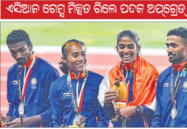
ରୌପ୍ୟ ପଦକ ବିଜୟୀ ଭାରତୀୟ ମିକ୍ସଡ଼ ରିଲେ ରେସ୍ ଦଳ।