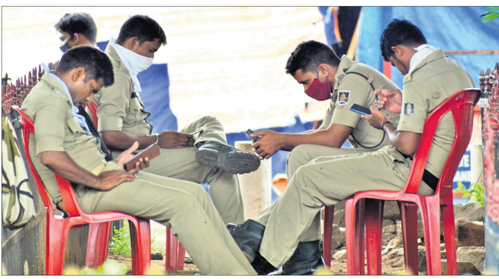
ଲକ୍ଷଣରୁ ଲୁଚି ରାହିଥିବାବେଳେ ଭୁବନେଶ୍ୱର ବାଣୀବିହାର ଛକରେ ନିୟୋଜିତ ପୋଲିସ୍ କର୍ମଚାରୀ ମୋବାଇଲ୍ ଦେଖିବାରେ ବ୍ୟସ୍ତ।

ସବୁରୁ ବଡ଼ କଥା ହେଲା ବର୍ତ୍ତମାନ ଯାଏ ଚିକିତ୍ସିତ ପରିଚିତ୍ସ୍ୱ ମଧ୍ୟରୁ ୭୦% ଆକ୍ରାନ୍ତଙ୍କ ଦେହରେ ଲକ୍ଷଣ ଦେଖାଯାଇନାହିଁ। ବର୍ତ୍ତମାନ ସ୍ଥିତିରେ ଯେଉଁମାନଙ୍କ ଘରେ ସଜରୋଧ ରହି ଚିକିତ୍ସିତ ହେବାର ସମସ୍ତ ସୁବିଧା ଅଛି ସେମାନେ ଘରେ ରହି ଚିକିତ୍ସିତ ହେଲେ ୧୦ଦିନ ମଧ୍ୟରେ ଆରୋଗ୍ୟ ହୋଇଯିବେ ବୋଲି ସେ କହିଛନ୍ତି। ଭୁବନେଶ୍ୱରରେ ପାଖାପାଖି ୧୦୩୯୫ ଲକ୍ଷଣ ବିହୀନ ଆକ୍ରାନ୍ତ ନିଜ ଘରେ ରହି ଚିକିତ୍ସିତ ହେଉଛନ୍ତି। ରାଜ୍ୟ ସରକାର ଏହି ବ୍ୟବସ୍ଥାକୁ କେବଳ ସହରାଞ୍ଚଳରେ ଲାଗୁ