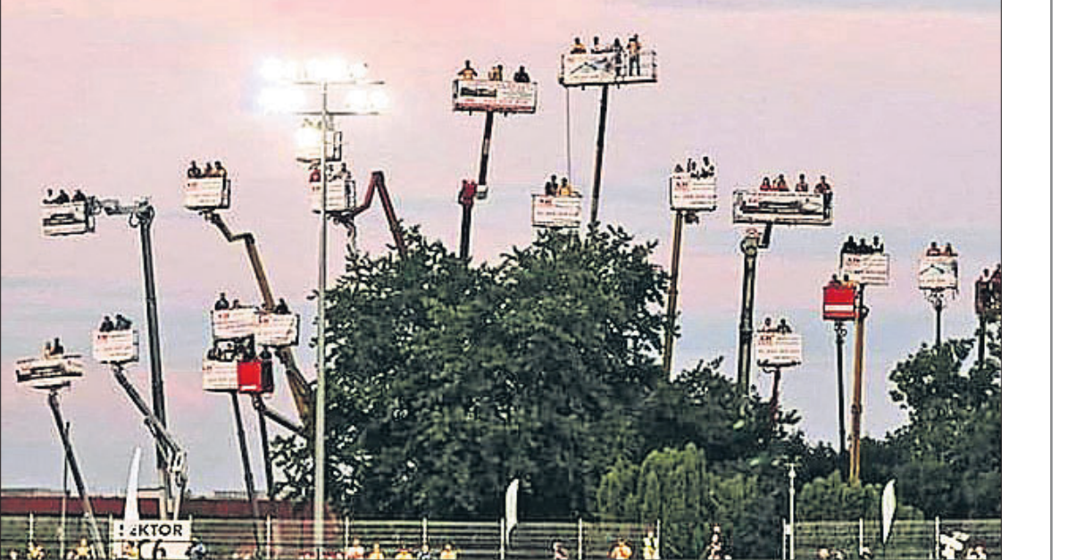
କ୍ରେନ୍ ଉପରେ ବସି ରେସ୍ ଦେଖିବାକୁ ଆସିଥିବା ଲୋକମାନେ

ଷ୍ଟାଡ଼ିୟମ ଉପରେ ରଖାଯାଇଥିଲା। ତେଣୁ ରେସ୍ ଶେଷ ପର୍ଯ୍ୟନ୍ତ ଲୋକେ କ୍ରେନ୍ରେ ବସି ଖେଳର ମଜା ନେଇ ପାରିଥିଲେ। ଷ୍ଟାଡ଼ିୟମର ଚାରିକଡ଼ରେ କ୍ରେନ୍ରୁ ଡିକ୍ଟାହୋଇ ଏକ ଭିନ୍ନ ଦୃଶ୍ୟ ସୃଷ୍ଟି କରିଥିଲା। ଆଉ ଏଥିରେ ବସିଲୋକେ ୬୫ ଫୁଟ ଉପରେ ରହି ରେସ୍ର ମଜା ନେଇଥିଲେ। ସବୁଠୁ ବଡ଼ କଥା ହେଉଛି ରେସ୍ ଶେଷ ହେବା ପରେ କ୍ରେନ୍ ଉପରେ ଥିବା ପ୍ରଶଂସକମାନେ ଆତସବାଜି ମଧ୍ୟ ପୁଟାଇଥିଲେ, ଯାହା ଦେଖିବା ପାଇଁ ଏକ ଭିନ୍ନ ପରିବେଶ ସୃଷ୍ଟି କରିଥିଲା।