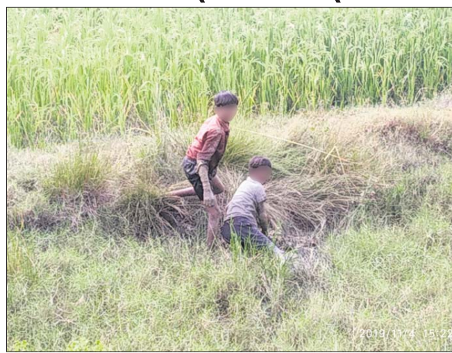
ପିଲାମାନେ ବିଲରେ କାମ କରୁଛନ୍ତି।

କରୋନା ମହାମାରୀ ପାଇଁ ରାଜ୍ୟରେ ବିଦ୍ୟାଳୟଗୁଡ଼ିକ ବନ୍ଦ ରହିଛି। ଏପରିସ୍ଥିତିରେ କେନ୍ଦ୍ରାପଡ଼ା ଜିଲ୍ଲା ମହାକାଳପଡ଼ା ବୁକ ବଉଳକଣା ପଞ୍ଚାୟତର ଉପାକ୍ର ଅଞ୍ଚଳ ଭାବେ ପରିଚିତ ବାଲୁଆପେଟ୍ଟିଟ ଆଦିବାସୀପଡ଼ାରେ ବହୁ ଛାତ୍ରଛାତ୍ରୀ ଏବେ ପାଠପଢ଼ା ଛାଡ଼ି ଚାଷ କାମରେ ପରିବାର ଲୋକଙ୍କୁ ସହଯୋଗ କରୁଛନ୍ତି। ଆଉ କେତେକଣ ନଦୀ ନାଳକୁ ମାଛ ଧରିବା ଓ ଜଙ୍ଗଲକୁ କାଠ ସଂଗ୍ରହ କରିବାରେ ବ୍ୟସ୍ତ ରହିଛନ୍ତି। ଏହାକୁ ବଜାରରେ ବିକ୍ରି କରି ପରିବାର ଲୋକେ ଘର ଚଳାଉଛନ୍ତି। ଫଳରେ ପିଲାଙ୍କ ପାଠପଢ଼ା ବାଧାପ୍ରାପ୍ତ ହୋଇଛି। ଅପରପକ୍ଷେ ମହାମାରୀ ସମୟରେ ଅନୁଲାଇନ୍ ମାଧ୍ୟମରେ ପାଠ ପଢ଼ା ପାଇଁ ରାଜ୍ୟ ସରକାର ମଧୁ ଓ ଶିକ୍ଷା ସଂଯୋଗ