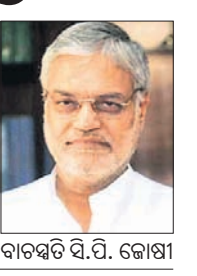
ରାଜସ୍ଥାନ ହାଇକୋର୍ଟ ବାଚସ୍ପତି ସି.ପି. କୋଷ୍ଠୀ