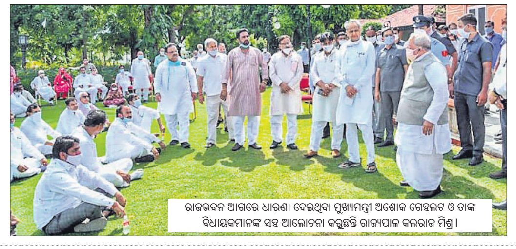
ରାଜଭବନ ଆଗରେ ଧାରଣା ଦେଇଥିବା ମୁଖ୍ୟମନ୍ତ୍ରୀ ଅଶୋକ ଚୋହଲଟ ଓ ତାଙ୍କ ବିଧାୟକମାନଙ୍କ ସହ ଆଲୋଚନା କରୁଛନ୍ତି ରାଜ୍ୟପାଳ କଲରାଜ ମିଶ୍ର ।

୩୦ରେ ସେ ନିଜ ବାସଭବନରେ କ୍ୟାମିନେଟ ବୈଠକ କରିଛନ୍ତି । ୨୦୦ ଆସନ ବିଶିଷ୍ଟ ବିଧାନସଭାରେ ନିଜ ସରକାରଙ୍କ ସଂଖ୍ୟାଗରିଷ୍ଟତାର ପ୍ରମାଣ ଦେବାକୁ ଚାହୁଁଥିବା ଗେହଲଟ କହିଛନ୍ତି, ରାଜ୍ୟପାଳ କଲରାଜ ମିଶ୍ର ଉପର (କେନ୍ଦ୍ର ସରକାରଙ୍କ) ଚାପରେ ନ ଆସି ଭୁଟା ଧରି ବିଧାନସଭା ଡାକନ୍ତୁ । ନଚେତ୍ ରାଜସ୍ୱାମୀଦ୍ୱାରା ରାଜଭବନ ଯୋଗାଏ କଲେ ରାଜ୍ୟପାଳ ଦାୟୀ ରହିବେ । ଗେହଲଟଙ୍କ ସହ ତାଙ୍କ ସମର୍ଥକ ବିଧାୟକମାନେ ରାଜ୍ୟପାଳଙ୍କୁ ଭେଟି ସୋମବାର ପୁଣି ଅଧିବେଶନ ଡାକିବାକୁ ଅନୁରୋଧ କରିଛନ୍ତି । ରାଜ୍ୟପାଳ ସମ୍ବୋଧିତ ନିୟମ ମାଧ୍ୟମରେ ବୋଲି ଗେହଲଟଙ୍କୁ ପ୍ରତିଶ୍ରୁତି