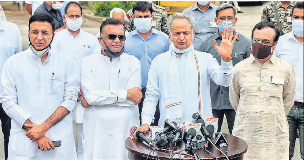
କମପୁରସ୍ଥିତ ହୋଟେଲ ଫେୟାର ମାଉଣ୍ଟ ଆଗରେ ରାଜସ୍ୱାମୀ ମୁଖ୍ୟମନ୍ତ୍ରୀ ଅଶୋକ ଚୋହଲଟଙ୍କ ସହ କଂଗ୍ରେସ ନେତା ରଣଦୀପ ସୁଜେଡ଼ିଆ, ଅବିନୀଶ ପାଣ୍ଡେ ଓ ଅଜୟ ମାଜନେ ଗଣମାଧ୍ୟମକୁ ସମ୍ବୋଧିତ କରୁଛନ୍ତି ।