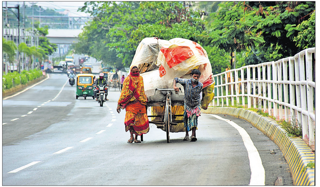
ଲକଡ଼ାଉନରେ ଜୀବନକାଳିକା: ଭୁବନେଶ୍ୱରର ଏକ ଉଠାଣି ଉପାରେ ଚଳିଥିବା ଲୋକଙ୍କର ଦୈନନ୍ଦିନ ଜୀବନକୁ କେହି ଜଣେ ସହଯୋଗ କରୁଛନ୍ତି।

ଏମାନେ ଆସିଥିଲେ। ଖର୍ଚ୍ଚରେ ସାହିରେ ମଧ୍ୟ ସମାନ ଅବସ୍ଥା। ଉକ୍ତ ଅଞ୍ଚଳର ଜଣେ ବ୍ୟକ୍ତି ଅସୁସ୍ଥ ହେବାରୁ ସେ ବ୍ରହ୍ମପୁରରୁ କଟକ ଫେରିଥିଲେ। ମେଡିକାଲରେ ତାଙ୍କର ମୃତ୍ୟୁ ଘଟିଥିଲା। ମୃତ୍ୟୁର ୨ ଦିନ ପରେ ତାଙ୍କ ରିପୋର୍ଟ ପଜିଟିଭ ଆସିଥିଲା। ଯେଉଁମାନେ ଶେଷକୃତ୍ୟରେ ସାମିଲ ହୋଇଥିଲେ, ସମସ୍ତଙ୍କର ପରୀକ୍ଷା ହୋଇଥିଲା। ୩୨ ଜଣଙ୍କ ରିପୋର୍ଟ ପଜିଟିଭ ଆସିବା ପରେ ଉକ୍ତ ଅଞ୍ଚଳ କର୍ତ୍ତୃନିଯୋଗ କୋରକୁ ଆସିଥିଲା। ସେହି ଶେଷକୃତ୍ୟରେ ଦେଖାନ ବଜାରର କେତେଜଣ ସାମିଲ ହୋଇଥିଲେ। ସେମାନଙ୍କ ମଧ୍ୟରୁ ୬ ଜଣଙ୍କ ପଜିଟିଭ ବାହାରିଛି।