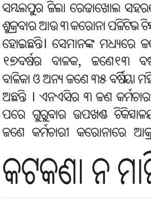
ରାମପୁର ତହସିଲଦାର ଓ ପୋଲିସ୍ ଉପସ୍ଥିତିରେ ଦୋକାନ ସିଲ୍ କରାଯାଇଛି ।

ଭୁବନେଶ୍ୱର, ୨୫୭୧(ବି.ଏନ.ଏ.) କିଶୋର ବିଶ୍ୱାଳ ସିଲ୍ କରାଯାଇଛି । ପଞ୍ଜାବୀ ବ୍ୟବସାୟୀଙ୍କୁ ନିର୍ଦ୍ଦେଶ ଦିଆଯାଇଛି । ଏହାକୁ ନିର୍ଦ୍ଦେଶନା ଦିଆଯାଇଛି । ଏହାକୁ ନିର୍ଦ୍ଦେଶନା ଦିଆଯାଇଛି । ଏହାକୁ ନିର୍ଦ୍ଦେଶନା ଦିଆଯାଇଛି ।