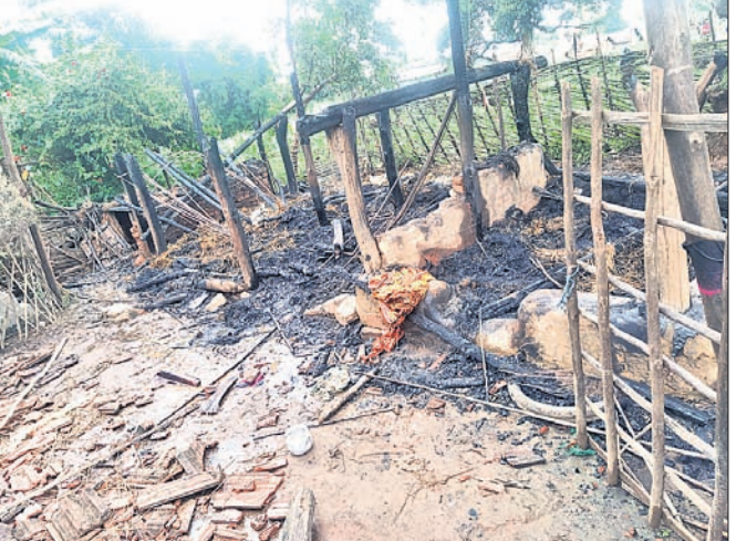
ପ୍ରତିପକ୍ଷ ଯୋଡ଼ି ଦେଇଥିବା ଘର।

ଯାଇ ମନଙ୍କ ଘର ଉପରେ ଆକ୍ରମଣ କରିଥିଲେ। ସେପାମରେ ଘରେ କେବଳ ମହିଳାମାନେ ଥିଲେ। ସେମାନେ ଏହାର ପ୍ରତିବାଦ କରିବାକୁ ସାହସ କରି ନ ଥିଲେ। ଏକ ଚାକ ଘରକୁ ନିଆଁ ଲଗାଇଦେବା ସହ ସେମାନେ ଚାଲି ଘର ଛପଡ଼ି ଉଠିଥିଲେ। ଘର ଭିତରେ ପଶି ସୁନା ଗହଣା ଓ ଚକା ଲଢ଼ କରିଥିଲେ ବୋଲି ମନଙ୍କ ପରିବାର ଲୋକେ ଅଭିଯୋଗ କରିଛନ୍ତି। ଘରେ ଥିବା ୧ ଲକ୍ଷ ୪୦ ହଜାର ଟଙ୍କା ଏବଂ ୧୦ ଭରି ସୁନା ସେମାନେ ଛୁଟି ନେଇଥିବା ଅଭିଯୋଗରେ ଉଲ୍ଲେଖ କରିଛନ୍ତି। ଏନେଇ ଖବରପାଇ କୋରାପୁଟ ଅତିରିକ୍ତ ଆରକ୍ଷୀ ଅଧ୍ୟକ୍ଷଙ୍କୁ ଅଭିଯୋଗ କରିଛନ୍ତି। ପୁତ୍ରପତ୍ନୀ ସୁନା ଗହଣା ଓ ଚକା ଲଢ଼ କରିଥିଲେ ବୋଲି ମନଙ୍କ ପରିବାର ଲୋକେ ଅଭିଯୋଗ କରିଛନ୍ତି। ଘରେ ଥିବା ୧ ଲକ୍ଷ ୪୦ ହଜାର ଟଙ୍କା ଏବଂ ୧୦ ଭରି ସୁନା ସେମାନେ ଛୁଟି ନେଇଥିବା ଅଭିଯୋଗରେ ଉଲ୍ଲେଖ କରିଛନ୍ତି। ଏନେଇ ଖବରପାଇ କୋରାପୁଟ ଅତିରିକ୍ତ ଆରକ୍ଷୀ ଅଧ୍ୟକ୍ଷଙ୍କୁ ଅଭିଯୋଗ କରିଛନ୍ତି। ପୁତ୍ରପତ୍ନୀ ସୁନା ଗହଣା ଓ ଚକା ଲଢ଼ କରିଥିଲେ ବୋଲି ମନଙ୍କ ପରିବାର ଲୋକେ ଅଭିଯୋଗ କରିଛନ୍ତି। ଘରେ ଥିବା ୧ ଲକ୍ଷ ୪୦ ହଜାର ଟଙ୍କା ଏବଂ ୧୦ ଭରି ସୁନା ସେମାନେ ଛୁଟି ନେଇଥିବା ଅଭିଯୋଗରେ ଉଲ୍ଲେଖ କରିଛନ୍ତି। ଏନେଇ ଖବରପାଇ କୋରାପୁଟ ଅତିରିକ୍ତ ଆରକ୍ଷୀ ଅଧ୍ୟକ୍ଷଙ୍କୁ ଅଭିଯୋଗ କରିଛନ୍ତି।