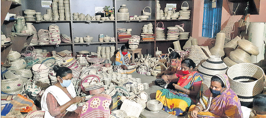
ମହିଳାମାନେ ସବାଇସାସରେ ବିକଳ ଉପକରଣ ତିଆରି କରୁଛନ୍ତି।

ତାଙ୍କୁ ସହଯୋଗର ହାତ ବଢ଼ାଇବା ସହିତ ସେମାନେ ଉତ୍ପାଦନ କରୁଥିବା ବିକଳ ଉପକରଣ ମାର୍କେଟିଂ କରିବାରେ ଆଗେଇ ଏଥିରେ ଉପକରଣ ଲିମିଟେଡ଼ ତିଆରି କରୁଛନ୍ତି। ଏହାକୁ ଭଲ ଦାମରେ ବିକ୍ରି କରି ସେମାନେ ବେଶ୍ ବିପଦରା ରୋଜଗାର କରୁଛନ୍ତି।