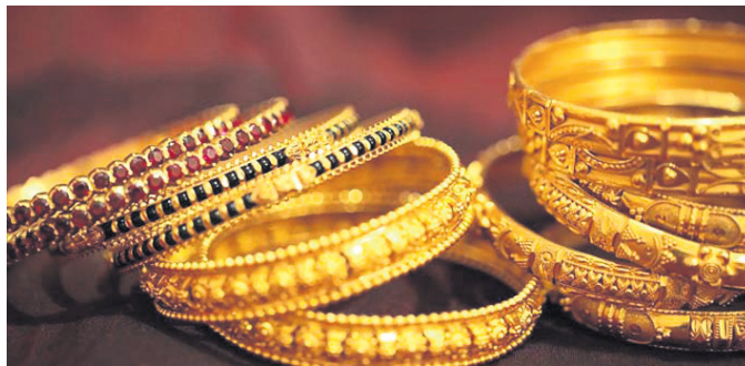
ହାହାରିବାକୁ ଶ୍ରେଣୀକୃତ କରିପାରେ ସର୍ବକାଳୀନ ରେକର୍ଡ ଥିରରେ ଦର

ଭାରତୀୟ ଅର୍ଥ ବ୍ୟବସ୍ଥା ମାନ୍ୟତା ଦେଇ ରାଜ୍ୟ ସରକାରଙ୍କ ଦ୍ୱାରା ଦର ବୃଦ୍ଧି କରାଯାଇଛି। ଏହା ଫଳରେ ସୁନା ଦର ଲଗାତର ଭାବେ ବୃଦ୍ଧି ପାଇଛି।