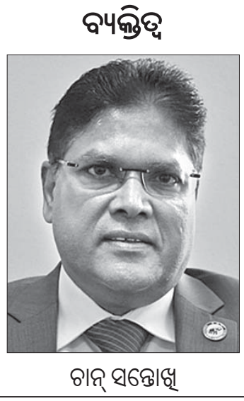
ବ୍ୟକ୍ତିତ୍ୱ ଗାନ୍ଦି ସତ୍ୟୋଖି

ଦକ୍ଷିଣ ଆମେରିକାର ଉତ୍ତର ପୂର୍ବାଞ୍ଚଳ ଉପକୂଳରେ ଅବସ୍ଥିତ ଏକ ରାଷ୍ଟ୍ର ହେଉଛି ସୁରିନାମ । ପାରାମାରିବୋ ଏହାର ରାଜଧାନୀ । ସୁରିନାମର ଜଡିହାସ ଦେଖିଲେ ଏହା ୧୯୬୫ ମସିହାରେ ସ୍ୱାଧୀନତା ଲାଭ କରିଥିଲା । ଇତିଆଣ ଧୁବାକରଣ, ସାମରିକ କ୍ଷମତାଧିକାର ଓ ଗୁରୁତ୍ୱ କହି ଦେଶକୁ ଦୀର୍ଘଦିନ ଅରାଜକତା ମଧ୍ୟରେ ରଖୁଥିଲା । ୧୯୮୭ରେ ଯେତେବେଳେ ପ୍ରତିଷ୍ଠା ହୋଇଥିଲା । ହେଲେ ପୁନଶ୍ଚ ୧୯୯୦ରେ ସାମରିକ ଶାସନ ଦେଖିଥିଲା ଏହି ରାଷ୍ଟ୍ର । ଏହାର ବର୍ଷକ ପରେ ଗଣତନ୍ତ୍ର ପୁନଃସ୍ଥାପିତ ହୋଇଥିଲା । ସୁରିନାମର ବିଶେଷତ୍ୱ ହେଉଛି ସବୁଜ ବନାମ । ଜଙ୍ଗଲରେ ପରିପୂର୍ଣ୍ଣ ହୋଇଥିବାରୁ ଅଜୀବଜୀବୀ, ଅନୁଚୁତ ହୋଇ ନ ଥାଏ । ୨୦୧୮ ସର୍ବେ ଚିପୋର୍ଟରେ ଏହାର ଜନସଂଖ୍ୟା ମାତ୍ର ୫,୨୫, ୯୯୦ ଉଲ୍ଲେଖ ରହିଛି । କିନ୍ତୁ ବନ୍ଧାଗତି, ସୁନା, ଯେତେଜଳାତ ପଦାର୍ଥ ଏବଂ କୃଷିକାର ତଦ୍ୱୟ ରପ୍ତାନି ଦ୍ୱାରା ଏହାର ଅର୍ଥନୀତି ପରିପୁଷ୍ଟ । ଏଭଳି ଏକ ପ୍ରାକୃତିକ ସୌନ୍ଦର୍ଯ୍ୟରେ ଭରପୁର ଦେଶର ମୁଖ୍ୟ ଆର୍ଥିକ ଭାବେ ଏବେ ଜଣେ ଭାରତୀୟ ବଂଶୋତ୍ତମ ଦୀର୍ଘତ୍ର ଗ୍ରହଣ କରିଛନ୍ତି । ସେ ହେଉଛନ୍ତି ବନ୍ଧୁକାପୋରସାଏ 'ଗାନ୍ଦି' ସତ୍ୟୋଖି । ୧୬ ଜୁଲାଇରେ ସୁରିନାମର ରାଷ୍ଟ୍ରପତି ଭାବେ ଶପଥ ନେବା ବେଳେ ହାତରେ ବେଦ ଧରି ସଂସ୍କୃତ ଶବ୍ଦ ଉଚ୍ଚାରଣ କରିଥିବାରୁ ତାଙ୍କ ବ୍ୟକ୍ତିତ୍ୱକୁ ନେଇ ଡେର ଚର୍ଚ୍ଚା । ସତ୍ୟୋଖିଙ୍କ ପୂର୍ବ ପୁରୁଷ କାମ ଅବେଶରେ ସେଠାକୁ ଚାଲି ଯାଇଥିଲେ । ସେ ଏ ଫେବୃୟାରୀ ୧୯୫୯ରେ ଲେଲିଡ୍ରପୁରେ ଜନ୍ମଗ୍ରହଣ କରିଥିଲେ । ପରିବାରର ୯ ସନ୍ତାନ ମଧ୍ୟରେ ସେ ସବୁଠାରୁ ସାନ । ତାଙ୍କ ପିତା ପାରାମାରିବୋ ପୋଡାଣ୍ଡସରେ ଚାକିରି କରୁଥିଲେ ଓ ମାତା ଲେଲିଡ୍ରପୁରେ ଏକ ବୋକାଲରେ ଆସିଷ୍ୟା ଭାବେ କାର୍ଯ୍ୟ କରୁଥିଲେ । ସତ୍ୟୋଖି ପାରାମାରିବୋସ୍ଥିତ ଅଲକେମେନେ ମିଡିକାଲରେ