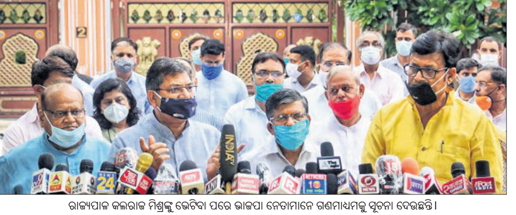
ରାଜ୍ୟପାଳ କଲରାଜ ମିଶ୍ରଙ୍କୁ ଭେଟିବା ପରେ ଭାଜପା ନେତାମାନେ ଗଣମାଧ୍ୟମକୁ ସୂଚନା ଦେଉଛନ୍ତି।

ଅଶୋକ ଗେହଲଟ ସୁରକ୍ଷା ଦେବା ପରେ ସୋମବାର ବିଧାନସଭା ଅଧିବେଶନ ଡାକିବା ଦାବିରେ ଶୁକ୍ରବାର ଗେହଲଟ ଓ କଂଗ୍ରେସ ବିଧାୟକମାନେ ରାଜ୍ୟପାଳ