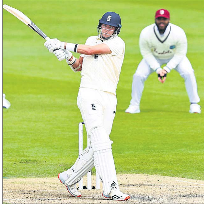
ଦ୍ରୁତ ଅର୍ଦ୍ଧଶତକୀୟ ଇମିଂସ ଅବସରରେ ସ୍ଟୁଆର୍ଟ ବ୍ରଡ୍।