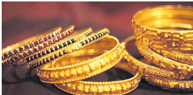
ହାହାରିବାକୁ ଶ୍ରେଣୀକୃତ କରିପାରେ ସର୍ବକାଳୀନ ରେକର୍ଡ ଥିରରେ ଘର