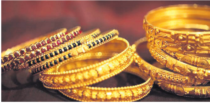
ହାହାରିବାକୁ ଶ୍ରେଣୀଗୁଡ଼ିକର ଦର

ଭାରତୀୟ ଅର୍ଥ ବ୍ୟବସ୍ଥା ମାନ୍ୟତା ଦେଇ ଗତି କରୁଥିବା ବେଳେ କରୋନା ଏହାର ଅଧିକାରୀ ଭାବେ ଦେଖାଯାଇଛି। ଏହି ସମୟରେ ସୁନା ଦର ଲଗାତର ଭାବେ ବହୁଥିବା ନକରକୁ ଆସିଛି। ଏଭଳି ଲଗାତର ସୁନା ଦର ବଢ଼ି ଚାଲିଲେ ଏହା ଶିଳ୍ପ ଉପରେ ଗଭୀର ପ୍ରଭାବ ପକାଇବ ବୋଲି ବଜାର ବିଶେଷଜ୍ଞମାନେ ମତ ପ୍ରକାଶ କରିଛନ୍ତି। ସୁନା ମୂଲ୍ୟ ବଦଳା ଯୋଗୁ ଏହା ଉପଭୋକ୍ତା ଚାହିଦା ଉପରେ ପ୍ରଭାବ ପକାଇବା ଆଶଙ୍କା କରାଯାଉଛି। କୋଭିଡ଼ ଭଳି ସ୍ଥିତିରେ ସୁନା ବର୍ତ୍ତମାନ ନୂଆ ରେକର୍ଡ ଗ୍ରହଣ କରିଛି। ଶୁକ୍ରବାର ମୁ୍ୟାଦରେ ସୁନା ୫୦,୯୧୯ ଟଙ୍କା ଛଇଥିବା ବେଳେ ନୂଆଦିଲ୍ଲୀରେ ୫୧,୯୪୬ ଟଙ୍କା ରହିଥିଲା। ସର୍ବାଧିକାଂଶ ରତ୍ନ ଏବଂ ଆଭୂଷଣ