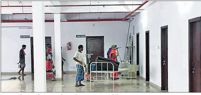
ଗଞ୍ଜାମ ଜିଲା ଅଶ୍ୱିନୀ କୋଭିଡ୍ ହସ୍ପିଟାଲ କାମ ଚାଲିଛି।