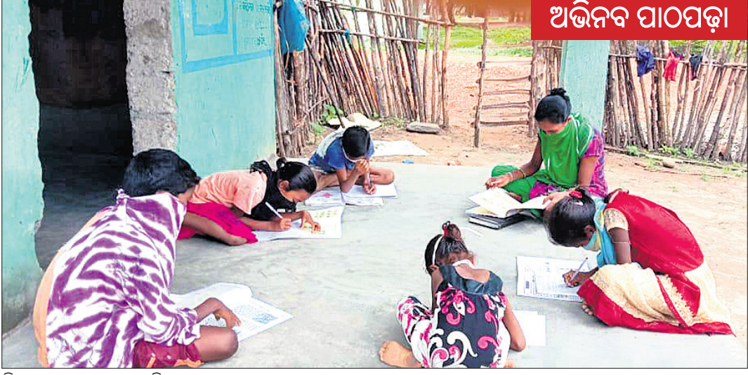
ପିଲାମାନଙ୍କୁ ପାଠ ପଢ଼ାଯାଇଛି।

ମାଲକାନଗିରି ଜିଲାର ଶ୍ରମଜୀବୀ ଓ ମହିଳା ଶ୍ରମଜୀବୀ ସଙ୍ଗଠନ ପକ୍ଷରୁ ଶିକ୍ଷା ବ୍ୟବସ୍ଥାର ପ୍ରତିକାରମୂଳକ ନିଶ୍ଚିତ ୩,୫ ଓ ୮ କାର୍ଯ୍ୟକ୍ରମ ସାମାଜିକ ଗଣମାଧ୍ୟମ, ବୁଢ଼ିଚର, ଫେସ୍‌ବୁକ୍ ମାଧ୍ୟମରେ ପାଠପଢ଼ା ଲାଗି ଅଭିଭାବକ ଓ ଛାତ୍ରାଛାତ୍ରୀଙ୍କ ମତ ନେଇ ଉଚ୍ଚତର ଭାବେ ଓ କେନ୍ଦ୍ର ସରକାରଙ୍କୁ ଅବଗତ କରାଯାଇଛି। ଏହି ନିଶ୍ଚିତ ୩,୫ ଓ ୮ ଅନୁସାରେ କୋଭିଡ଼ ନିୟମ ପାଳନ କରି ଗ୍ରାମମାନଙ୍କରେ ପିଲାଙ୍କୁ ଶିକ୍ଷା ପ୍ରଦାନ କରିବା, ପ୍ରାୟାଶ ଶ୍ରମିକଙ୍କୁ କାମ ଯୋଗାଇବା, ଅଗଷ୍ଟ ମାସ ମଧ୍ୟରେ ସ୍କୁଲ ଗୁଡ଼ିକରେ ଭିଡ଼ିଗୁମିର ପୁନରୁଦ୍ଧାର ଲକ୍ଷ୍ୟ ରଖାଯାଇଛି। କରୋନା ମହାମାରୀ ଯୋଗୁ ବିଦ୍ୟାଳୟ ସବୁ ବନ୍ଦ ଥିବାରୁ ଗ୍ରାମାଞ୍ଚଳରେ ଅନେକ ଛାତ୍ରାଛାତ୍ରୀ ଶିକ୍ଷାକୁ ବଞ୍ଚିତ ହେବା ସହ ପୂର୍ବରୁ ଅଧ୍ୟୟନ କରିଥିବା ଶିକ୍ଷା ମଧ୍ୟ ଭୁଲିଯାଉଛନ୍ତି। ଏହି ସମୟରେ ଜିଲାର ଶ୍ରମଜୀବୀ ଓ ମହିଳା ଶ୍ରମଜୀବୀ