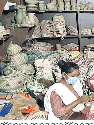
ସବାଇ ସାସରେ ପ୍ରସ୍ତୁତ ହୁଏ ହସ୍ତକଳା ଓ ବିଭିନ୍ନ ଘରକରଣା ଜିନିଷର ଚାହିଦା

ସବାଇ ସାସରେ ପ୍ରସ୍ତୁତ ହୁଏ ହସ୍ତକଳା ଓ ବିଭିନ୍ନ ଘରକରଣା ଜିନିଷର ଚାହିଦା ରହିଛି। ପୁଲ୍ ଚାଲୁଡ଼ି, ପାଣିଆ, ବ୍ୟାଗ୍ ସହିତ ବିଭିନ୍ନ ଉପକରଣ ରାଜ୍ୟ ତଥା ରାଜ୍ୟ ବାହାରେ ଆର୍ଡ଼ିଟ୍ ଲାଭ କରୁଛି। ମୟୂରଭଞ୍ଜ ଜିଲାର ଅଧିକାଂଶ ମହିଳା ଏହାଦ୍ୱାରା ସ୍ୱାବଲମ୍ବୀ ହୋଇ ପାରିଛନ୍ତି। ସେମାନେ ତିଆରି କରୁଥିବା ଉପକରଣ ରାଜ୍ୟର ବିଭିନ୍ନ ମେଳା ଓ ମହୋତ୍ସବରେ ବିକ୍ରି ହେଉଛି। ମୁ୍ୟାଦ, ଅହମ୍ମଦାବାଦ, ଦିଲ୍ଲୀ ଓ କୋଲକାତାର ବିଭିନ୍ନ ସ୍ଥଳରେ ମଧ୍ୟ ଏହି ସାମଗ୍ରୀ ଉପଲବ୍ଧ ହୋଇପାରେ।