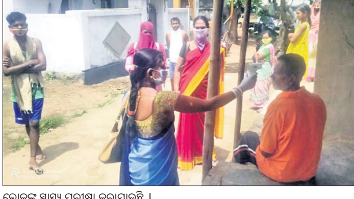
ଲୋକଙ୍କ ସ୍ଵାସ୍ଥ୍ୟ ପରୀକ୍ଷା କରାଯାଇଛି।