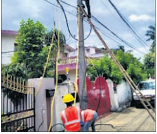
ପ୍ରତିଯୁଗୀ ସୁଧା ସିନିଆର ସାମଗ୍ରୀକ ସେବା

କରୋନା ଯୋଗୁ ରାଜ୍ୟର ୪ ଲକ୍ଷ ଏବଂ ଗୋଟିଏ ମହାନଗର ନିଗମରେ ୧୪ ଦିନିଆ ଲକ୍ଷ୍ମୀର ଯୋଗାଣ କରିଛନ୍ତି। ଏଭଳି ବ୍ୟାଲେଊଟ୍ ସମୟରେ ଚାଟା ପାଖରେ ସେକ୍ସୁଆଲ ଓଡ଼ିଶା ଡିଭିଜନ୍ (ଇଂଲିଶ୍) ଲୋକଙ୍କୁ ୨୪ ଘଣ୍ଟା ନିରନ୍ତର ବିଦ୍ୟୁତ୍ ସେବା ଯୋଗାଣ ଲାଗି ଯୋଜନା ହାତକୁ ନେଇଛି। ଶତ୍ରୁତର ସ୍ଥିତିକୁ ଧ୍ୟାନରେ ରଖି