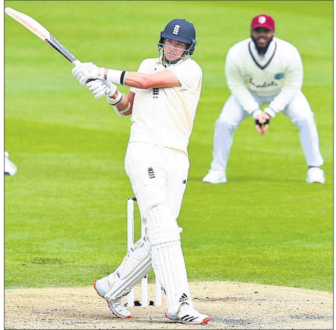
ଦୁଇ ଅର୍ଦ୍ଧଶତକୀୟ ଲନିଂସ୍ ଅବସରରେ ଷ୍ଟୁଆର୍ଟ ବ୍ରଡ୍।

୯ ଟୋକା ଓ ୧ ଛକା ସହାୟତାରେ ଦୁଇ ୬୨ ରନର ଅର୍ଦ୍ଧଶତକୀୟ ପାଳି ଖେଳି ଓଷ୍ଟ୍ରେଲିଆକୁ ନିରାଶ କରିଥିଲା। କ୍ରୀଡ଼ାରେ ଓଷ୍ଟ୍ରେଲିଆର ବ୍ୟାଟିଂ ବିପର୍ଯ୍ୟୟର ସମ୍ପୂର୍ଣ୍ଣାନ୍ ହୋଇଛି। ଖବର ନେବା ବେଳକୁ ଦଳ ୪୩୩ ଓଭରରେ ୬୭୫ ରନ କରିଛି। ଦଳ ୫୫୫ ରନ କରିଛି। ଦଳ ୫୫୫ ରନ କରିଛି। ଦଳ ୫୫୫ ରନ କରିଛି।