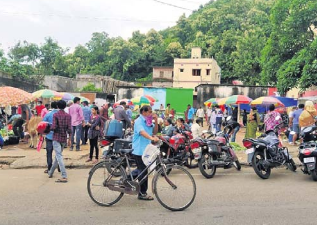
ପାର୍କ ସ୍ଥାନରେ ପରିବା ବଜାର।

ଯାକପୁର ଜିଲ୍ଲାରେ ଶନିବାର ୨୩ ନୂଆ କରୋନା ସଂକ୍ରମିତ ତିନିଟି ହୋଇଛନ୍ତି। ଜିଲ୍ଲାରେ ମୋଟ ଆକ୍ରାନ୍ତଙ୍କ ସଂଖ୍ୟା ୧୦୮୮ରେ ପହଞ୍ଚିଛି। ବରା ବ୍ଲକର ୫, ଦଶପଲ୍ଲୀର ୧୨, ଧର୍ମଶାଳାର ୩, ବଡ଼ବେରା ୨ ଓ ଯାକପୁରର ଜଣେ ନୂଆ ସଂକ୍ରମିତ ଅଛନ୍ତି। ଏଥିରେ ୮ ଜଣ ସ୍ଥାନୀୟ ବ୍ୟକ୍ତି ସଂକ୍ରମିତ ହୋଇଥିବା ଜିଲ୍ଲା ସୂଚନା ଓ ଲୋକ ସମ୍ପର୍କ ବିଭାଗ ପକ୍ଷରୁ ସୂଚନା ମିଳିଛି।