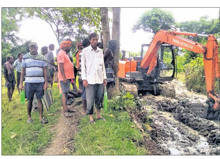
ଜେସିବି ମେଶିନ୍ ମାଧ୍ୟମରେ ଜଳ ନିଷ୍କାସନ ନାଳ ଖୋଳା ଯାଉଛି ।