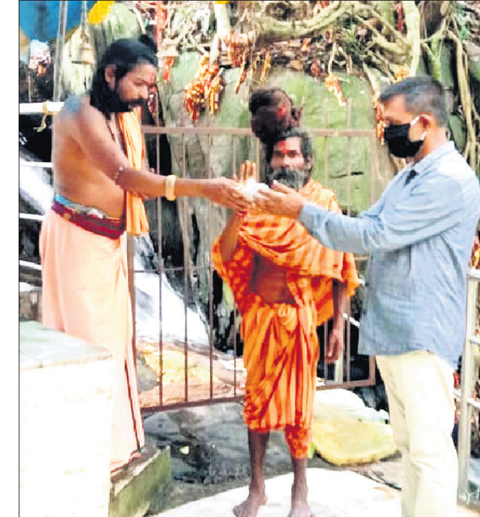
ପରିଷଦ ପକ୍ଷରୁ ବାବା ପଞ୍ଚଲିଙ୍ଗେଶ୍ୱର ପାଠରୁ ଜଳ ଓ ମାଟି ସଂଗ୍ରହ କରାଯାଇଛି ।