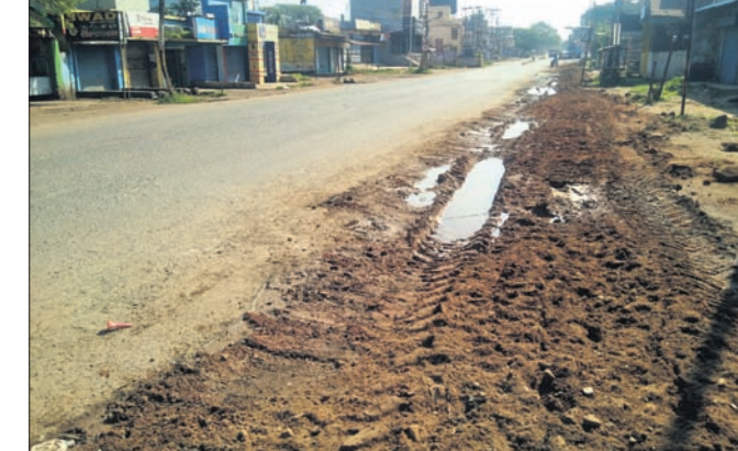
ପାଇବୁ ପାଟି ପାଣି ଜମିଛି ।