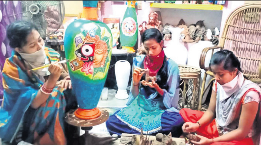
ମହିଳା ଓ ଯୁବତୀମାନେ ଚେରାକୋଟା କାମ କରୁଛନ୍ତି ।

ଦିନକୁ ଦିନ ଅଣାୟତ୍ତ ହୋଇପାରୁଥିବା ମହାମାରି କରୋନା । ଏହାଦ୍ୱାରା ସମସ୍ତ ବର୍ଗର ଲୋକେ ପ୍ରଭାବିତ ହୋଇଛନ୍ତି । ଛୋଟ ଓ ବଡ଼ ବ୍ୟବସାୟୀମାନେ ମୁଣ୍ଡରେ ହାତ ବସିଛନ୍ତି । ବିଭିନ୍ନ ସାମଗ୍ରୀ ପ୍ରସ୍ତୁତ କରି ବିକ୍ରିକରା କରି ଗୁଳୁଗାଣା ମେଣ୍ଟାଉଥିବା ମହିଳା ସ୍ୱୟଂସହାୟିକା ଗୋଷ୍ଠୀ ମଧ୍ୟ ଏଥିରୁ ବାଦ୍ ପଡ଼ିନାହିଁ । ଲକ୍ଷ୍ମଣନ ଓ ଶତ୍ରୁଘ୍ନ କାରଣରୁ ପ୍ରାୟ ୪ମାସ ହେଲା ବିଭିନ୍ନ ବେପାର ବଣିକ ଉପରେ ପ୍ରଶାସନ ପ୍ରତିବନ୍ଧକ ଲଗାଇଛନ୍ତି । ଏଭଳି ପରିସ୍ଥିତିରେ ଚେରାକୋଟା ଶିଳ୍ପୀମାନେ ବିଶେଷ ପ୍ରଭାବିତ ହୋଇଛନ୍ତି । ଲକ୍ଷ୍ମଣନ ସେମାନଙ୍କ ଜୀବନର ମୋଡ଼ ବଦଳାଇ ଦେଇଛି । ବନ୍ଧୁ କୁ ଅଧୀନ ଆଗରପଡ଼ା ମହାନ୍ତିପଡ଼ା ପଞ୍ଚାୟତ ଡ୍ରାଗାଲିଆ ଗ୍ରାମର ଦୁଇଟି ସ୍ୱୟଂ ସହାୟକ ଗୋଷ୍ଠୀ ଚେରାକୋଟା ଶିଳ୍ପରେ ନିଜର ପରିଚୟ ସୃଷ୍ଟି କରିପାରିଛନ୍ତି । ଏହି ଦୁଇ ଗୋଷ୍ଠୀର ପ୍ରତ୍ୟେକ ୧୫ଜଣ ଲେଖାଏଁ ମହିଳା ସରକାରଙ୍କ ବିଭିନ୍ନ ସ୍କିମ ଜରିଆରେ ନିଜ ଗାଁରେ ଚେରାକୋଟା ଶିଳ୍ପ ଆରମ୍ଭ କରିଥିଲେ । ଏହି ଦୁଇ ସ୍ୱୟଂ ସହାୟକ