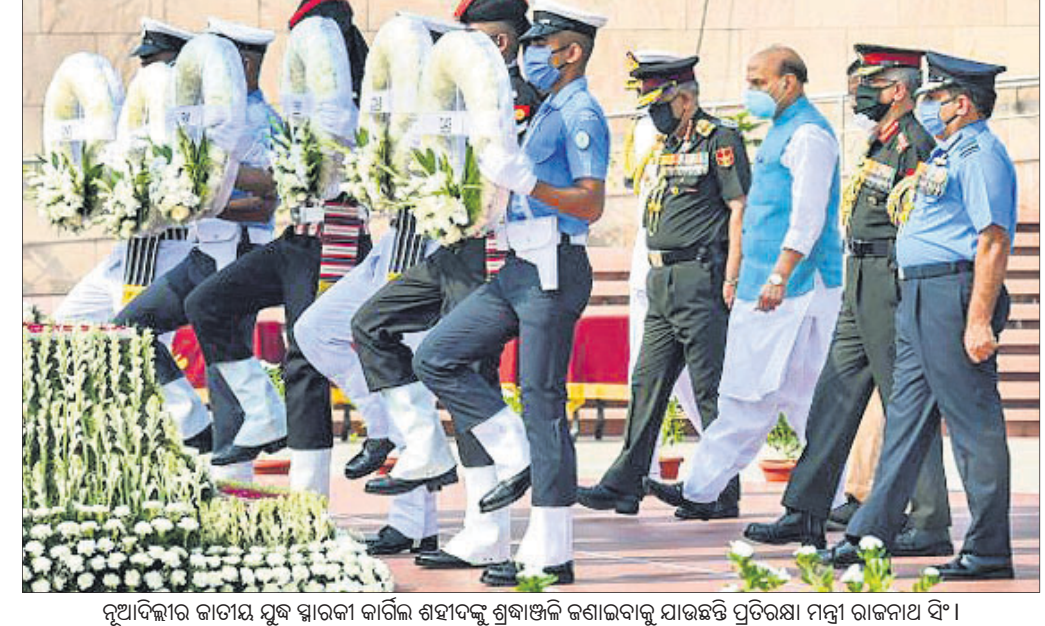
ନୂଆଦିଲ୍ଲୀର ଜାତୀୟ ମୁକ୍ତ ସ୍ମାରକୀ କାର୍ତ୍ତିକ ଶହୀଦଙ୍କୁ ଶ୍ରଦ୍ଧାଞ୍ଜଳି ଜଣାଇବାକୁ ଯାଇଛନ୍ତି ପ୍ରତିରକ୍ଷା ମନ୍ତ୍ରୀ ରାଜନାଥ ସିଂ ।