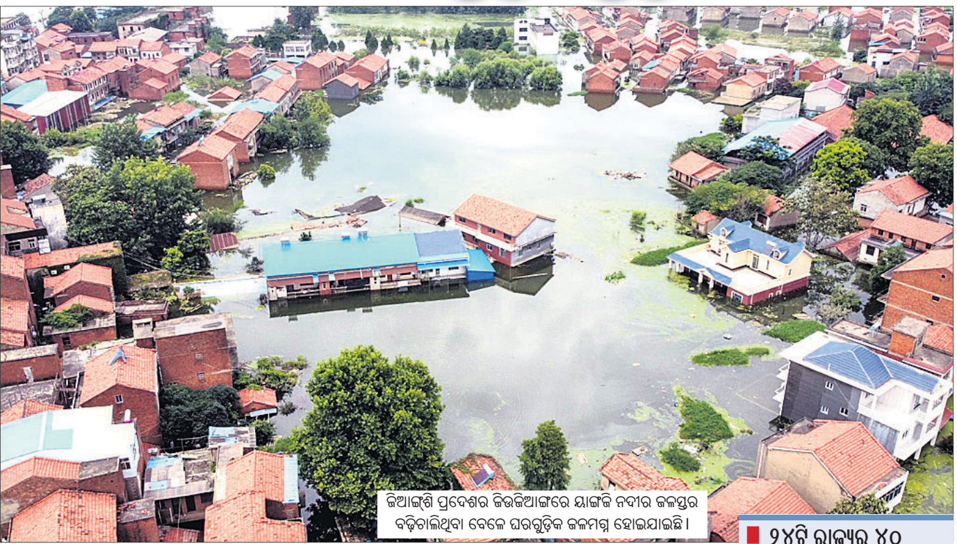
କିଆଙ୍ଗି ପ୍ରଦେଶର କିଆଙ୍ଗିରେ ଯାଙ୍ଗି ନଦୀର ଜଳସ୍ତର ବଢ଼ିଯାଇଥିବା ବେଳେ ଘରଗୁଡ଼ିକ ଜଳମୁଗ୍ଧ ହୋଇଯାଇଛି ।

କେନ୍ଦ୍ର/ଖୁଶିଚର, ୨୬/୭ କେନ୍ଦ୍ରୀୟ ଚାଇନାରେ ଦେଶର ଦୀର୍ଘତମ ନଦୀ 'ୟାଙ୍ଗି' ପ୍ରୟାଗରୁ ବନ୍ୟା ଆସିଛି । ଭୂମି ପରିଚାଳନା ଲାଗଣ ବର୍ଷା ଫଳରେ ନଦୀର ଜଳସ୍ତର ୫୦ ଫୁଟ ବୃଦ୍ଧି ପାଇଛି । ଏଥିରେ ୨୪ଟି ରାଜ୍ୟର ୪୦ ନିୟୁତ ଲୋକ ପ୍ରଭାବିତ ଓ ୨୦୦ରୁ ଊର୍ଦ୍ଧ୍ୱ ମୃତ କିମ୍ବା ନିଖୋଜ ହୋଇଯାଇଛନ୍ତି । ଏହି ବନ୍ୟା କରୋନା ମହାମାରୀ ସହ ମୁହଁଫୁଟିବା