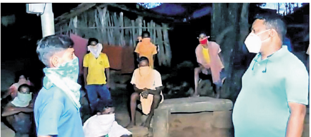
ଅନୁଧ୍ୟାନରେ ଯାଇଥିବା ଦଳ ଗ୍ରାମବାସୀଙ୍କ ସହ ଆଲୋଚନା କରୁଛନ୍ତି।