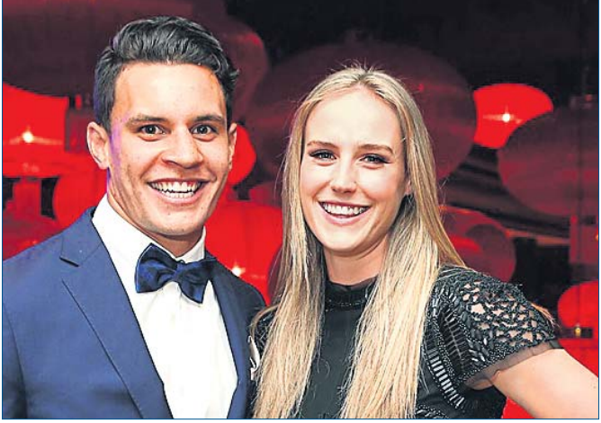
ମ୍ୟାଡ଼ ରୁପୁଆ ଓ ଏଲିସ୍ ପେରା ।

ସିଡ୍ନୀ, ୨୬୭ : ଅଷ୍ଟ୍ରେଲିଆର ମହିଳା କ୍ରିକେଟ ପୁରସ୍କାର ଏଲିସ୍ ପେରା ଏବଂ ଅଷ୍ଟ୍ରେଲିଆ ରଗର୍‌ଟା ଯୁନିୟନ ଖେଳାଳି ମ୍ୟାଡ଼ ରୁପୁଆଙ୍କ ମଧ୍ୟରେ ବିବାହ ବିଚ୍ଛେଦ ଘଟିଛି। ଏହା ଆପୋସ ବୁକ୍‌ମାଗାରେ ହୋଇଥିବା ଉଭୟେ ଶ୍ରଦ୍ଧା ଦେଇଛନ୍ତି। ଶୁକ୍ରବାର ବିକେଟିରେ ପ୍ରକାଶ କରିଛନ୍ତି। ପେରା ଓ ରୁପୁଆ ୨୦୧୫ରେ ବିବାହ କରିଥିଲେ। ବର୍ଷ ଆରମ୍ଭରେ ଉଭୟେ ପରସ୍ପରଠାରୁ ଅଲଗା ହେବାଲାଗି ନିଷ୍ପତ୍ତି ନେଇଥିଲେ ମଧ୍ୟ ସାଧାରଣରେ ପ୍ରକାଶ କରି ନ ଥିଲେ। ବିଚ୍ଛେଦର କାରଣକୁ ସେମାନେ ଗୋପନ ରଖିବା ଲାଗି ନିଷ୍ପତ୍ତି ନେଇଛନ୍ତି। ଗତ ଫେବୃଆରୀରେ ମେଲବୋର୍ନରେ ପେରା ଅଷ୍ଟ୍ରେଲିଆନ କ୍ରିକେଟ ଆଫ୍ରଟ୍