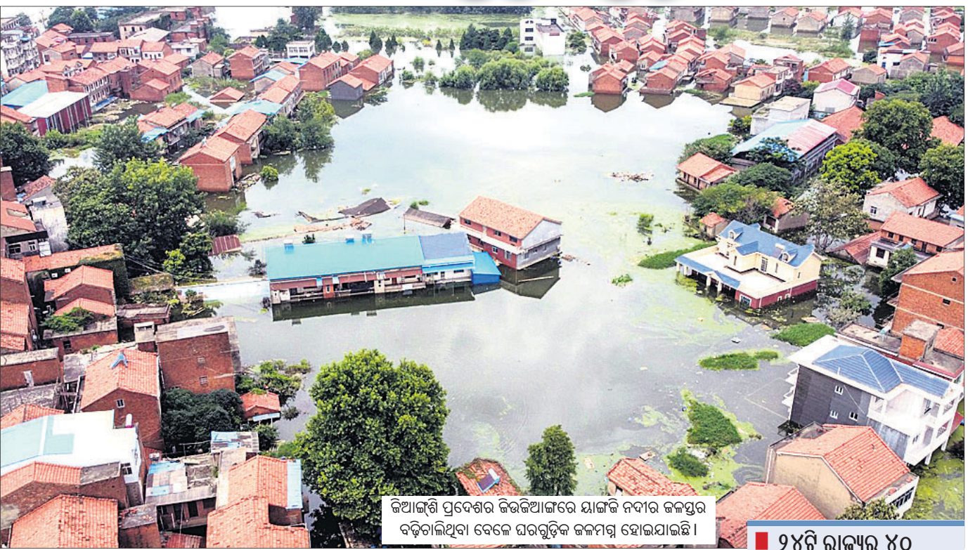
କିଆଙ୍ଗି ପ୍ରଦେଶର କିଆଙ୍ଗିଆଙ୍ଗରେ ଯାଙ୍ଗି ନଦୀର ଜଳସ୍ତର ବଢ଼ିଗଲିଥିବା ବେଳେ ଘରଗୁଡ଼ିକ ଜଳମାତ୍ରେ ହୋଇଯାଇଛି ।

କେନ୍ଦ୍ର/ଖୁଶିଚର, ୨୬/୭ କେନ୍ଦ୍ରୀୟ ଚାଇନାରେ ଦେଶର ଦୀର୍ଘତମ ନଦୀ 'ୟାଙ୍ଗି' ପ୍ରଦଳନା ବନ୍ୟା ଆଣିଛି । ଭୂମି ପରିଚାଳନା ଲାଗଣ ବର୍ଷା ଫଳରେ ନଦୀର ଜଳସ୍ତର ୫୦ ଫୁଟ ବୃଦ୍ଧି ପାଇଛି । ଏଥିରେ ୨୪ଟି ରାଜ୍ୟର ୪୦ ନିୟୁତ ଲୋକ ପ୍ରଭାବିତ ଓ ୨୦୦ରୁ ଊର୍ଦ୍ଧ୍ୱ ମୃତ କିମ୍ବା ନିଖୋଜ ହୋଇଯାଇଛନ୍ତି । ଏହି ବନ୍ୟା କରୋନା ମହାମାରୀ ସହ ମୁହଁଫୁଟା