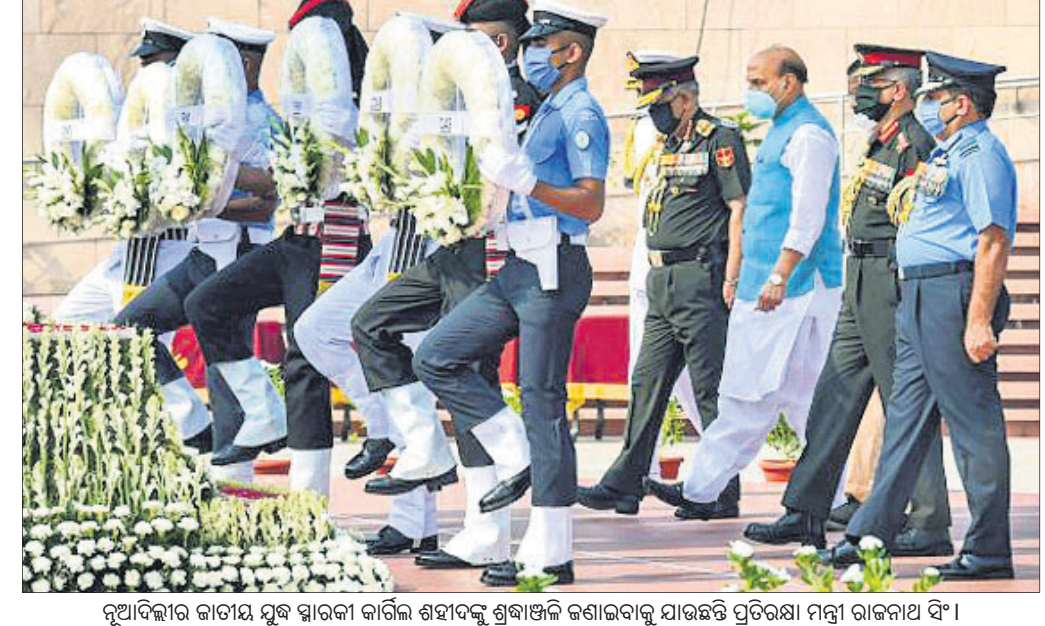
ନୂଆଦିଲ୍ଲୀର ଜାତୀୟ ମୁକ୍ତ ସ୍ମାରକୀ କାର୍ତ୍ତିକ ଶହୀଦଙ୍କୁ ଶ୍ରଦ୍ଧାଞ୍ଜଳି ଜଣାଇବାକୁ ଯାଇଛନ୍ତି ପ୍ରତିରକ୍ଷା ମନ୍ତ୍ରୀ ରାଜନାଥ ସିଂ ।