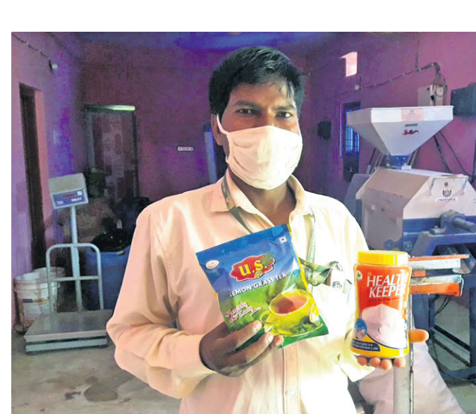
ତ୍ରିକ୍ଷୁ ଲେମ୍ବୁ ଗ୍ରାସରୁ ପ୍ରସ୍ତୁତ ଚା'ପତି ଓ ପ୍ରୋଟିନ ପାଉଡ଼ର ଦେଖାଉଛନ୍ତି।

ପ୍ରକ୍ରିୟାକରଣ ଚାଲି ନେଇଥିଲେ। ଏଥିସହ ନ୍ୟାଶନାଲ ବଟାନିକାଲ ରିସର୍ଚ୍ଚ ଇନ୍‌ଷ୍ଟିଚ୍ୟୁଟ(ଏନ୍.ବି.ଆର୍.ଆଇ.)ରୁ ଜୈବିକ ସାର ଉତ୍ପାଦନ ଚାଲି ନେଇଥିଲେ। ଚାଷ କରିଥିବା ଲେମ୍ବୁ ଗ୍ରାସରୁ ଉତ୍ପାଦିତ ଫସଲକୁ 'ଉମାଶଙ୍କର' ବ୍ରାଣ୍ଡରେ ଚା'ପତି ପ୍ରସ୍ତୁତ କରିଥିଲେ। ଏହାର ୨୫୫ ଗ୍ରାମ ପ୍ୟାକେଟର ଦାମ ୧୦୯ ଟଙ୍କା ରହିଛି। ଚଳିତ ବର୍ଷ ୨୦ ଏକର ଜମିରେ ଶିଖର ଓ ତ୍ରିକ୍ଷୁ ନାମରେ ଦୁଇଟି କିସମର ଚାଷ କରିଛନ୍ତି। ପ୍ରତି ଏକର ପିଛା ୨୦ ଲିଟର ତେଲ ବାହାରିବ। ୧ ଲିଟର ତେଲ ଦାମ ରହିଛି ପ୍ରାୟ ୧୫୫୦ ଟଙ୍କା। ବର୍ଷରେ ୪୪୦ ଏହି ଫସଲ କଟାଯାଇ ତେଲ ବାହାର କରାଯିବ। ନିଜ ବ୍ରାଣ୍ଡରେ ତ୍ରିକ୍ଷୁ ଏକ ପ୍ରୋଟିନ ପାଉଡ଼ର ପ୍ରସ୍ତୁତ କରିଛନ୍ତି। ଏହାଛଡ଼ା ସେ ଉମାଶଙ୍କର ଜୈବିକ ମାଟି ଭିତ୍ତିରେ ନାମକ ଏକ ଜୈବିକ ସାର ପ୍ରସ୍ତୁତ କରି ବିକ୍ରି କରୁଛନ୍ତି। ଏହି ସାରର ୨୫ କିଲୋ ପ୍ୟାକେଟର ଦାମ ରହିଛି ୫୫୦ ଟଙ୍କା। ସେହିଭଳି ଉମାଶଙ୍କର ସଂକଳ ଅମୃତ ନାମରେ ଆଉ ଏକ ଜୈବିକ ସାର ବଜାରରେ ଉପଲବ୍ଧ କରାଯାଇଛି, ଯାହାର ମୂଲ୍ୟ ୬ କିଲୋକୁ