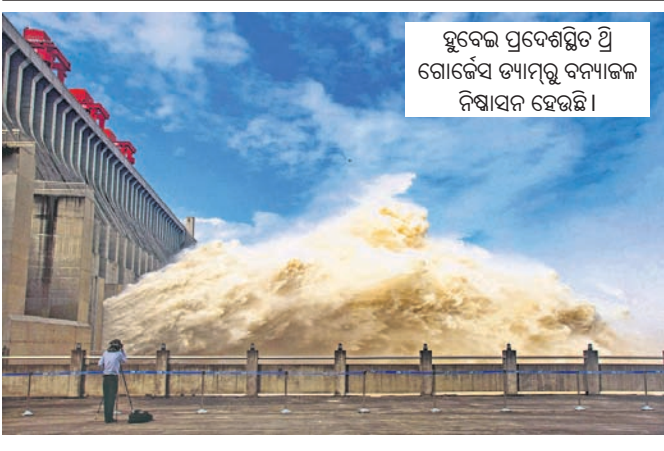
ହୁବେଇ ପ୍ରଦେଶସ୍ଥିତ ଶ୍ରୀ ଗୋବିନ୍ଦ ଡ୍ୟାମ୍ରେ ବନ୍ୟାଜଳ ନିଷ୍କାସନ ହେଉଛି ।

ଯାଙ୍ଗି ନଦୀ ହେଉଛି ଚାଇନାର ମାୟୁଫାଙ୍ଗ୍‌ତ୍ସି ଓ ଶିଫିଂ ପାଇଁ ପ୍ରମୁଖ କ୍ଷେତ୍ର । ସାଂଘାଲିଠାରେ ପୂର୍ବ ଚାଇନା ସାଗରରେ ମିଶିଥିବା ଏହି ନଦୀରେ ଆସିଥିବା ବନ୍ୟା କେବଳ ଚାଇନାର ଅର୍ଥନୀତିକୁ ପ୍ରଭାବିତ କରିନାହିଁ, ବରଂ ବିଶ୍ୱର ଅର୍ଥ ବ୍ୟବସ୍ଥା ପାଇଁ ମଧ୍ୟ ଅଶୁଭ ସଙ୍କେତ ଆଣିଦେଇଛି । ଏହାର ରାଜନୈତିକ ପ୍ରଭାବ ୧୯୮୬ ଏପ୍ରିଲ ୨୬ରେ ଯୋକିଏଟ୍ ଯୁନିୟନର ଚେନୌଟି ବିପର୍ଯ୍ୟୟ ଭଳି ଚାଇନା କମ୍ୟୁନିଷ୍ଟ ପାର୍ଟି (ସିପିସି)କୁ ଅସ୍ଥିର କରିବା ପାଇଁ ପର୍ଯ୍ୟାପ୍ତ । ସାମ୍ପ୍ରତିକ ସଙ୍କଟ ସିପିସି କେନୋରାଲ ସେକ୍ରେଟାରି ତଥା ଚାଇନା ରାଷ୍ଟ୍ରପତି ଶି ଜିନ୍‌ପିଙ୍ଗ୍ ପାଇଁ ଅତୁଟା ସାଜିପାରେ ବୋଲି ଅନେକ ବିଶେଷଜ୍ଞ ମତ ଦେଇଛନ୍ତି । ଆମେରିକାରେ ଜର୍ଜ୍ଜ ଟ୍ରୁମ୍ପ ରାଷ୍ଟ୍ରପତି ଥିବାବେଳେ କାଟ୍ରିନା ଝଡ଼ ତାଙ୍କ ଛବିକୁ ଯେପରି ମଜିନ କରିଦେଇଥିଲା, ଚାଇନାର ବନ୍ୟାକୁ ଜିନ୍‌ପିଙ୍ଗ୍ ସେହିପରି ବିଫଳତା ଭାବେ ଦେଖାଗଲାଣି । ଆମେରିକା, ଚାଇନା, ଜାପାନ ଓ ଭାରତ ସମେତ ଅନେକ ଦେଶ ସହ ବିବାଦରେ ଛନ୍ଦି ହୋଇଯାଇଥିବା ଚାଇନା ରାଷ୍ଟ୍ରପତି ଜିନ୍‌ପିଙ୍ଗ୍ ଶ୍ରୀ ଗୋବିନ୍ଦ ଡ୍ୟାମ୍ ପରିବର୍ତ୍ତନ କରିନାହାନ୍ତି । କରୋନା ଭାଇରସ୍ ନେଇ ଦେଶବାସୀ ଅସନ୍ତୁଷ୍ଟ ଥିବାବେଳେ ବନ୍ୟା ନିୟନ୍ତ୍ରଣରେ ବିଫଳତା ଜନାଗ୍ରୋଷକୁ ବହୁଗୁଣିତ କରିବା ଆଶଙ୍କା ସୃଷ୍ଟି ହୋଇଛି ।