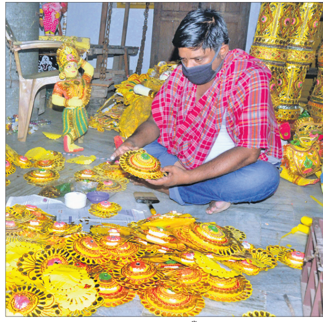
ପୁରୀ ଜଗନ୍ନାଥ ବଜାର ମଠରେ ଝୁଲଣ ବୋଳି ପାଇଁ ଯୋଗବାର ଜଣେ ଶିଳ୍ପୀ ସୋଲ ଓ ଜରିରେ ଫୁଲ ତିଆରି କରୁଛନ୍ତି।