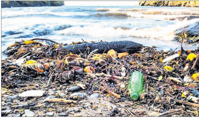
୨୦୪୦ ବେଳକୁ ଆମେରିକାରେ ୧୧ କୋଟି ଟନ୍ ବର୍ଜ୍ୟ ପ୍ଲାଷ୍ଟିକ୍ ପୃଷ୍ଠି ହୋଇଥିବ। ମଣିଷ ସମସ୍ତଙ୍କୁ ସମୁଦ୍ରରେ ଫୋପାଡ଼ିବାର ଯୋଜନା କରୁଛି। ତେବେ ଏହାଦ୍ୱାରା ସାମୁଦ୍ରିକ ଜୀବଜଗତକୁ ବିନାଶ ଦେଇ ଦେବାକୁ ପଡ଼ିବ ବୋଲି ପରିବେଶବିତ୍ କହିଛନ୍ତି।