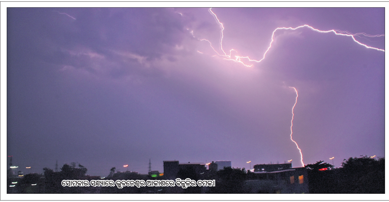
ସୋନପୁର ସହରରେ କୁରକ୍ଷେତ୍ର ଆକାଶରେ ବିଜୁଳିର ନେକା