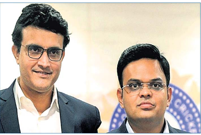
ସୌରଭ ଗାଙ୍ଗୁଲି ଓ କପ୍ ଶାହା।

ଭାରତୀୟ କ୍ରିକେଟ କଣ୍ଠେଇ ବୋର୍ଡ (ବିସିସିଆଇ) ଏବେ ଏକ ଯଦିସଦି ପୁସ୍ତୁର ଦେଇ ଗତି କରୁଛି। ସଭାପତି ଭାବେ ସୌରଭ ଗାଙ୍ଗୁଲିଙ୍କ କାର୍ଯ୍ୟକାଳ ସାମାନ୍ୟତା (ଜୁଲାଇ ୨୭) ଶେଷ ହୋଇଛି।