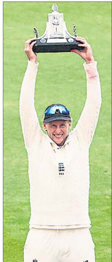
ଟେଷ୍ଟ ସିରିଜ ଟ୍ରଫି ସହ ଇଂଲଣ୍ଡ ଆଧିନାୟକ କୋ ରୁଫି।