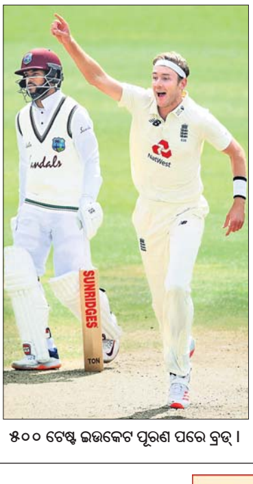
୫୦୦ ଟେଷ୍ଟ ଉଇକେଟ୍ ପୂରଣ ପରେ ବ୍ରୁକ୍ ।

ସହାୟତା ନେଇଛନ୍ତି। ୫୦୦ ଉଇକେଟ୍ କ୍ଲବରେ ଥିବା ଅନ୍ୟ ବୋଲରମାନେ ହେଲେ ଅଷ୍ଟ୍ରେଲିଆର ଶେନ ଓର୍ମି (୭୦୮ ଉଇକେଟ୍), ଭାରତର ଅନିଲ କୁମ୍ଭଲେ (୬୧୯), ଇଂଲଣ୍ଡର ଆଣ୍ଡରସନ (୫୮୯), ଅଷ୍ଟ୍ରେଲିଆର ରେନ ମ୍ୟାକଗ୍ରା (୫୬୩) ଏବଂ ଟେଷ୍ଟିଂ ଟ୍ରାଫିଟ୍‌ରେ କର୍ନା ଖୁଲି (୫୧୯)। ଅଧିକ ଟେଷ୍ଟ ଖେଳିଥିଲେ ହେଁ ବ୍ରୁକ୍ ୨୮୪୩୦ ବଲ୍ ବୋଲି କରି ୫୦୦ ଉଇକେଟ୍ ପୂରଣ କରିଛନ୍ତି। ଏହା ଟେଷ୍ଟ ଜୁନିୟର ତୃତୀୟ ସର୍ବୋଚ୍ଚ ମାଲିକାଣ୍ଡ। ୨୫୫୨୮ ପାଇଥିଲେ। ଶ୍ରୀଲଙ୍କାର ମୁଥୁମୁଲୁ ମୁରଲିଧରନ ୮୦୦ ଉଇକେଟ୍ ନେଇ ଟେଷ୍ଟିଂ ଟ୍ରାଫିଟ୍‌ରେ ଅଧିକାର କରିଛନ୍ତି। ମୁରଲିଧରନ ମାତ୍ର ୮୭ ଟେଷ୍ଟରେ ଏହି ମାଲିକାଣ୍ଡ ସର୍ତ୍ତ କରିଥିବାବେଳେ ବ୍ରୁକ୍ ଏଥିପାଇଁ ୧୪୦ ଟେଷ୍ଟରେ ସହାୟତା ନେଇଛନ୍ତି।