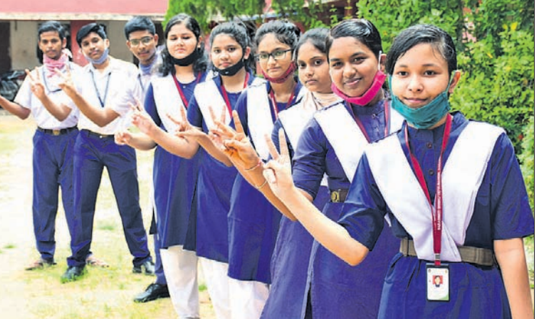
ପରୀକ୍ଷା ଫଳ ପ୍ରକାଶ ପରେ କୁବନେଶ୍ୱର ବରମୁଣ୍ଡା ଶିଶୁ ବିଦ୍ୟାଳୟର ଛାତ୍ରଛାତ୍ରୀମାନେ ଖୁସି ମନାଉଛନ୍ତି।

କଟକ ଅଫିସ୍, ୨୯/୭ ମାଧ୍ୟମିକ ଶିକ୍ଷା ପରିଷଦ (ବୋର୍ଡ) ଓଡ଼ିଶା ଦ୍ୱାରା ପରିଚାଳିତ ମାଟ୍ରିକ ପରୀକ୍ଷା ଫଳ ବୁଧବାର ପ୍ରକାଶ ପାଇଛି। ଚଳିତବର୍ଷର ପାସ୍ ହାର ୭୮.୭୬ ପ୍ରତିଶତ ରହିଛି, ଯାହା ଗତ ବର୍ଷର ପାସ୍ ହାରକୁ ଚ୍ୟାଲେଞ୍ଜିଂ କରିଛି। ୨୦୧୯ରେ ୭୦.୭୮ ପ୍ରତିଶତ ବିଦ୍ୟାର୍ଥୀ ପାସ୍ ହୋଇଥିବା ବେଳେ