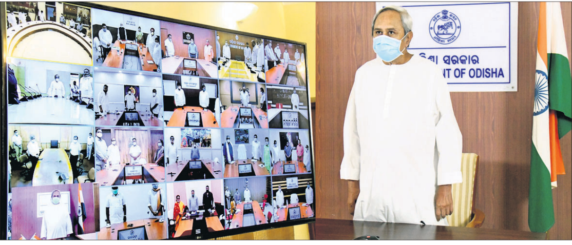
ବିଧାୟକ ଓ ମନ୍ତ୍ରୀଙ୍କ ସହ ମୁଖ୍ୟମନ୍ତ୍ରୀ ନବୀନ ପଟ୍ଟନାୟକ ରୁଧିର ଭିଡ଼ିଓ କନ୍ଫରେନ୍ସରେ ଆଲୋଚନା କରୁଛନ୍ତି।