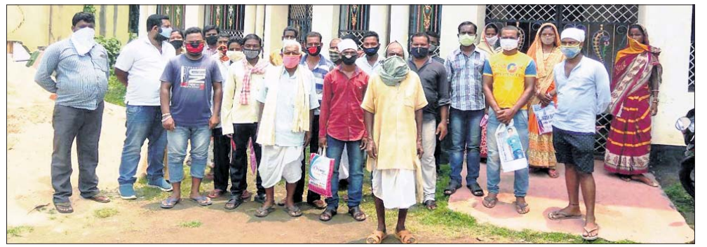
ବିତି ଓ କ କାର୍ଯ୍ୟାଳୟ ସମ୍ପର୍କରେ ଗତପୋଖରୀ ପଞ୍ଚାୟତବାସୀ।