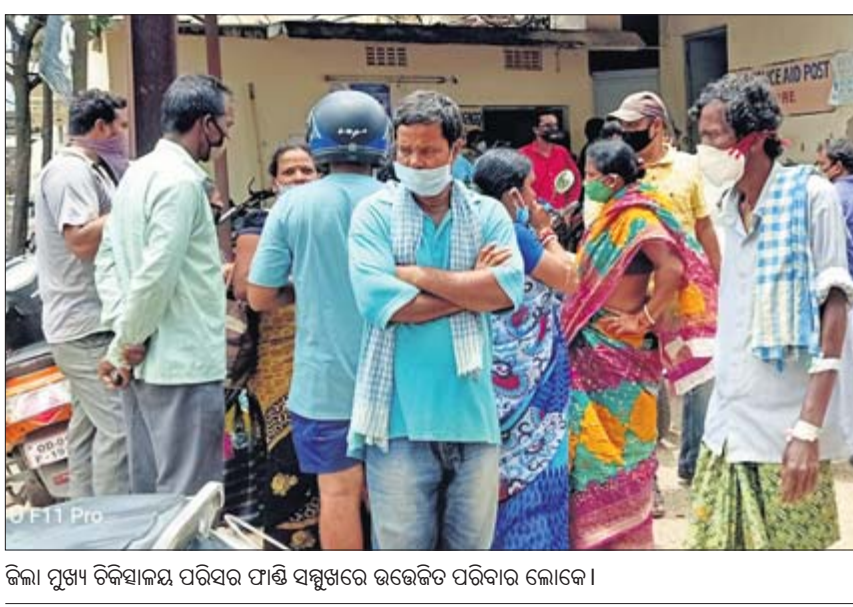
ଜିଲ୍ଲା ମୁଖ୍ୟ ଚିକିତ୍ସାଳୟ ପରିସର ପାଣ୍ଠି ସମ୍ପୃକ୍ତରେ ଉଦ୍ଧେଷ୍ଟ ପରିବାର ଲୋକେ।