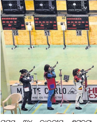
ସମସ୍ତ ୩୪ ଭାରତୀୟ ଶୁଟିଂକୁ ନିର୍ଦ୍ଦେଶ ଦେଇଛି। କରୋନା ଭାଇରସ୍ ପାଇଁ ଅଲିମ୍ପିକ ଗେମ୍‌କୁ ଆସନ୍ତାବର୍ଷକୁ ଘୁଞ୍ଚାଇ ଦିଆଯାଇଛି।

ରହିବ। କାର୍ଡିଫି ରେଞ୍ଜ ଲୁଲାଇ ାରୁ ବ୍ୟବହାର ପାଇଁ ଖୋଲାଯାଇଛି। କୋର୍ଟ୍ ଜଣଙ୍କ କେବଳ ଗତ ଜୁଲାଇ ୨୪ରେ ସେକ୍ସର ପ୍ରଶାସନିକ ବିଭାଗକୁ ଆସିଥିଲେ। ସେ ଖେଳପଡ଼ିଆକୁ ଯାଇ ନାହାନ୍ତି କିମ୍ବା ସେକ୍ସରେ ଡ୍ରେସିଂ ନେଉଥିବା କୋର୍ଟ୍‌ଗଣ ଆଥଲେଟିକ୍ ସହିତ କଥାବାର୍ତ୍ତା ହୋଇନାହାନ୍ତି। ପ୍ରୋଟୋକଲ୍ ଅନୁସାରେ ସମସ୍ତ ପଦକ୍ଷେପ ନିଆଯାଇଛି। ସେକ୍ସରକୁ ବିଶୋଧନର ବ୍ୟବସ୍ଥା କରାଯାଇଛି। ଏହାଦ୍ୱାରା ଶୁଟିଂ ମାନକ ଡ୍ରେସିଂ କାର୍ଯ୍ୟ ପ୍ରଭାବିତ ହେବ ନାହିଁ। ଅଗଷ୍ଟ ୧ରୁ ଡ୍ରେସିଂ ପେରିବା ଲାଗି ଅଲିମ୍ପିକ କୋର୍ଟ୍ ଗ୍ରୁପ୍