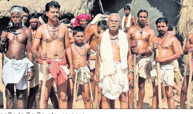
ଚଳଚ୍ଚିତ୍ର 'ଆଦିମ ବିଚାର'ର ଏକ ଦୃଶ୍ୟ।