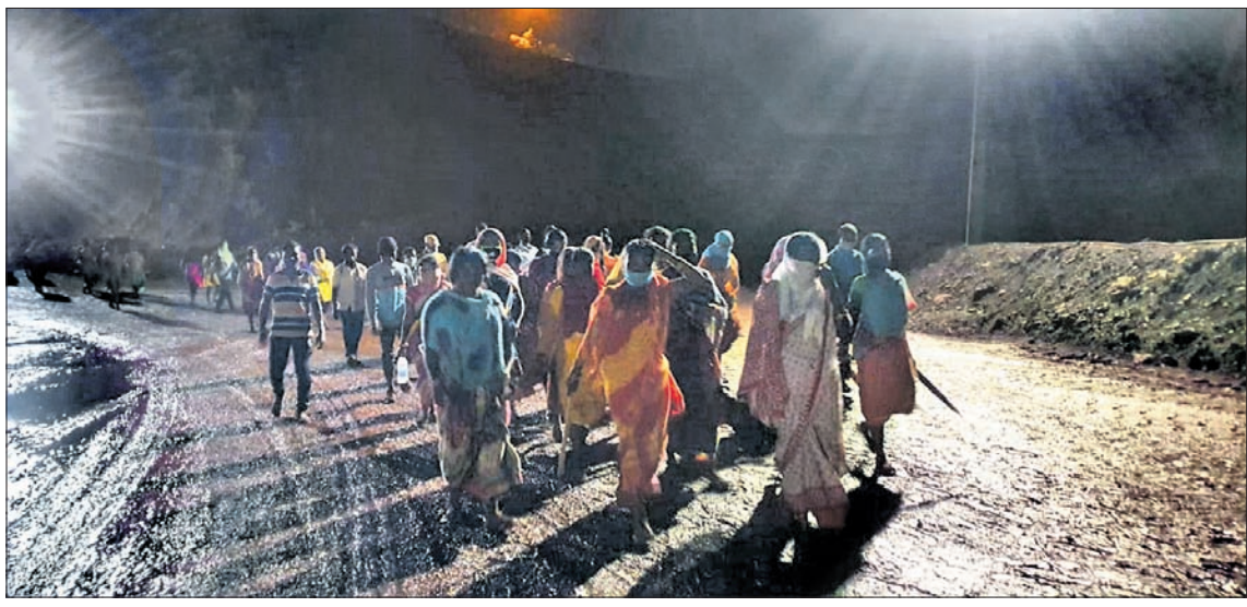
କେଏସ୍‌ଟିଏ ଖଣିରେ ପ୍ରତିବାଦକାରୀ ଶ୍ରମିକ ।