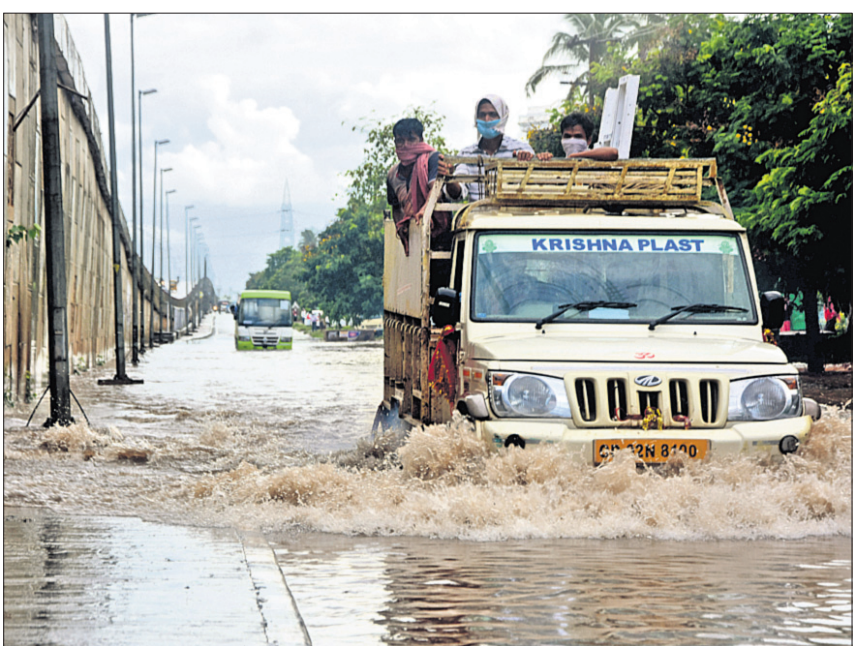
ଭୁବନେଶ୍ୱରର କେତେକ ସ୍ଥାନରେ ଗୁରୁବାର ବର୍ଷା ହେବାରୁ ଲକ୍ଷ୍ମୀପାପ ମିଳିବ ସମ୍ଭୁକ୍ତ ଜାତୀୟ ରାଜପଥରେ ଜମି ରହିଥିବା ଆଖୁ ପଞ୍ଜର ପାଣି ।