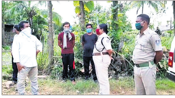
ଘଟଣାସ୍ଥଳରେ ଯୋଗାଯୋଗ ଅଧିକାରୀ ତଦନ୍ତ କରୁଛନ୍ତି।

ଡେକାନାଲ ଅଫିସ/ ଭାପୁର(ଡି.ଏନ.ଏ.), ୩୦୭ ରାସ୍ତାରେ ଚଳାଇ ଦେଇ ନ ଥିଲେ। ମା'ବାପା ନ ଥିବା ବେଳେ ଘରେ ପଶି ବୁଦ୍ଧିବହାର ପ୍ରଦର୍ଶନ କରୁଥିଲେ।