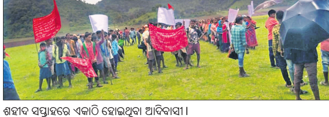
ଶହୀଦ ସପ୍ତାହରେ ଏକାଠି ହୋଇଥିବା ଆଦିବାସୀ।

ମାଓବାଦୀମାନେ ଗତ ୨୮ ଜୁଲାଇ ସପ୍ତାହ ପାଇନ କରୁଛନ୍ତି। ଗୋଟିଏ ପଟେ ଶହୀଦ ସପ୍ତାହ ପାଳୁଥିବା ବେଳେ ଅନ୍ୟପଟେ ସ୍ୱାଭିମାନ ଅଞ୍ଚଳରେ ବହୁପରିଶର ପ୍ରଜାମେଳି ହୋଇଥିବା ନଜରକୁ ଆସିଛି।