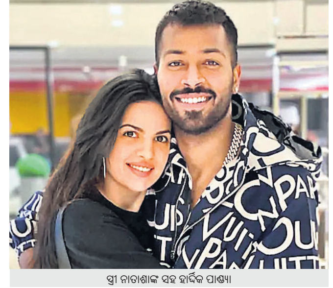
ସ୍ୱା ନାତାଶାଳ ସହ ହାରିକ ପାଣ୍ଡ୍ୟା

ନୂଆଦିଲ୍ଲୀ, ୩୦।୭ ଭାରତୀୟ ତାରକା ଅଲରାଉଣ୍ଡର ହାରିକ ପାଣ୍ଡ୍ୟା ପିତା ହେବାର ସୌଭାଗ୍ୟ ଲାଭ କରିଛନ୍ତି। ପତ୍ନୀ ନାତାଶା ଷ୍ଟାକୋଭିଚ୍ ଏକ ପୁତ୍ର ସନ୍ତାନର ଜନନୀ ହୋଇଛନ୍ତି। ୨୬ ବର୍ଷୀୟ ପାଣ୍ଡ୍ୟା ଏ ନେଇ ଉତ୍ସାହ କରି ଘୋଷଣା କରିଛନ୍ତି। ଆମେ ଏକ ପୁତ୍ର ସନ୍ତାନର ମାତାପିତା ହେବାର ସୌଭାଗ୍ୟ ଲାଭ କରିଛୁ। ସେ ମଧ୍ୟ ଶିଶୁର ଫଟୋ ଅପଲୋଡ୍ କରିଛନ୍ତି। ଏଥିରେ ଶିଶୁର ହାତ ଦେଖା ଯାଉଛି। ଭବୋଦାରରେ ପିଲା ଜନ୍ମ ହୋଇଥିଲା। କୋଭିଡ୍-୧୯ କାରଣରୁ ସାତା ଦେଶରେ ଲକ୍ଷ୍ମଣର ଜାରି କରାଯାଇଥିବା ବେଳେ ଦୁଇଟି ବିବାହ କରିଥିଲେ। ଏହା ପରେ ମେ ମାସରେ ପାଣ୍ଡ୍ୟା ଓ ନାତାଶା ସନ୍ତାନ ଜନ୍ମ ହେବା ସମ୍ପର୍କରେ ସୂଚନା ଦେଇଥିଲେ। ପିତା ହେବା ପରେ ପାଣ୍ଡ୍ୟାଙ୍କ ନିକଟକୁ ଅଭିନୟନର ସୁଅ ଛୁଟିଛି। ଅଧିକାଂଶ ବିବାହ କୋଭିଡ୍ ମଧ୍ୟ ତାଙ୍କୁ ଅଭିନୟନ ଜଗତରେ ଛାଡିଛି। ରୁମ୍ ଦୁଇଟି